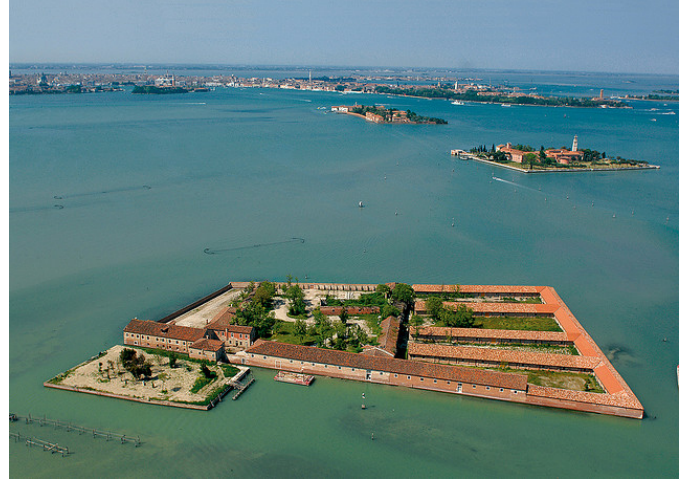
GÖRSEL 1: Günümüzde Lazzaretto Vecchio ( https://www.lazzarettonuovo.com/content/uploads/201402/LZnsito_News3.jpg )

Lido Adası'na çok yakın, Venedik kent merkezi ile Lido arasında ve Venedik'e 2 km. uzaklıktaki uygun konumu ve coğrafi özellikleriyle 3 Santa Maria di Nazareth Adası, karantina uygulaması için seçilmiştir.