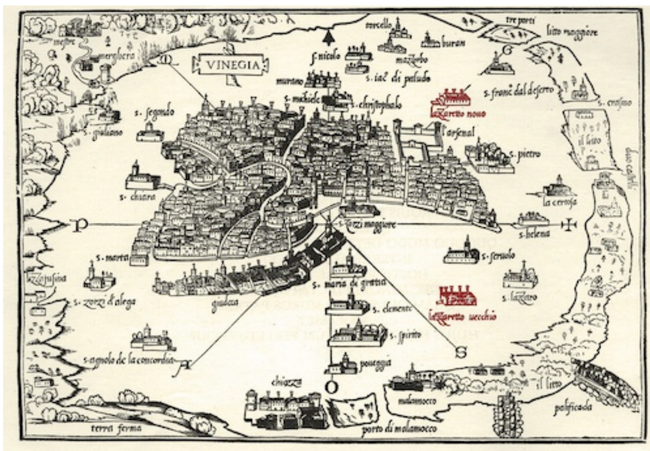
GÖRSEL 3: 1528 tarihli bir Venedik haritasında Lazzeretto Vecchio ve Nuovo’nun konumları (Benedetto Bordone “ Vinegia ” 1528 ).

Lazzeretto Vecchio ile Nuovo’nun tasvirlerinin de yer aldığı Benedetto Bordone imzalı 1523 tarihli bir Venedik haritasında, Lazzeretto Vecchio’nun, batı cephesindeki küçük bir ahşap iskele ile lagüne açılan, tek katlı bir yapıdan ibaret olduğu anlaşılmaktadır (Görsel 3 ve 4).