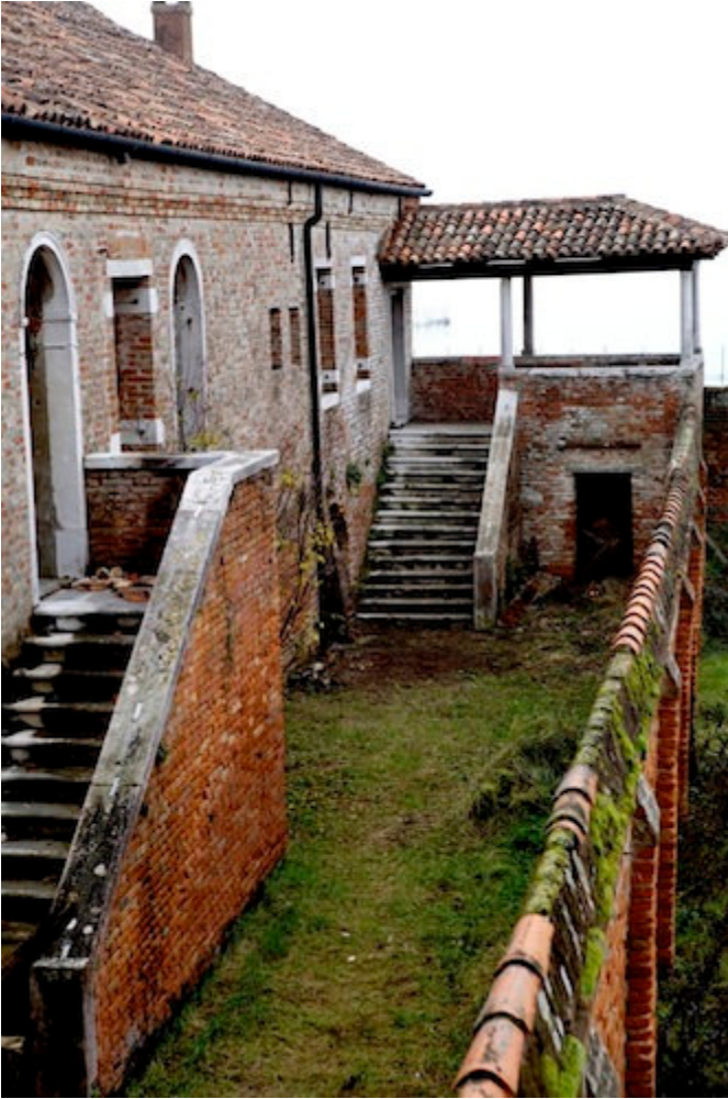
GÖRSEL 11: Yönetim binasının ("Priorado" ya da "Casa del Priore") verandası ( https://www.flickr.com/photos/lazzarettovecchio/16410500376/in/photostream/ )

Lazzaretto Vecchio, 19. yüzyılın ortalarına kadar, başlangıçta kısmen ve daha sonra tamamen askeri depo haline dönüştürülmeden önce, istisnai acil gereksinimler için dahi olsa, karantina yapısı olma özelliğini korumaya devam etmiştir. 19. yüzyılın sonlarına doğru yaşanan yeniden yapılanma sürecinde lazzalettoda bazı binalar yıkılmıştır. Yıkılanlar arasında kilise ve kiliseye ait beşgen planlı çan kulesi ile Ortaçağdan kalma yönetim binası da vardır. Akabinde, 15-16.yüzyıllara tarihlenen kule formundaki iki barut deposu da yıkılmış; barut ve diğer mühimmatı, suların yükselmesi neticesinde oluşan nemden koruyarak depolamak ve havalandırmak amacıyla, ahşap bir yürüme yolu da inşâ edilmek suretiyle, yapı topluluğuna yeni tezolar eklenmesi yoluna gidilmiştir. Lazzaretto Vecchio'nun askeri amaçla kullanıldığı bu dönemde, yapı topluluğunun bir bakıma pasif koruma sürecinde olduğu düşünülebilir. Bu süreç 1965 yılına kadar devam etmiş ve ada bu tarihten itibaren otuz yıl boyunca hayvan barınağı olarak kullanılmıştır ( https://www.lazzarettovecchio.it/storia/ ). 1995 yılından sonra yapıların ve özellikle portal ve su kuyularında yer alan figürlü yüksek kabartmalar ihtiva