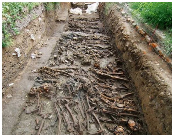
GÖRSEL 13: Lazzaretto Vecchio'da ortaya çıkarılan toplu mezarlardan biri ( https://www.mosevenezia.eu/wp-content/uploads/2015/06/Pagine-da-2007-Anno-15-n.-1-2-pag.-82-97.pdf ).

Lazzaretto Vecchio'da yapılan arkeolojik kazılarda, bilinen gömme geleneklerinden farklı olarak binaların temeline yakın mesafede ortaya çıkarılan toplu mezarlar dikkat çekicidir (Görsel 13).