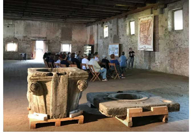
GÖRSEL 14-15: 2018 yılında bulunan 14. yüzyıla ait işlemeli kuyu taşı ve kasesi, temizlik ve onarım çalışmaları için, geçici olarak iç mekânda sergilenmektedir ( https://www.lazzarettovecchio.it/ritrovata-la-vera-da-pozzo-trafugata-cinquantanni-fa/ ).

Hiç kuşkusuz, önemli bir yüzdesini Osmanlı teba'sından olan tüccarların oluşturduğu Lazzaretto Vecchio sakinlerinden kalan izler arasında, büyük tezonda sıva üzerine kırmızı boya kullanılarak Osmanlı Türkçesi ile yazılmış yazılar, kültür tarihimiz açısından özellikle değerlidir. Yazılar maalesef okunamayacak kadar bozulmuş durumdadır (Görsel 16).