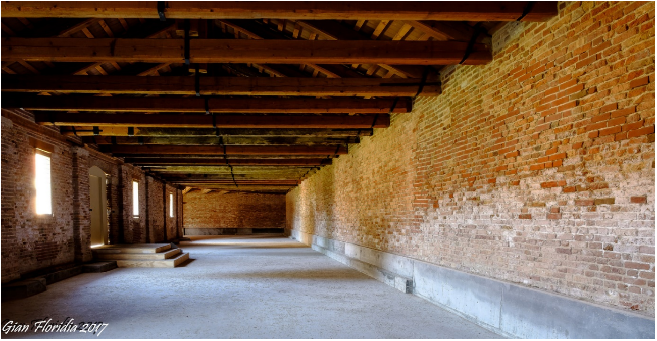
GÖRSEL 8: Eski Tezon'un (Tezon Vecchio) içeriden görünümü.