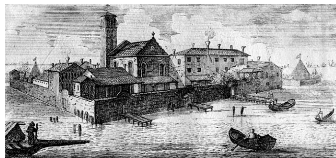
GÖRSEL 5: Askeri kullanım için yıkılmadan önce 1700 yılında basılmış bir çizimde Lazzaretto Vecchio Adası (B.Q.S. - ID 2179), (Caniato, 2013: 1).

A. Tezonlar/Depolama Hacimleri: Plan üzerinde, adanın kuzey cephesinde "U" formunda dört geniş avlu oluşturacak biçimde, kuzey-güney doğrultusunda dar ve uzun dikdörtgen hacimler olarak yerleştirilmiş beş ana