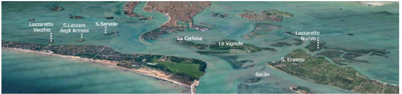
GÖRSEL 2: Lazzaretto Vecchio ve Nuovo'nun lagündeki konumları ( https://www.lazzarettovecchio.it/storia/ )

Tarihi bilinen en eski lazarettoyu 4 barındıran ada, özellikle Doğu Akdeniz'den gelen ve çoğunluğunu tüccar ya da askerlerin oluşturduğu yolcuların ilk anda kontrol edildiği çok önemli bir karantina istasyonu işlevi görmüştür. Bu husus, sözkonusu yapılar topluluğunun Osmanlı tarihi araştırmaları için de ayrı bir öneme sahip olduğunu ortaya koyar. Venedik ile Osmanlı arasındaki karşılıklı deniz ticareti hacminin yoğunluğu düşünüldüğünde, lazarettonun inşa edilmesine duyulan ihtiyacın, kenti özellikle gemilerle gelen Osmanlı teb'asından yolcuların yayabilecekleri veba riskine karşı korumak amacıyla doğduğu muhakkaktır (Cliff, Smallman-Raynor, Stevens, 2009: 211).