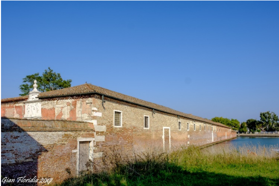
GÖRSEL 7: Eski Tezon'un ( Tezon Vecchio) güney cepheden görünümü. Lazzaretto Vecchio fotoğrafı karşıda görülen Lido Adası'na çok yakındır.