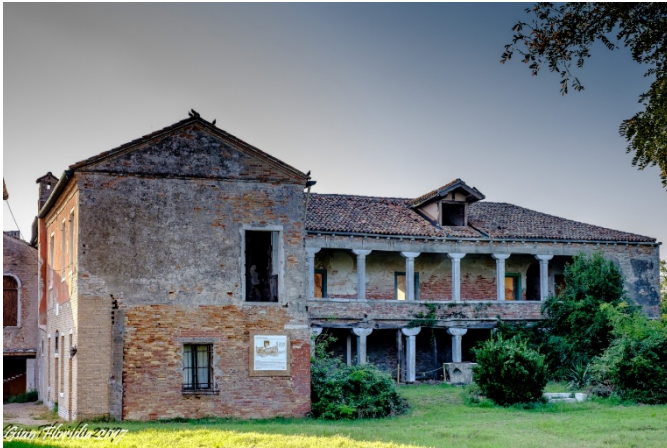
GÖRSEL 9: Lazzaretto Vecchio'da konut olarak kullanılan "Chiostro" adlı yapı. (It.Chiostro: 1. Revak ya da revaklı (kemerli) avlu 2. Manastır. Bkz.

https://tr.glosbe.com/it/tr/chiostro ), (Fotoğraf: Gian Florida, 2017 https://www.flickr.com/photos/gianflordia/31510730838/in/photostream/ ).