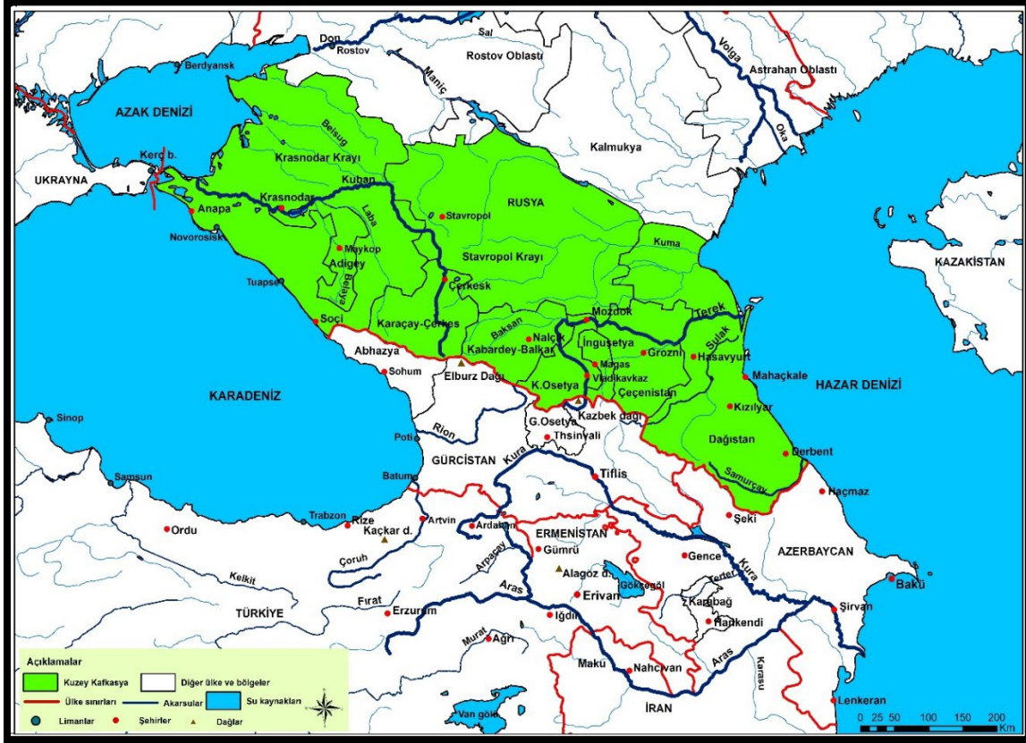
Harita 5: Rusya Kafkasya'sı (Za-Kavkaz)

göstergesi olarak askeri açıdan stratejik bir bölgesi olduğunu göstermektedir. Bu bağlamda Rusya için Kafkasya, topografik açıdan güvenli olmasının yanı sıra ticari, askeri ittifaklar kurabildiği bölge anlamına da gelmektedir.