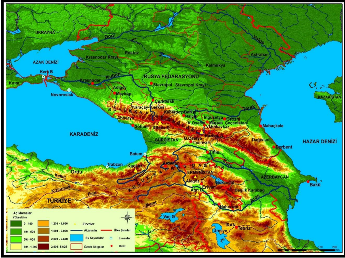
Harita 2: Kafkasya Fiziki Coğrafyası

Karabağ (2014:13)'a göre temas hatları olarak sınırlar, mülkiyetin mekânsal-tarihsel sembolleridir. Kafkasya; Hazar Havzası, Orta Asya, Ortadoğu, Anadolu ve Avrasya kuzey bozkırları ile temas oluşturmuş ve bu bölgeleri birbirine bağlamış, kimi zamanda bu bölgelerle ortak zemin oluşturmuştur. Örneğin, topoğrafik açıdan Kafkasya'nın devamı niteliği taşıyan Kuzeydoğu Anadolu, Kafkasya'nın bir parçası olmuştur. Büyük Kafkas Dağları kuzeybatı-güneydoğu doğrultusunda Karadeniz ve Hazar Havzaları arasında uzanırken, Küçük Kafkas Dağları, Türkiye, Gürcistan, Ermenistan ve Azerbaycan arasında yayılmış (koroloji) göstermektedir. Çoruh, Aras ve Kura Türkiye'den kaynağını alan nehirler olarak Kafkasya'nın bir parçasıdır (Topchishvili, 2013: 62, harita 2). Bu tamamlayıcılık yalnızca coğrafi devamlılık değil aynı zamanda tarihi sürecin getirdiği bütünselliktir. Coğrafi yakınlık ve tamamlayıcılık kimi zaman geniş bir Kafkasya algısını, kimi zamanda sınırların ötesini bilmeyen halklar için Kafkasya tanımını sınırlandırmış, daraltmış ve bütünsel bir Kafkasya'nın avantajlarını kamufle etmiştir.