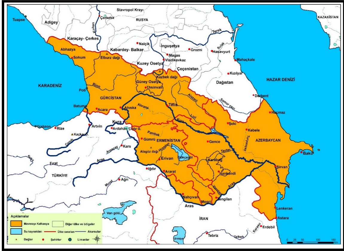
Harita 6: Maverayı Kafkasya

Buna karşın Osmanlı Devleti, jeopolitik amaçlarını Karadeniz Havzası'nda Kırım üzerinden, Doğu Anadolu ile Kafkasya'yı birleştiren eyaletleri oluşturmak sureti ile başlamış ve Kafkasya'yı Kuzeydoğu Anadolu ile birlikte tanımlamaya çalışmıştır. Buna göre Osmanlı Devleti'nin Kuzeydoğu Anadolu'yu içine alan bugünkü hem kuzey hem de güney Kafkasya'yı Kafkasya olarak gördüğü anlaşılmaktadır. Selçuklu Devleti ile Osmanlı Devleti'nin kuruldukları konum itibari ile farklı Kafkasya algıları ve etkilerinin olduğu anlaşılmaktadır. Selçuklu Devleti Türkmenlere yurt bulma ve İran toprakları üzerinden Kafkasya ve Anadolu'ya uzanma amacını güderken, Osmanlı Devleti'nin Kırım'dan başlayarak Kafkasya'ya yayılma amacı olduğu ortaya çıkmaktadır. Bu minvalde Selçuklu Devleti'nin demografi üzerinden Osmanlı Devleti'nin ise İslam jeopolitiği üzerinden bir Kafkasya algısı olduğu görülmektedir. Tarihi süreç Kafkasya'ya dönük Selçuklu Devleti'nin demografik açıdan daha güçlü bir bakış açısının olduğunu göstermektedir. Nitekim bugün Selçuklu Devleti Kafkasya'da Türk nüfusunun belirleyici unsurunu oluşturmuşken, Osmanlı Devleti, Kafkasya'dan Anadolu'ya zorunlu göç eden Kafkas halklarının varlığı ile temsil olunmaktadır. Ayrıca Osmanlı Devleti'nin Kafkasya algısını Kırım'a bağlayarak şekillendirmesi Kafkasya'ya dönük kayıplarını da şekillendirmiştir. Osmanlı Devleti'nin o dönemki güçsüzlüğü ve Rusya ile olan mücadelesi de Kafkasya üzerinde zayıf bir politika yürütmesine neden olmuştur.