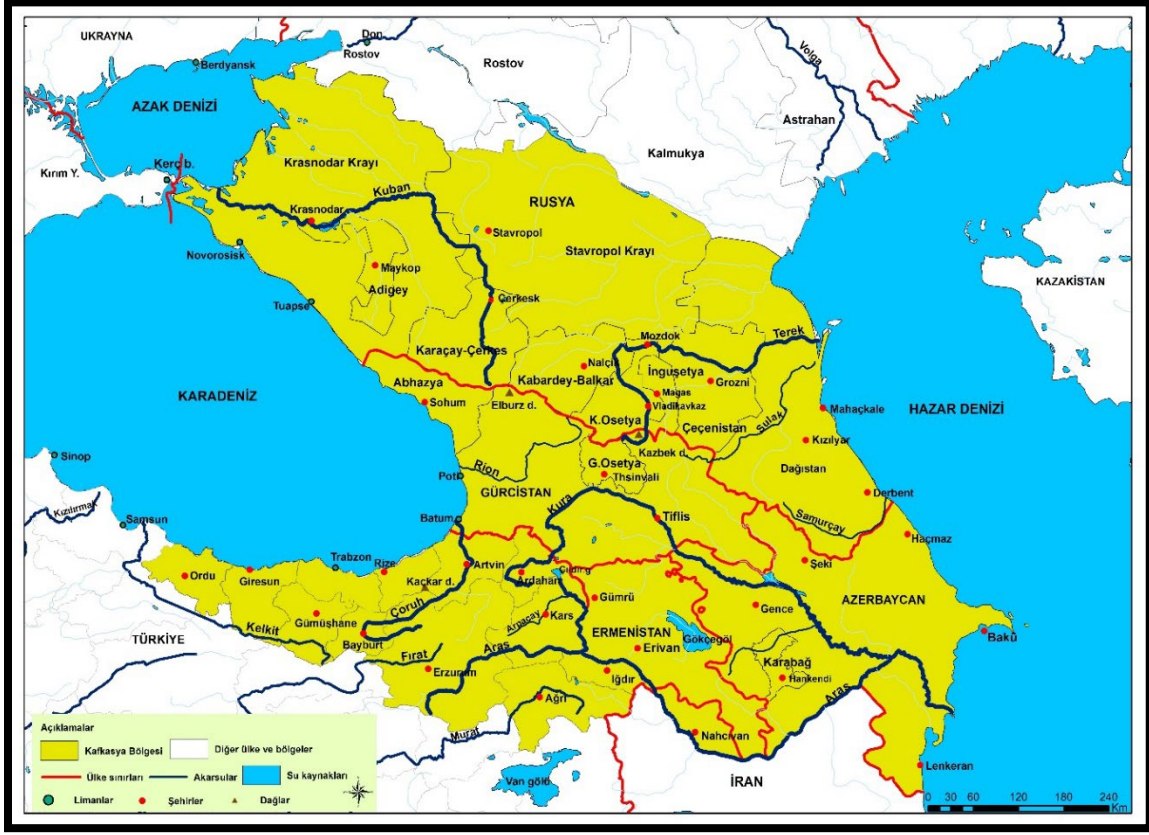
Harita 7: Türkiye Kafkasyası

Türkiye’de bugün sınırların ötesinden bihaber oldukça fazla sayıda vatandaşımız bulunmakta olduğu bilinmektedir. Kafkasya algısı yanlış bir zihinsel haritalama ile Kuzey veya Güney Kafkasya olabilmektedir. Türkiye’nin Kafkasya algısı tarihi bağlamda bölgesel siyasal gücüne ve dışsal aktörlerin faaliyetlerine göre şekillenmiş ve zamanla değişim göstermiştir. Bu bağlamda Türkiye’nin Kafkasya algısı zayıftır. Coğrafi unsurlar esas alındığında Türkiye açısından Kafkasya sınırları, batı sınırı Türkiye’de Ordu ilinde Mesudiye’den (Mesudiye Orta Karadeniz ile Doğu Karadeniz bölümlerinin kesiştiği konumda yer alır. Böylece Mesudiye’den itibaren Doğu Karadeniz bölümü başlamaktadır. Doğu Karadeniz Dağları, Küçük Kafkas’ın bir parçasıdır) başlayarak, Kaçkar dağları, Kürtün-Kelkit–Soğanlı dağlarını takip eder. Trabzon, Artvin, Ardahan, Rize, İspir, Erzurum, Kars, Iğdır, Ağrı’yı içine alan ve güney sınırını Aras nehrinin çizdiği bölgeyi kapsamalıdır (Harita 7). Türkiye Kafkasyası’nın geniş bir coğrafi alanı içermesi bu bölgeye dair “Bütünleşik Kafkasya” dolayısı ile bölgesel olarak güçlü bir siyasi, ekonomik imaj yaratacaktır. Bu bağlamda Türkiye’nin Kafkasya algısı Kuzey ve Güney Kafkasya’yı içine alacak biçimde geniş olmalıdır.