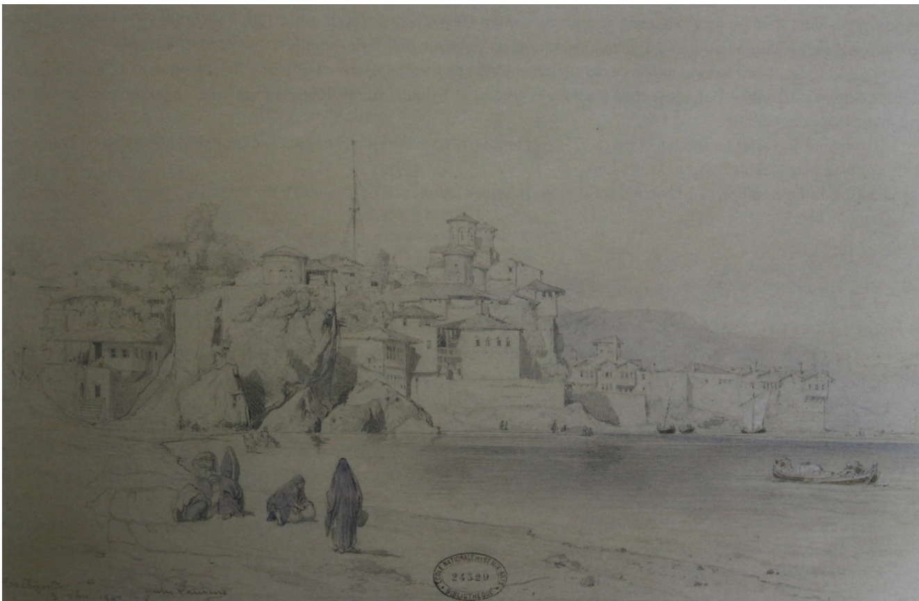
GÖRSEL 2: Trabzon ("Jules Laurens'in Türkiye Yolculuğu" adlı sergi kataloğundan)

yerleşmenin tümüyle konut alanına dönüştüğü görülmektedir. İki ya da üç katlı olmalarına bakılarak, malikâne olması muhtemel konutların, iki ya da dört yöne eğimli kırma çatıları ve önlerinde bahçeleri mevcuttur.