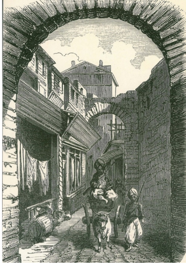
GÖRSEL 5: Trabzon

Edmund Ollier'in kitabında 9 yer alan ve kentin bir bölümünü gösteren panoramik gravürde (Görsel 6), birçok seyahatin da kent fizikine dair gözlemlerinde