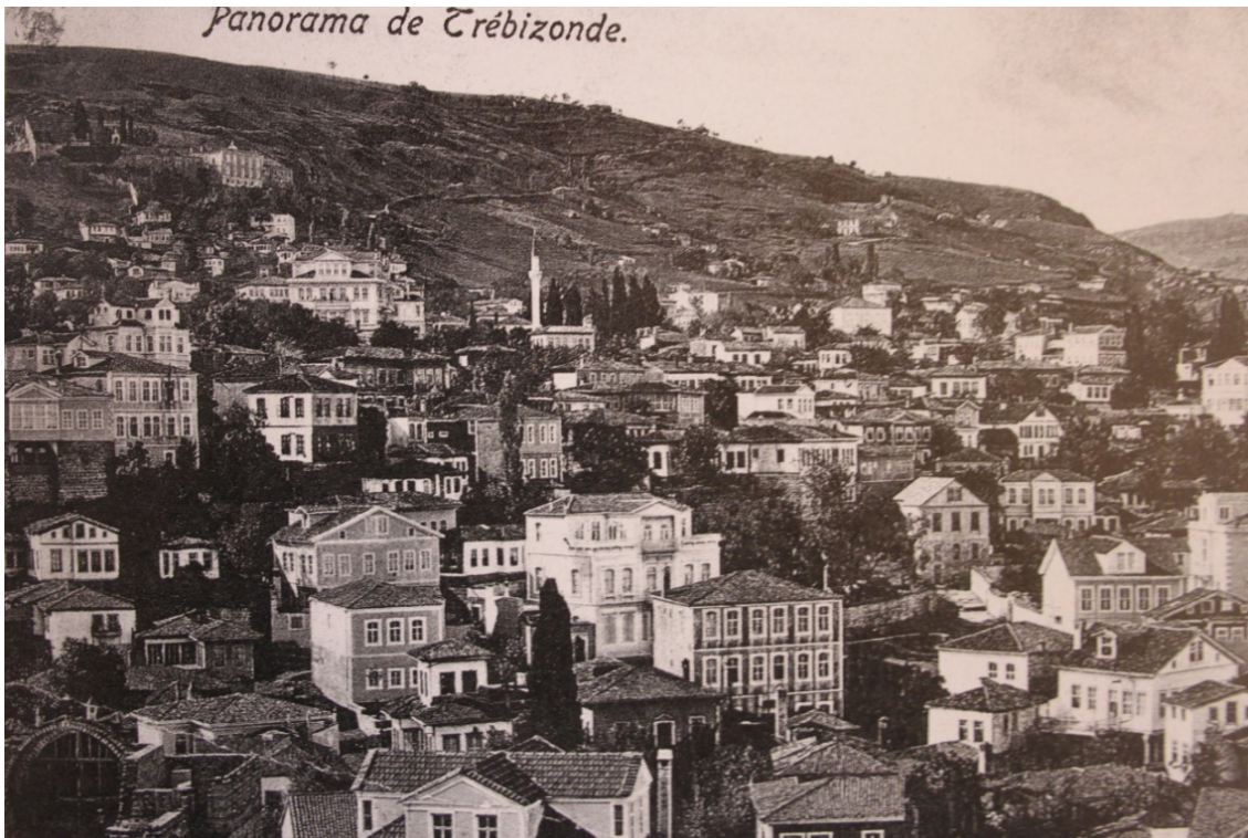
GÖRSEL 9: Trabzon (İ. G. Kayaoğlu , Ö. Ciravoğlu ve C. Akalın'dan)

üst katları ise ahşap karkaslı ve araları muhtemelen tuğla, kerpiç ya da taş dolguludur. Kentte kırma ya da beşik çatılı (Görsel 10) konutlar çoğunlukta olup, alaturka kiremitli ve geniş saçaklıdırlar.