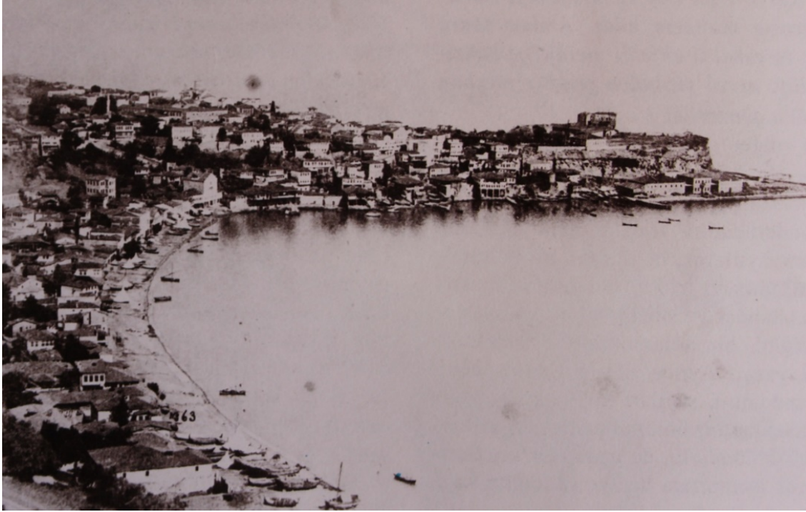
GÖRSEL 8: Trabzon (İ. G. Kayaoğlu , Ö. Ciravoğlu ve C. Akalın'dan)

Sonuç olarak, konutlar, tek ya da iki katlı ve bazen de ticaret sayesinde sermaye birikimi yaratmış varlıklı ailelere ait ve konak (Görsel 9) diye nitelendirilebilecek yapılarda üç katlı olup, genellikle bitişik nizamdadır. Konutların yapı malzemesinin, ahşap, kerpiç, taş ve tuğla olduğu anlaşılmaktadır. Konutların, zemin katları taş,