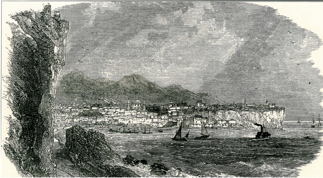
GÖRSEL 6: Trabzon (M.Sevim'den)

belirttiği, yamaçlarda teras şeklinde yükselen konutlar açıkça görülmektedir.