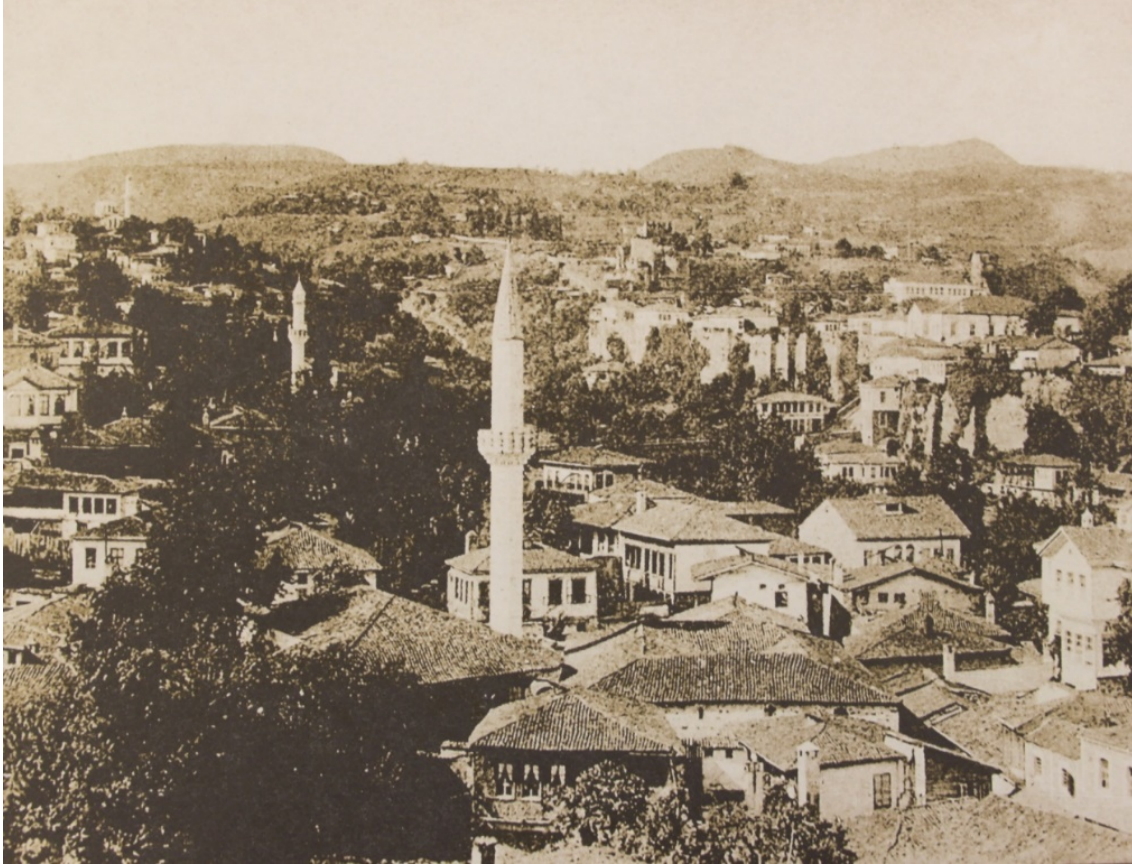
GÖRSEL 10: Trabzon (İ. G. Kayaoğlu , Ö. Ciravoğlu ve C. Akalın'dan)

Kimi konutlarda altı-üstlü iki, üç, dört ve hatta bazı konutlarda beş sıra halinde düzenlenmiş düzey dikdörtgen pencere açıklıklarının yer aldığı tesbit edilmiştir.