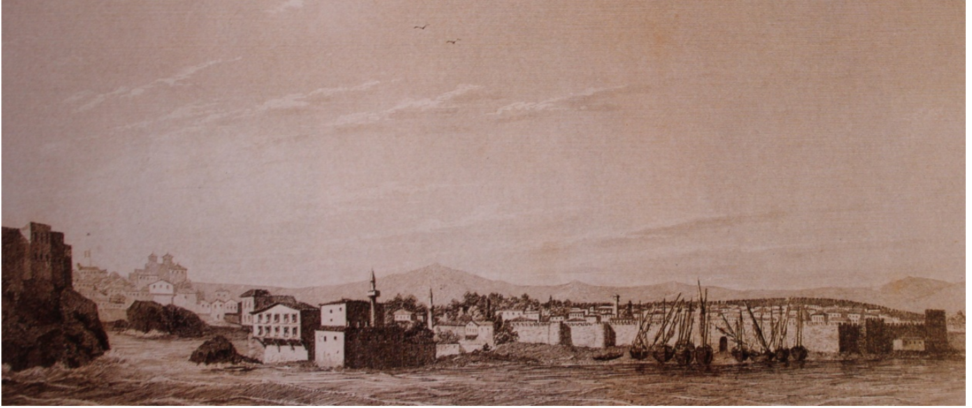
GÖRSEL 1: Trabzon (C. Texier'den)

19. yüzyılın ikinci çeyreğinde Trabzon'a gelen bir diğer seyyah, doğa bilimci Victor Fontainer'in, "Kimi özel evler, saldırıya uğrayan ev sahibinin kolayca kaçabilmesine imkân sağlayan gizli geçitlerle birbirine bağlıdır. Kentin çevresi ise hayal edilmesi güç güzelliklerle doludur" (Kayaoğlu, vd., 1997: 245) diye tanımladığı konutlar ve bunlarda olduğu söylenen gizli geçitlerin , kentin bütünündeki diğer konutlar için de sözkonusu edilip edilemeyeceği tartışmalıdır.