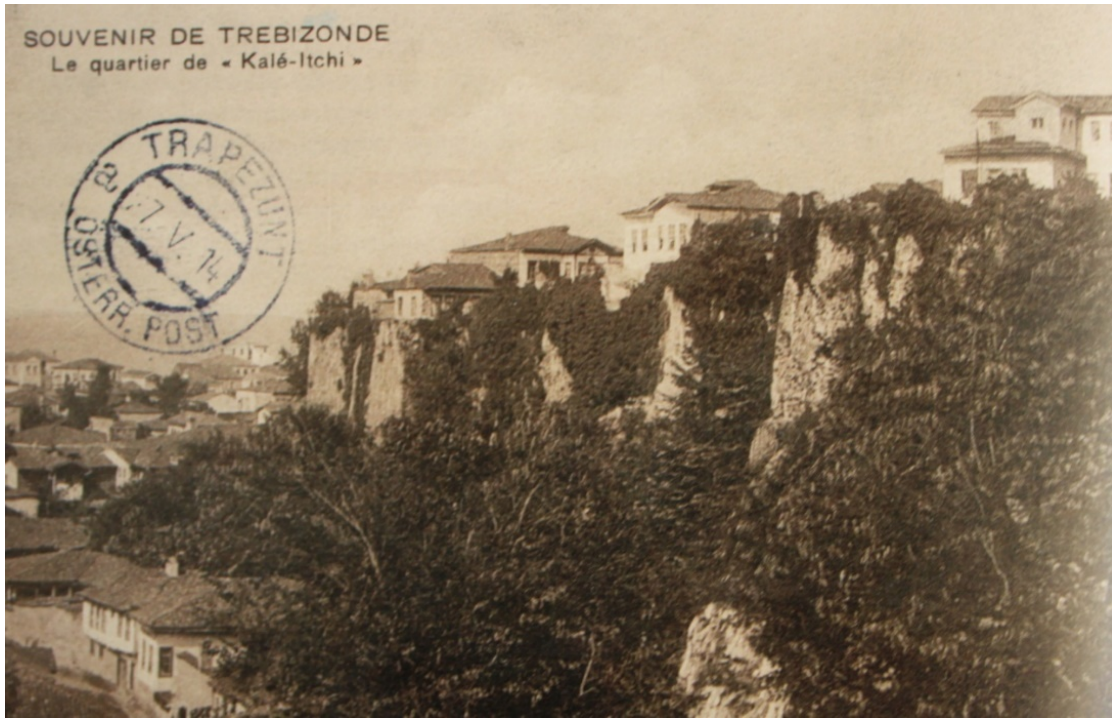
GÖRSEL 7: Trabzon (İ. G. Kayaoğlu , Ö. Ciravoğlu ve C. Akalın'dan)

Seyyahların gözlemlerinden ve gravürlerinden de anlaşılıyor ki, kentin topoğrafyası, konut alanının oluşumunda önemli bir etkidir. Bu durum kent'e ilişkin bir fotoğrafta da açıkça görülmektedir (Görsel 7). Bazen, konutların eski kale duvarları ya da burçlar üzerine oturtulduğu gösteren fotoğraflarda tespit edilebilmektedir (Görsel 8). Kentte görülen bu tür bir kullanımın, 19. yüzyılda ve Anadolu'nun genelinde yaygınlaşmış olduğu iddia edilebilir.