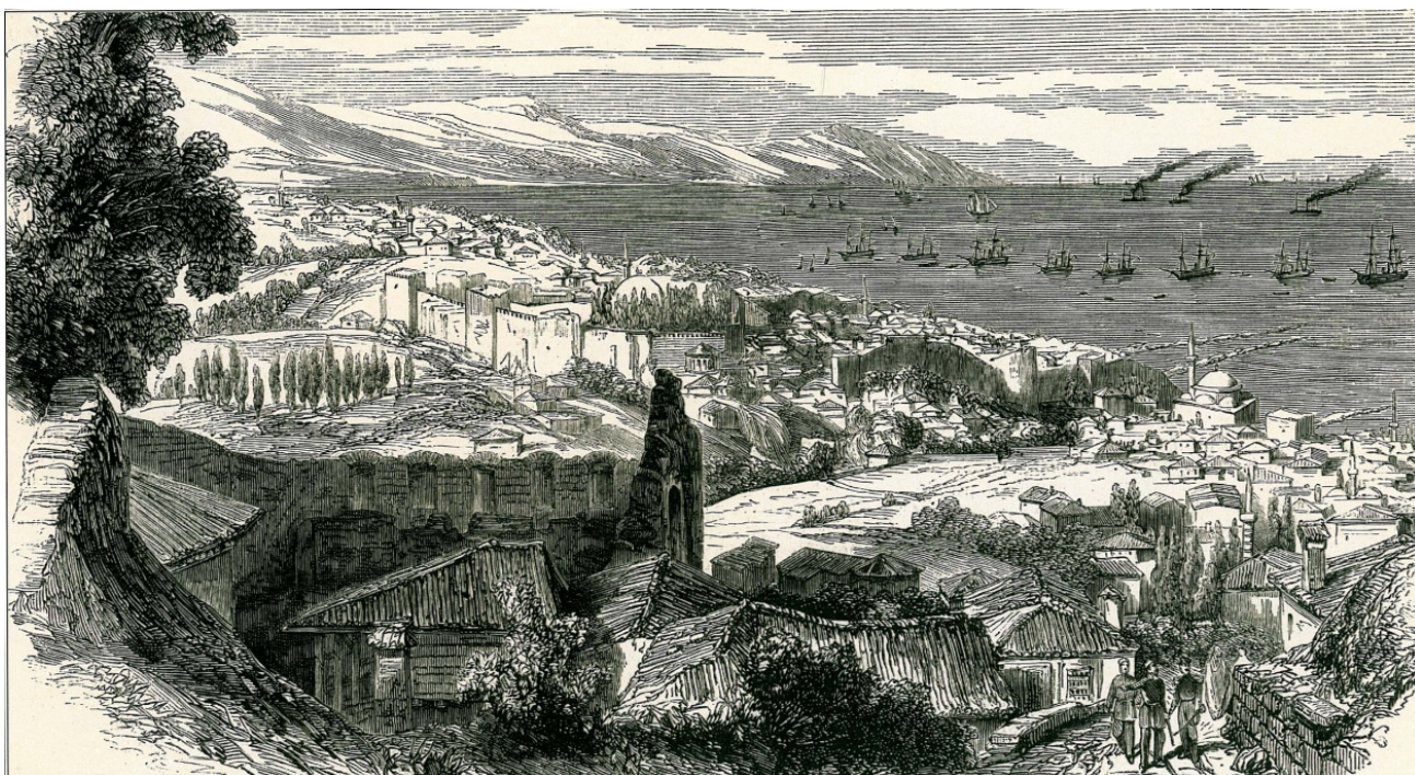
GÖRSEL 3: Trabzon (F. Mornand'dan)