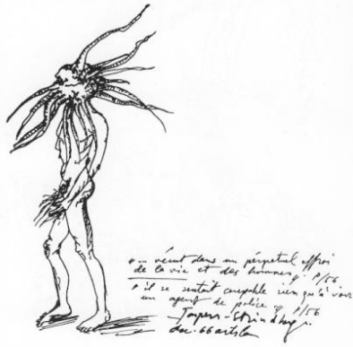
Görsel 3, Yüksel Arslan, Defterler, Kağıt üzerine mürekkep, 1966.

Yüksel Arslan'ın temel eğilimi okumadır. İnsanlığın psikolojik, entelektüel varoluşu ile ilgili metinler okur ve bunları okurken özel defterlerine (sanatçı günlüğüne) notlar çıkarır. Bu kitapta derlenen, defterlerinde el yazısı ile iç içe geçen desenlerdir. Günlükte yer alan desenler, ilk bakışta ansiklopedilerdeki ya da ders kitaplarındaki, okunulan bilgilerin daha iyi kavranması noktasında açıklayıcı betimlemeye, canlandırmaya dönük çizimleri (illüstrasyonları) andırmaktadır. Bu bakımdan bilginin aktarılması noktasında pozitivist bir temsiliyet anlayışında kendi fenomenlerini oluşturan bir yapıya dönüşmektedir. Oysa Arslan'ın defterleri bu tür söz-yazı-resim arası temsiliyet şemalarının mantığını alt üst eder. Bunun temel sebebi her bir desenin veya alınan notların kendileri başka bir dil, bir yazı oluşturur ve bunlarla da kendilerine özgü metinlere evrilmektedir. Neticede bu metinler bizi gerek temsil bağlamında işaret ettikleri düşünceleri, gerekse sanat ve kuramı arasındaki ilişkileri tekdüze bir biçimde yeniden düşünmeye kışkırtmaktadır (Artun, 2010-240-241).