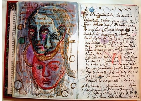
Görsel 1, Frida Kahlo’un Günlüklerinden Bir Kesit, 2013 Mexico City, Frida Kahlo Müzesi, Meksika

Kahlo’nun kendi için tutmuş olduğu günlüğünü sergilemek istediğine dair her hangi bir bilgi bulunmamaktadır (Oktay, 2019:60). Etik açıdan bu durum her ne kadar olumsuz bir tablo yaratmış olsada dahi sanatçıların günlükleri topluma mal olduğu için günümüz sanat anlayışı bu durumu göz ardı etmektedir.