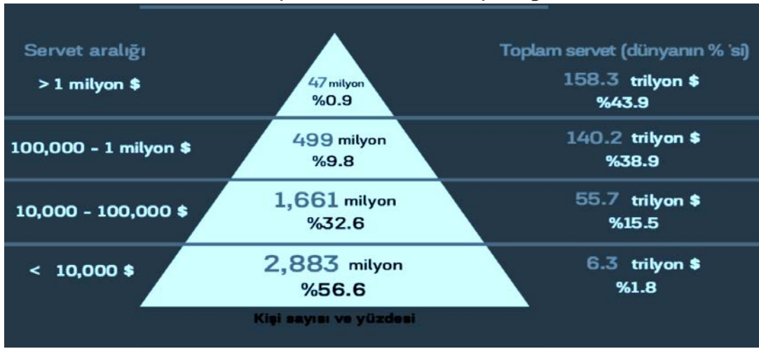
Şekil 1. Küresel Servet Eşitsizliği

yerleşik olduğu toplumlarda dahi gelir adaletsizliği, yoksulluk ve sefalet en temel sorunlar arasında yer alır. Gelir ve servet eşitsizlikleri siyasal eşitsizliklere dönüşmekte, gücün belli çıkar gruplarının eline geçmesine neden olmaktadır. Ayrıcalıklı bu çıkar grupları sistemi ele geçirerek kendi tercihlerine göre şekillendirmekte ve katlanan eşitsizliklere yol açmaktadırlar (İnsani Gelişme Raporu, 2019:12). Eşitsizlik, toplumsal yaşamın ekonomi, siyaset, sosyal, eğitim, sağlık ve cinsiyetçi uygulamalarında görülmektedir. Dünya nüfusunun %0,9'luk kesimi toplam küresel servetin neredeyse %44'ünü, diğer bir ifade ile yarıya yakın kısmını elinde tutmaktadır (Credit Suisse, 2019:12). Dağılımdaki bu eşitsizlik ile ilgili ayrıntılı açıklamalar Credit Suisse Databook'ta verildiği haliyle Şekil 1'de yer almaktadır (Credit Suisse, 2019:9).