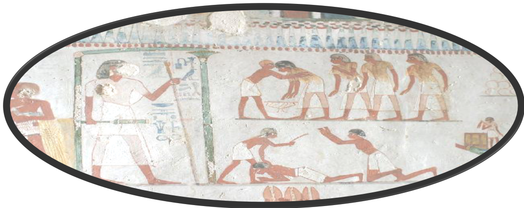
Resim 1 Eski Mısır'da Vergi (M.Ö. 3.000)

Bu günkü anlamından ve içeriğinden kısmen farklı olarak Vergiler, insan toplulukları ile birlikte uygarlığın ilk devirlerinde gönüllülük esası ile ortaya çıkmışlardır. Vergilerin ilk devirlerde kendisinin öncülü olarak topluluk halinde yaşamının kaçınılmaz gereklerinden sayılarak gönüllülük esası ile ortak yaşam ve yönetim ihtiyaçlarının karşılanması amacıyla parasal ödemelerden ziyade takas devirlerinin doğasına da uygun olarak hediye, bağış biçimindeki aynı katkılarla ortaya çıkmaya başladığı bilinmektedir (Kayan, 2000, s. 80-87). Vergisel kamu ödemeleri tarih boyunca geçirilen değişim süreci ile birlikte yaklaşık bu günkü anlamına yakın olarak M.Ö. 4.000