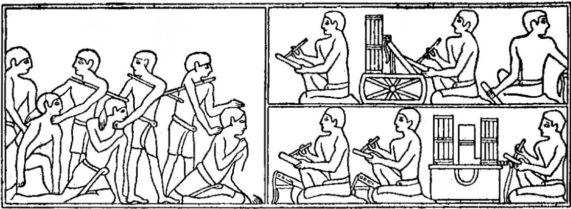
Resim 3 İlkçağlarda Vergi Ödemeyenlerin Cezalandırılması

Eski çağlarda krallar tarafından konulan ağır vergiler sık sık halkın tepki göstermesine yol açmıştır. Bunun sonucunda devlet karşıtı güçler ile ağır vergi yüklerine karşı çıkan halk kitleleri birleşerek birçok devrimin tarihe geçmesini sağlamışlardır. Örneğin, Sümer kent devleti M.Ö. 2.415-2.400 dolaylarında Lagas'ı yöneten Urukagina Kralı'nın Urukagina Reformları veya Urukagina Yasaları adıyla bilinen metine göre; Tanrı Ningursu, Legaş krallığını Urukagina'ya vermiştir. Urukagina 36.000 adam arasından kral olarak seçilince eski yasaları yeniden uygulamaya koymuştur. Borçlarını ve vergilerini ödeyemeyen Lagas oğulları için ilk vergi affını çıkarmıştır. Pamuk üzerinden alınan vergiler ile mabetlerdeki mükelleflerden alınan vergileri kaldırmış.