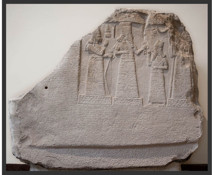
Şekil 1 İsin'li Lipit İstar vergi oranında 1/5'den 1/10'a ilk indirim (M.Ö 1870).

Dördüncü yüzyılda bireylerin Em-laklarını belirlemek amacıyla özel polis güçleri görevlendirilmiştir. Bireylerin sahip oldukları gizli servetlerini belirlemek için kadın ve çocuklar işkenceye maruz kalmışlardır. Aristokratlar, vergiden kaçınmak amacıyla özel konum ve ödülleri kabul etmemişlerdir. Sıradan olan vatandaşlar kendi işlerini ve evlerini terk edip dışlanmış bireyler haline gelmişlerdir. Bunlara ek olarak Roma'da ahlakî çöküş, tüccarların zarar etmeleri, bürokratik despotizme, uzun süren savaşlar, nüfus azalışı ve ağır vergiler Roma'nın çöküşüne neden olmuştur (Scott R. Schmedel, 1994, s. 6).