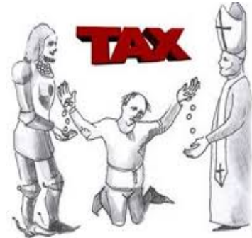
Resim 6 Orta Çağda “İspanyol Vergi Politikaları”

Roma imparatorluğunun çöküşüyle birlikte kurulmuş olan mali sistemleri de işlevini yitirmeye başlamış veya Osmanlılar gibi yerini alan diğer egemenlikler, beylikler, krallıklar tarafından ülkenin ekonomik durumuna göre değiştirilerek aynı veya benzer adlarla ve oranlarla uygulanmaya devam edilmiştir. Arazi sahipleri ile dönemlerin egemenleri veya iktidarları arasında yüzyıllarca süren çatışmalar doğmuştur. Protestanlığın reformuna kadar geçen süreçte kiliselerin yetkileri de giderek artmıştır. Hatta kiliseler devletten daha fazla gelirlere sahip olmuş (Tax, 2009, s. 1). Devletin giderleri arttıkça devlet veya sarayın ihtiyaçlarının karşılanmasında ganimet savaşlarının yanı sıra sadece halktan alınan vergiler kaynak olarak kullanılmıştır. Din adamları ise, kamusal ve eğitim hizmetleriyle uğraşmaları nedeniyle vergiden muaf tutulmuşlardır. Buna göre 13. yüzyılda hibe şeklinde olan ve sürekli alınmayan vergiler 14. yüzyılda süreklilik kazanmıştır (Project, 2004, s. 16).