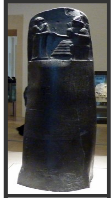
Resim 4: Hammuarbi yasalarında, bir asker, balıkçı ve bir vergi mükellefinin tarlası bahçesi veya evi satılamaz, satılsa dahi Tableti (Sözleşmesi) kırılır. Tımarının bir kısmı karısına veya kızına devredilemez veya rehin verilemez (M.Ö. 1790).

• Balık Vergisi(mas-da-ria): Balıkların pazarlama sırasında uygulanan vergidir. Bu balıklar büyük (300 balık kapasiteli) ve küçük sepetlerde pazarlama işlemi gerçekleştirirdi.