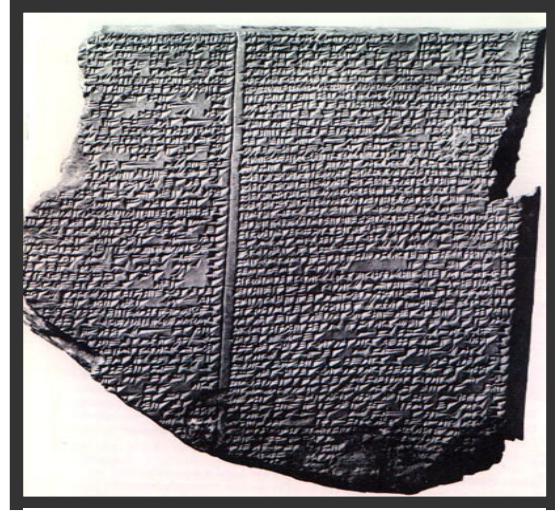
Resim 5 Dağların ve ülkelerin ürünlerini sana vergi olarak getirsinler! Gilgamesh 6.tablet (M.Ö. 2100)

• Gıda Vergisi (Nishatum): Aşuuna Kanunu'nda adı geçen vergi gıdalar üzerine konan vergidir.