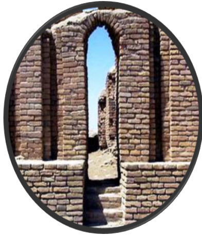
Resim 2; "bit kârim" Eski Babil'de Vergi ve Hazine Dairesi (M.Ö. 2.500)

İlk dönemlerdeki bu gönüllülük, sınırsız insan ihtiyaçları ve nispeten daralan doğal kaynaklar karşısında yaşanan savaşlar ve neticesinde köleleştirme ve mülk edineme hukukunun ortaya çıkmaya başlaması ile yerini zorunluluğa terk etmeye başlamıştır.