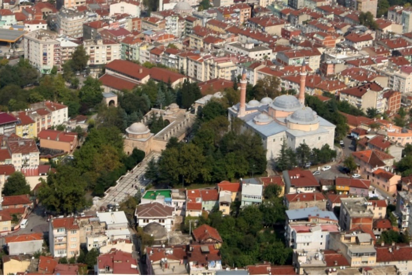
Görsel 3: Bursa Yıldırım Bayezid Külliyesi'nin havadan görünümü.