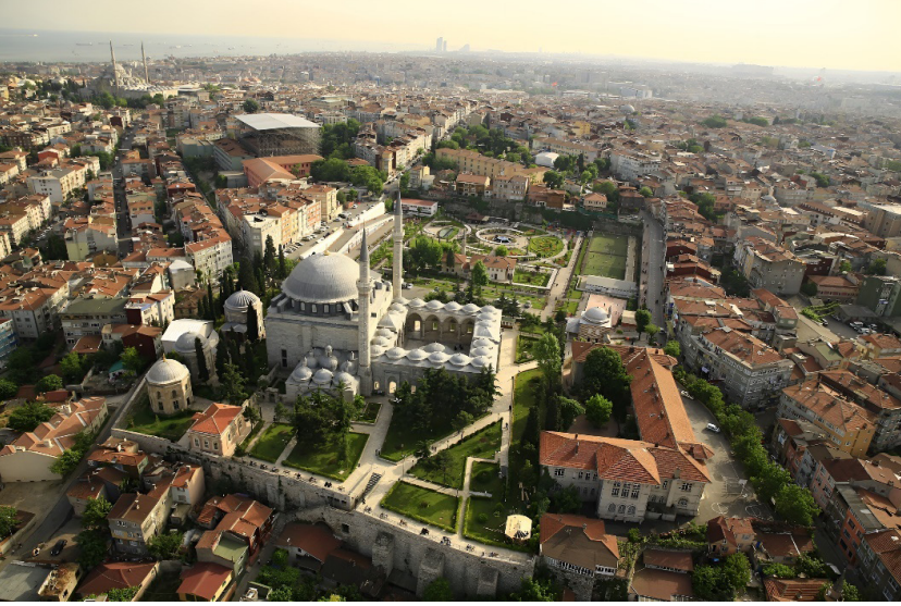
Görsel 8: İstanbul Yavuz Selim Külliyesi'nin havadan görünümü.