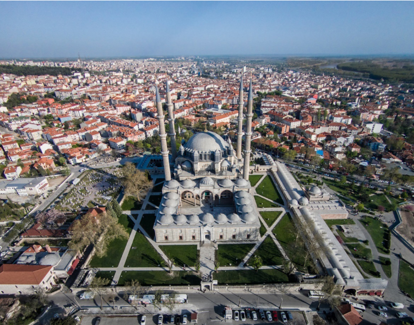
Görsel 6: Edirne Selimiye Külliyesi'nin havadan görünümü.