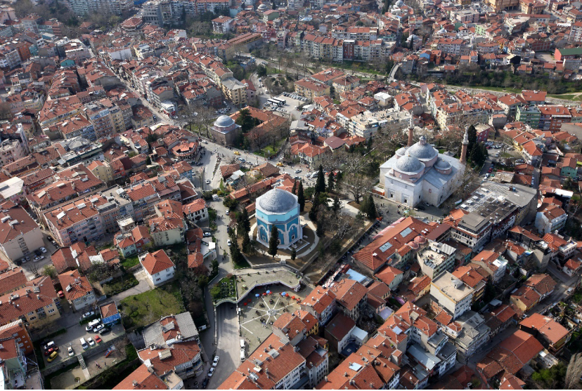
Görsel 4: Bursa Yeşil Külliyesi'nin havadan görünümü. (Erişim 27 Eylül 2023, https://www.kulturportali.gov.tr/turkiye/bursa/TurizmAktiviteleri/yesil-kulliyesi )

Onaltıncı Yüzyıllarda İnşa Edilen Osmanlı Külliyelerinin Mimarî Esasları Konusunda Bazı Görüşler," İstanbul Üniversitesi I. Milletlerarası Türkoloji Kongresi (15-20 Ekim) içinde (İstanbul: 1973), 795-814; Kazım Baykal, Bursa ve Anıtları (Bursa: Cenklar Matbaası, 1993).