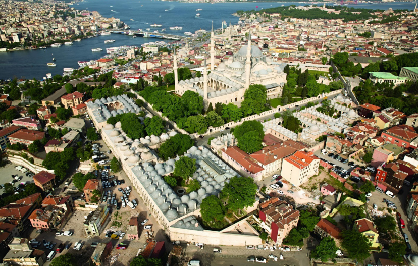
Görsel 9: İstanbul Süleymaniye Külliyesi'nin havadan görünümü. (Erişim 27 Eylül 2023, https://istanbultarihi.ist/312-suleymaniye-camii-ve-kulliyesi )

Vakıf-bâni ilişkisi üzerinden Osmanlı şehirlerinin kuruluş- gelişmesine Anadolu'dan verilebilecek en somut örnekler arasında; Lâle Devri'nin önemli yöneticilerinden, III. Ahmed'in sadrazamı Nevşehirli Damad İbrahim Paşa'nın, kurmuş olduğu vakıflar aracılığı ile İstanbul'da