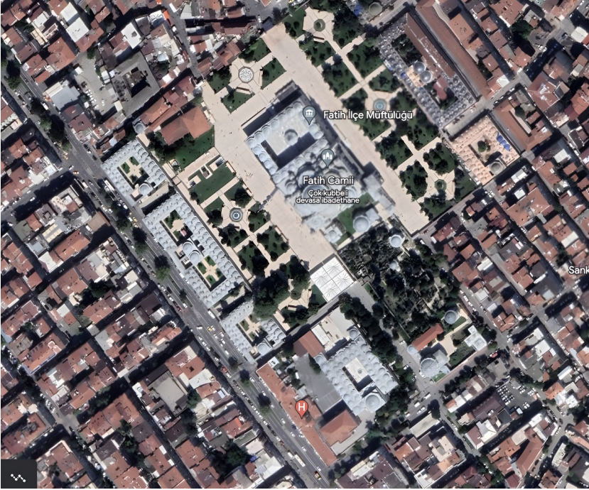
Görsel 7: İstanbul Fatih Külliyesi'nin havadan genel görünümü.

yayınlarına; Aptullah Kuran, "Mimar Sinan'ın Külliyesi," Mimarbaşı Koca Sinan, Yaşadığı Çağ ve Eserleri içinde (İstanbul: Vakıflar Genel Müdürlüğü, 1988), 1:167-173; Ekrem Hakkı Ayverdi, "Fatih Devri Sonlarında İstanbul Mahalleleri, Şehrin İskanı ve Nüfusu," Vakıflar Dergisi 4 (1958), 245-248. Zeynep Nayır, Osmanlı Mimarlığında Sultan Ahmet Külliyesi ve Sonrası (1609-1690) (İstanbul: İTÜ Mimarlık Fakültesi Yayınları, 1975); Stefanos Yerasimos, "Osmanlı İstanbul'unun Kuruluşu," Osmanlı Mimarlığının 7 Yüzyılı: "Uluslarüstü Bir Miras" içinde, ed. Nur Akın, Afife Batur ve Selçuk Batur (İstanbul: YEM Yayınları, 1999), 195-205; Doğan Kuban, İstanbul, Bir Kent Tarihi (İstanbul: Türkiye İş Bankası Kültür Yayınları, 2017).