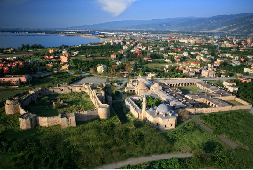
Görsel 2: Payas Sokollu Mehmed Paşa Külliyesi'nin genel görünümü.

Osmanlı idaresine M. 1326 yılında giren Bursa, devletin ilk başkenti olmasıyla ön plana çıkmaktadır. Osmanlı şehirleriyle ilgili olarak yapılan gruplandırmalara göre, öncesi Bizans iken, Osmanlı şehrine dönüştürülen yerleşimler sınıfına dahil edebileceğimiz Bursa 29 , Osmanlı Devleti'nin ilk büyük şehri ve başkenti olmasının yanı sıra, Edirne ve İstanbul'a başta fizikî karakter olmak üzere, pek çok bakımlardan örnek teşkil etmesiyle de dikkati çekmektedir.