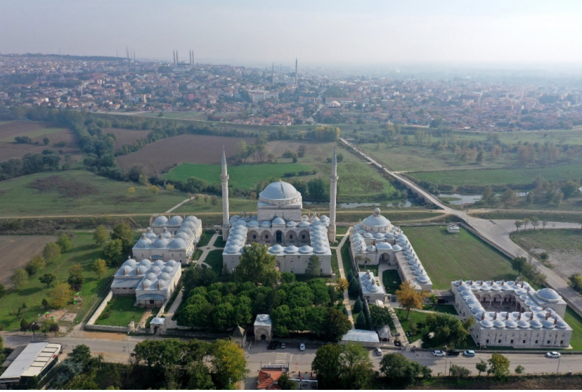
Görsel 5: Edirne II. Bayezid Külliyesi'nin havadan görünümü. (Erişim 27 Eylül 2023, https://idsb.tmgrup.com.tr/ly/uploads/images/2020/11/04/69717.jpg )