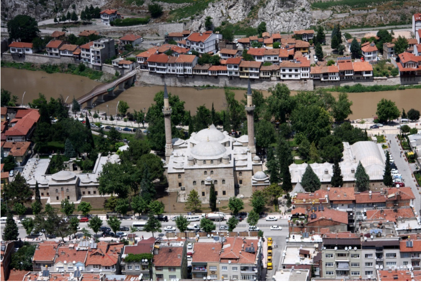
Görsel 1: Amasya II. Bayezid Külliyesi'nin havadan görünümü.

Ayrıca, şehir ve kasabaları birbirine bağlayan yollar üzerinde, gün ağardıktan, hava kararınca kadar geçen sürede katedilen mesafede (arazinin ve yolun durumuna göre yaklaşık 25-35 km. aralıklarla) oluşturulan konaklama- dinlenme yerlerinde inşa edilen ve ağırlık merkezini ticaret ve konaklama amaçlı han ve kervansarayların oluşturduğu menzil külliyesi , buldukları yerlerin şenlenmesine ve zamanla birer kasabaya, şehre dönüşmesine imkân tanımıştır. Merkezlerinde inşa edilen menzil külliyesi ile birer şehir ve kasabaya evrilen bu şehir ve kasabalardaki külliyelelere örnek olarak; İstanbul'dan Avrupa'ya giden ana yol üzerinde bulunan Havsa'daki Sokollu Mehmed Paşa Külliyesi (M. 1560), Babaeski'deki Semiz Ali Paşa Külliyesi (M. 1562), Lüleburgaz'daki Sokollu Mehmed Paşa Külliyesi (M. 1654- 1579); İstanbul'dan başlayıp Mekke'ye giden hac yolu üzerindeki Gebze Çoban Mustafa Paşa Külliyesi (M. 1523- 24), Ilgın'daki Lala Mustafa Paşa Külliyesi (M. 1576), Karapınar Sultan Selim Külliyesi (M. 1560- 63) 28 , Ulukışla'daki Öküz Mehmed Paşa Külliyesi (M. 1619), Payas'taki Sokollu Mehmed Paşa Külliyesi (M. 1567- 1574) (G. 2) verilebilir. Yollar üzerinde inşa edilen bütün bu ve diğer menzil külliyesi, banilerince kurulan vakıflar sayesinde inşa edilmiş ve varlığını günümüze kadar korumuşlardır.