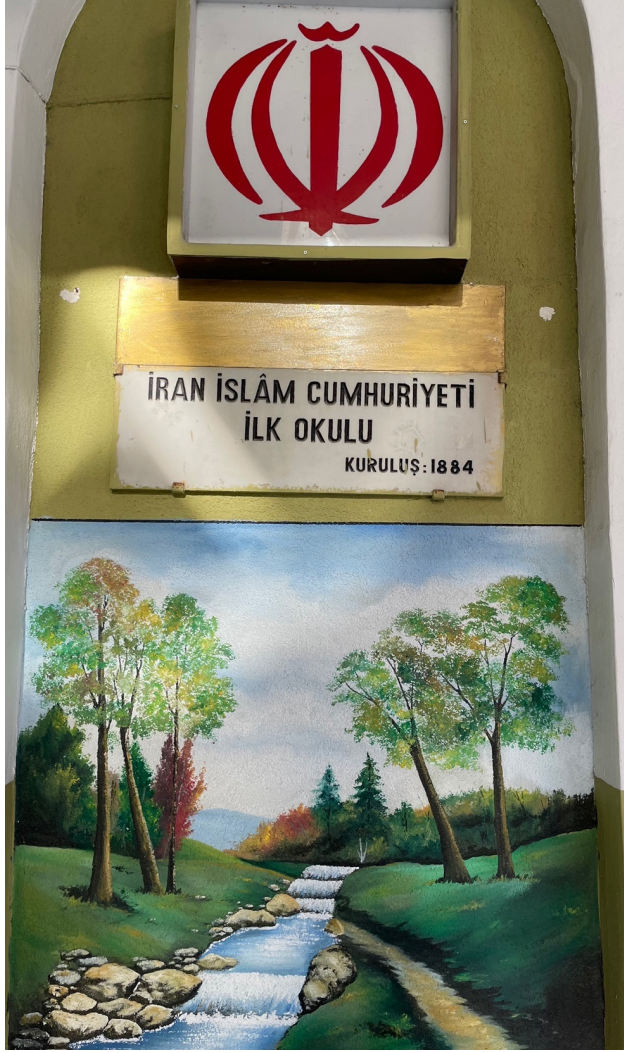
Ek 1: İstanbul Sultanahmet'te Bulunan Debistan-ı İraniyan-ı İstanbul'un Bugünkü Girişi ve Mermer İsimliđi