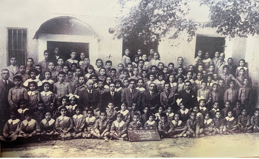
Ek 2: Debistan-ı İraniyan-ı İstanbul'un 1937-1938 Eğitim-Öğretim Yılındaki Öğrenci ve Öğretmenleri