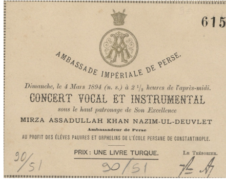
Resim 1: 4 Mart 1894 Pazar günü saat 8:30'da İstanbul İnan Sefaretinde okul yararına verilecek konsere ait giriş bileti 60

Okulun Osmanlı dönemindeki faaliyetleri genel çerçevede bu şekildeyken cumhuriyetin ilanımla birlikte Debistan-ı İraniyan-ı İstanbul'un vergi ve tapu gibi mevzuata dayalı hususlarda problemler yaşadığı görülmektedir. Vergi memurlarının okuldan vergi talep etmesi ve okulun arazisinin tekrar tapuya kaydedilmesi gibi konular, uzun süre okul yönetimiyle İnan Sefaretini meşgul etmiştir 61 .