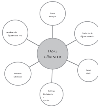
Şekil 2: İletişimsel görevlerin öğeleri

Nunan görev kavramının farklı öğelerini ayrıntılı olarak inceler (Bk. Şekil 1). Bu unsurların özelliklerinin iletişimsel görevleri yerine getirirken gerekliliğine olduğunu ifade etmektedir. Amaçlar, bir öğrenmede görevi tamamlama konusundaki genel beklentileri ifade eder. Girdi, görevin başlangıç noktasını oluşturan verilerdir. Etkinlikler, öğrencilerin girdide (görevin temel konusu) ne yapmaları gerektiğini belirtir. Öğrenenlerin ve öğretmenlerin görevlerdeki rolü, toplumsal ilişkiler ve kişiler arası ilişkiler bütününe kapsar. Değişkenler, çift veya grup çalışması ile görevi tamamlamak için sınıftaki etkileşim yapılandırmasını ele alır. Bu anlayışta, temel metinler de görevin bir parçası olarak kabul edilir. Bu düşünce, her hâlükârda görevi temel alan bu yeni yaklaşım, günümüz eğitim anlayışına farklı bir bakış açısı getiriyor(Nunan, 1989: s. 11).