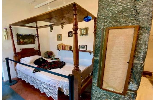
Şekil 12. Yatak Odasından Görünüm (URL-9)

Çocukken geçirdiği hastalık ve daha sonra yaşadığı trafik kazasından sonra ömür boyu sürecek sağlık sorunları nedeniyle eserlerini zaman zaman yatağına bağlı hâlde üretmek zorunda kalan ve özellikle otoportreleriyle tanınan sanatçının bu eserleri üretmek için kendini gözlemlediği aynanın da yatak odasının önemli bir unsuru olduğu görülmektedir. Dolayısıyla hem fiziksel konfor ve güvenliğini sağlayan hem de sanatsal faaliyetlerini gerçekleştirdiği yatak odasıyla kurduğu duygusal bağ ve deneyimlerin, yaşadığı mekânın ev veya yuva olarak nitelendirilmesine katkıda bulunduğu ifade edilebilir.