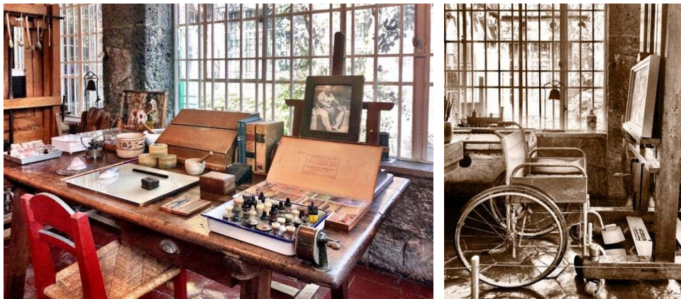
Şekil 13. Stüdyodan Görünümler (URL-8)

Sanatçının eserlerini yaratmak için zamanının önemli bir kısmını harcadığı stüdyosunda ise fırçalar ve şövaleler gibi malzemelerin yanı sıra kütüphanesinin de yer aldığı görülmektedir. Raflar, küçük heykeller gibi nesnelere süslenmiştir. Bütün bu unsurların bir arada kullanılmasının stüdyoyu da kişiselleştirmesine imkân sağlayarak sahiplik ve kontrol duygularını beslediği söylenebilir. Üstelik kişisel anlama sahip olan bu nesnelere bireyin sanatçı kimliğinin de mekâna yansımaya izin vermektedir. Zaman zaman tekerlekli sandalyede resim yapmak zorunda olan sanatçının stüdyo organizasyonunun tekerlekli sandalyesine uygun olmasının bu mekândayken güvende hissetmesini sağladığı söylenebilir. Bununla birlikte stüdyoda görülen büyük pencerelerin içeri gün ışığının dolmasına imkân vererek zihinsel refahı ve rahatlık hissini arttırabilir (Şekil 13). Bu etkenler, sanatçının yaşadığı mekân ile etkileşim sürecine katkıda bulunduğu burasının ev olarak ifade edilmesine katkıda bulunmaktadır.