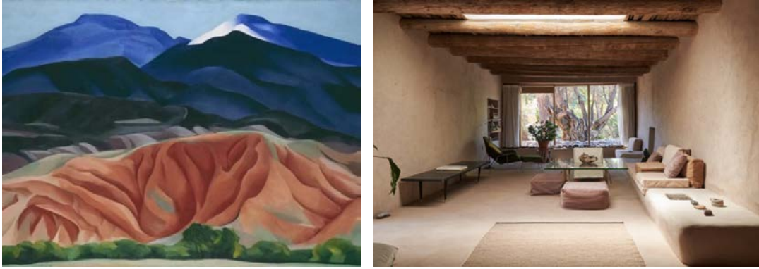
Şekil 7. Black Mesa Landscape (Solda) (O'Keeffe, 1930), Evin Yaşam Alanından Bir Görünüm (Sağda) (URL-5)

O'Keeffe, resimlerindeki yalınlık ve temiz çizgileri yaşadığı mekânı tasarlarken de devam ettirmiştir. New Mexico Evi'ndeki mobilyalar ve mimari öğelerin, soyut resimlerindeki görsel dili yansıtarak sadelik ve netlik duygusuna katkıda bulunduğu söylenebilir. Oturma elemanları düşey mimari unsurlar olan duvarların bir uzantısı olarak tasarlandığından iç mekân tasarımında holistik bir yaklaşım gözetildiği ifade edilebilir. Bununla birlikte resimlerinde kullandığı mat ve toprak tonları gibi renk tercihlerinin yaşam alanlarına da yansıdığı görülmektedir. Sanatçının yaşadığı mekânı kendisinin tasarlamasının, mekânın kişiselleştirilmesini kolaylaştırdığı, burası üzerinde sahiplik ve kontrol duygusunu besleyerek ev veya yuva olarak nitelendirilmesine katkıda bulunduğu söylenebilir. Evin büyük pencereleri, sanatçıya New Mexico'nun manzarasını sunarak dışarıdakileri içeri getirmektedir. Bu pencerelerden görülebilen manzaralar soyutlanarak sanatçının resimlerine ilham kaynağı olmuştur (Şekil 7). Böylece sanatçının sanat anlayışı mekâna yansıdığı gibi, mekân da O'Keeffe'nin sanatına katkıda bulunmaktadır. Dolayısıyla mekânın çevreyle bağlantı kurmasına izin vermesinin sanatçının faaliyetleri, fiziksel konforu ve kişisel yaşamı arasındaki bağlantıyı güçlendirerek ev veya yuva olarak nitelendirilmesini sağladığı ifade edilebilir.