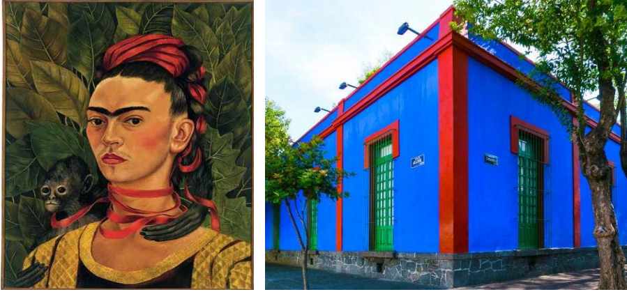
Şekil 10. Maymunlu Otoportre (Solda) (Kahlo, 1940), Evin Genel Görünümü (Sağda) (URL-7)

Frida Kahlo'nun Meksiko'da bulunan mavi evi, hayatının büyük bir kısmını geçirdiği ve sanatsal faaliyetlerini yürüttüğü bir mekân olarak kurulan bağlar anlamında incelemeye değerdir (Fabiny ve Who, 2013, s.68). Ressamın eserlerinde kullandığı canlı renklerin yapının kabuğunda ve iç mekânda da kullanıldığı; duvarların kobalt mavisi, parlak sarı ve canlı yeşil tonlarında boyandığı görülmektedir (Şekil 10). Böylece sanatçının iç dünyasının ve kişisel zevki, kullanılan renk paleti aracılığıyla mekâna yansımaktadır. Sanatçının kimliğini yaşadığı mekânın içerisinde ve dışarısında ifade edebilmesi ve çevresini kişiliğini, sanatsal bakış açısını ve değerlerini yansıtmak üzere şekillendirmesi de mekânla kurduğu bağı arttırmaktadır.