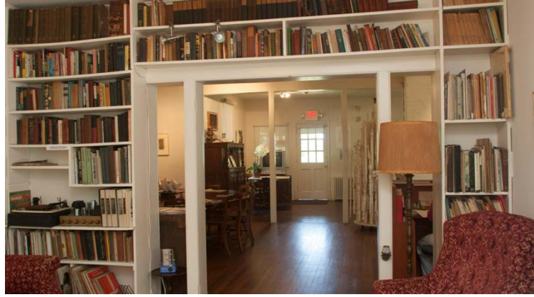
Şekil 5. Pollock ve Krasner'in Kişisel Kütüphanesi (URL-3)

Özünde, satın alınan bir ahırın dönüştürülmesiyle ortaya çıkan Krasner Evi, açık ve geniş kat planıyla yaşam ve stüdyo alanlarının bütünleşmesine örnek teşkil ederek kişisel yaşam ve sanatsal uğraşları arasındaki sınırları bulanıklaştırmaktadır. Stüdyo mekânlarındaki düşey, yatay yüzeylerdeki ve pencere gibi mimari unsurlardaki yalınlık, doğal ışık ve nötr renk paleti Pollock'un sanat eserlerine odaklanabilmesinin altını çizerken, zemindeki boya kalıntıları sanatçının duygusal deneyimlerinin somut izleri olarak mekânla kurduğu bağı vurgulamaktadır. Üstelik sanatçılar tarafından kişiselleştiren bu konut, çevrelerini kişisel tercihleriyle şekillendirirken zevkleriyle uyumlu bir ortam yaratmalarına izin vererek tanıdık ve aşına oldukları bir atmosfere katkıda bulunmaktadır. Bu da güven ve rahatlama duygularını besleyerek burasının ev veya yuva olarak nitelendirilmesini sağlamaktadır.