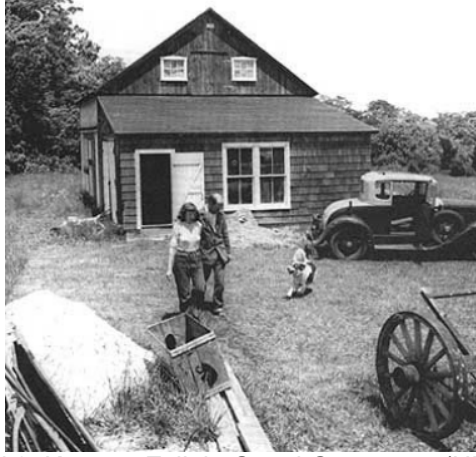
Şekil 2. Krasner Evi'nin Genel Görünümü (URL-2)

Ünlü soyut dışavurumcu ressam Jackson Pollock ve ressam eşi Lee Krasner'ın 1945 yılında taşındıkları ve Jackson Pollock'un ölümüne kadar birlikte on bir yıl yaşadıkları Krasner Evi, sanatçıların yaşamı hakkında önemli bir kaynaktır. Krasner evi, bir ahır olarak satın alınan yapının, yaşam alanları ve stüdyo alanlarına dönüşmesiyle biçimlenmiştir (Landau, 2005, s.28). Mekânın, içinde yaşayacak bireyler tarafından işlevlendirilmesi ve tasarlanması, bu süreçte oraya aidiyet ve rahatlık duyguları geliştirmelerini sağlayacağından bağ kurulmasını kolaylaştırıcı bir unsurdur. Dahası burayı kişiselleştirirken seçilen her bir nesne veya tasarım unsuru bilinçli bir seçimdir ve sanatçının kişiliğine, tutkularına ve inançlarına bir bakış sunmaktadır. Bu nedenle Krasner Evi, içinde barınan bireyin konutla kurduğu bağ ve deneyimlerle ev ve yuva hâlini almasına örnek olarak incelenebilir (Şekil 2).