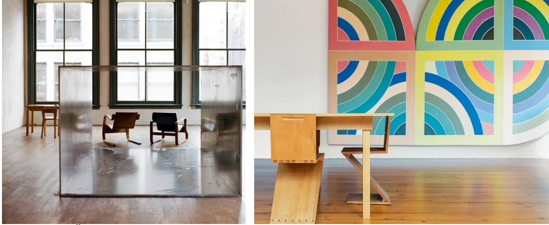
Şekil 16. Üçüncü Kattan Bir Görünüm (Solda), Dördüncü Kattan Bir Görünüm (URL-12).

Evin beşinci kattaki yatak odası, temiz çizgiler ve sade formları ile Judd'un minimalist estetik anlayışını yansıtmaktadır. Sanatçının yatak odasındaki mobilyaları kendisinin tasarlaması, mekânda kontrol sahibi olmasına katkıda bulunmaktadır. Yatak odası için tasarladığı mobilyalarda ve mimari detaylarda kullandığı ahşap malzeme, odadaki sıcaklık hissine katkıda bulunmakta ve mekânın geri kalanıyla iletişim kurmaktadır. Ahşap malzeme kullanımı, diğer katlarda olduğu gibi nötr renk paletini devam ettirmiştir, bu da bireyde huzur, sakinlik ve rahatlık hissini uyandırmasına katkıda bulunmaktadır. Yatak odasındaki süslemeden ziyade işleve öncelik veren basit geometrik formlar, mekândaki mimari öğelerle denge sağlamaktadır (Şekil 17). Yatak odasının bulunduğu alanda yalnızca bu ihtiyaca yönelik mobilyalar olması, sanatçının işleve verdiği önemi ve süslemeden kaçınmasını ortaya koymaktadır.