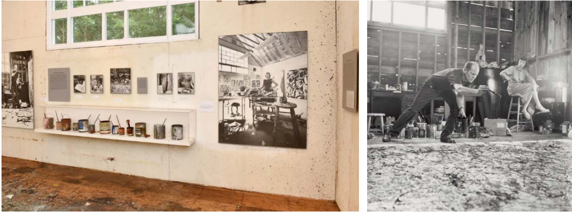
Şekil 4. Stüdyo Katından Görünüm (Solda) (URL-3), (Sağda) (Landau, 2005, s. 29)

Krasner Evi'nin renk paletinde ağırlıklı olarak beyaz, toprak tonları gibi nötr renklerin öne çıktığı görülmektedir. Bu renklerin, hem odağın sanat eseri üzerinde kalmasına izin verdiği hem de bu eserlerin enerjik ve dinamik doğasını dengelemeye de yardımcı olduğu söylenebilir. Stüdyodaki temiz çizgiler ve yalın geometrik formlardan meydana gelen yüzeyler ve pencere açıklıkları da mekânsal organizasyonda dengenin sağlanmasına katkıda bulunmaktadır. Damlatma/sıçratma tekniğiyle yaptığı resimlerinden sıçrayan boyalar hâlâ zemini kaplamaktadır (Şekil 4). Bu, Pallock'un sanatçı kimliğinin ve bakış açısının mekâna birebir yansımadır. Dışavurumcu ressamın öznel ve duygusal deneyiminin yansıması olan bu izlerin, mekânla kurduğu bağı güçlendirdiği ve satın aldıklarında ahır olan bu yapıyı ev veya yuva hâline getirmesine katkıda bulunduğu ifade edilebilir.