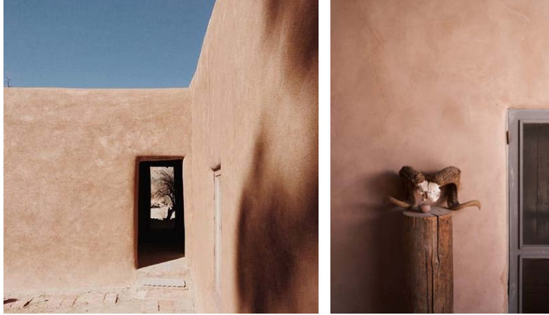
Şekil 8. Evin dışından görünümü (URL-6)

New Mexico Evi'nin yatak odasının tasarımında fiziksel konfora önem verildiği görülmektedir (Şekil 9). Dinlenme alanındaki fiziksel konfor, zihinsel rahatlamayı da beraberinde getirerek mekâna karşı rahatlık ve huzur duygularını geliştirmelerini sağlayabileceğinden ev veya yuva olarak nitelendirilmesine katkıda bulunabilir. Bununla birlikte yatak odasında heykeller ve tablo gibi kişisel öneme sahip nesnelere gözlemlenmektedir. Bu nesnelere mekânda bulunması yaşam alanının kişiselleştirilmesine; sanatçıdaki aidiyet ve sahiplenme duygularının beslenmesine yardımcı olmakta ve mekânla arasındaki diyalogları artırarak yaşadığı evle arasındaki varoluşsal bağın güçlenmesine imkân sağlamaktadır.