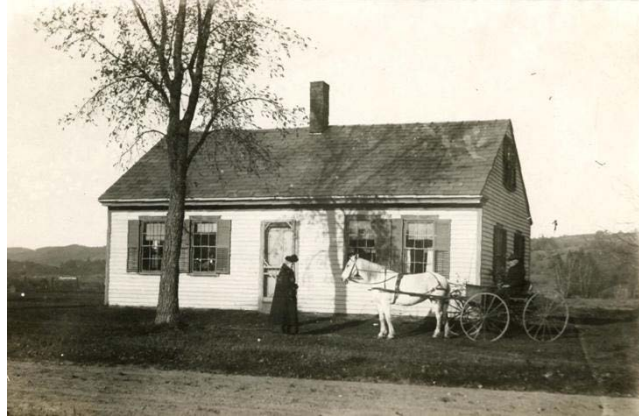
Şekil 1. Ev ve Araba (URL-1)

Yerleşmek, yer edinmek her zaman insanın varoluşunun bir getirisi olmuştur ve bireyin bu arayışı, yanıtını “ev” imgesinde (Şekil 1) bulmuştur. Farklı kültürlerde evi ifade etmek için kullanılan kelimelerin etimolojik kökeni incelendiğinde, bireyin evle ilişkisinde eve yüklenen anlam belirginleşmektedir. Ev kelimesinin en sade anlamı, bir ailenin yaşamları için onlara ayrılmış yerdir (Rado, 1970, s.356). Bu kelimenin etimolojik kökeni, Göktürk alfabesindeki “eb” şeklinde kullanılan sese dayanmaktadır. Dilimize b sesi yerine v sesini almasıyla ev şeklinde evrimleşen bu kelimenin, Göktürk alfabesinde bir ses şeklinde var olması, eve verilen önemi belirtmektedir (Usta, 2020, s.28).