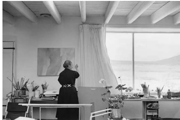
Şekil 6. Evin Stüdyo Bölümünden Bir Görünüm (URL-4)

Hem sanat eserlerinde hem de yaşam alanlarında kendine özgü tarzıyla bilinen ve Amerikan modernizminin öncüsü olarak bilinen ünlü Amerikalı sanatçı Georgia O'Keeffe'nin New Mexico'da bulunan evi ve stüdyosu, kişiliğini ve sanatsal vizyonunu yansıttığından, konutun ev/yuvaya evrilmesine örnek olarak incelenebilir. Örneğin, modernizmde olduğu gibi, mekânların tasarımında da işlevsellik ve verimliliğe öncelik verildiği görülmektedir. Özellikle stüdyonun, amaçlarına hizmet edecek şekilde dikkatlice planlandığı, çizimler ve sanat malzemeleri için geniş alanla yaratıcı süreci optimize edecek şekilde tasarlandığı söylenebilir. Modernist akımın öncü sanatçılarından biri olan O'Keeffe'nin 1949 ile 1984 yılları arasında yaşadığı bu ev ve stüdyosu, modern tasarım ilkelerine olan yakınlığını yansıtmaktadır (Şekil 6).