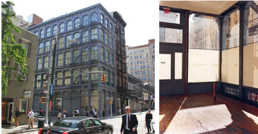
Şekil 14. Evin Cephesinden Görünüm (Solda) (URL-13), Giriş Katından Bir Görünüm (Sağda) (URL-14)

Binanın dökme demir ile inşa edilmesi, geniş açıklıklara izin vererek gün ışığının mekâna optimum düzeyde nüfuz etmesine izin vermektedir (Şekil 14). Dış duvarlar boyunca uzanan pencereler mekânın aydınlatılmasını dolayısıyla içinde yaşayanların sirkadiyen ritminin düzenlenmesine katkıda bulunmakta, zihinsel ve fiziksel konforunu artırmaktadır. Zemin katın girişindeki çıplak ahşap zemin ve temiz çizgilerle tasarlanmış beyaz tavan, doğal ışığı vurgulayarak sanatçının minimalizme bağlılığını yansıtmaktadır.