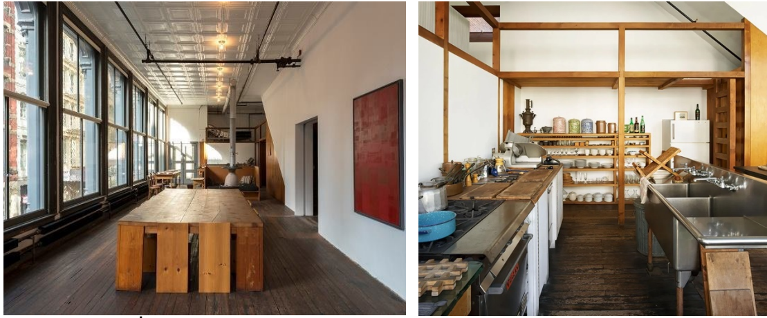
Şekil 15. Evin İkinci Katından Bir Görünüm (Solda) (URL-10), Evin Mutfağından Görünüm (Sağda) (URL-11)

Judd'un yaşam alanı için tasarlanmış mutfağın tezgahında, raflarında ve donatılarda kullanılan masif ahşap, evyede tercih edilen bir endüstriyel malzeme olan paslanmaz çelik malzemeye kontrast bir görünüm ve doku elde edilmesini sağlamakta ve mekânı daha sıcak kılmaktadır. Burada kullanılan malzemeler sanatçının minimalist estetik anlayışını yansıtmaktadır. Açık raflar ise sık kullanılan eşyalara kolayca ulaşılabilmesini sağlayarak işlevselliğe atıfta bulunmaktadır (Şekil 15).