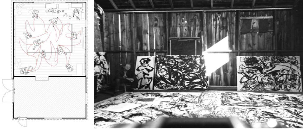
Şekil 3. Krasner Evi Plan Şeması (Solda) (Milan, 2023, s. 270), Stüdyo Katından Görünüm (Sağda) (URL-2)

Krasner Evi'nin renk paletinde ağırlıklı olarak beyaz, toprak tonları gibi nötr renklerin öne çıktığı görülmektedir. Bu renklerin, hem odağın sanat eseri üzerinde kalmasına izin verdiği hem de bu eserlerin enerjik ve dinamik doğasını dengelemeye de yardımcı olduğu söylenebilir. Stüdyodaki temiz çizgiler ve yalın geometrik formlardan meydana gelen yüzeyler ve pencere açıklıkları da mekânsal organizasyonda dengenin sağlanmasına katkıda bulunmaktadır. Damlatma/sıçratma tekniğiyle yaptığı resimlerinden sıçrayan boyalar hâlâ zemini kaplamaktadır (Şekil 4). Bu, Pallock'un sanatçı kimliğinin ve bakış açısının mekâna birebir yansımadır. Dışavurumcu ressamın öznel ve duygusal deneyiminin yansıması olan bu izlerin, mekânla kurduğu bağı güçlendirdiği ve satın aldıklarında ahır olan bu yapıyı ev veya yuva hâline getirmesine katkıda bulunduğu ifade edilebilir.