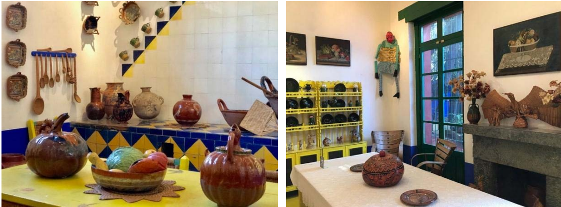
Şekil 11. Mutfak ve Yemek Odasından Genel Görünüm (URL-8)

Mutfakta el boyaması geleneksel seramik karolar ve renkli çömlekler bulunduğu görülmektedir (Şekil 11). Duvarlara asılmış maskeler, hayvan figürleri gibi unsurların, sanatçının yerel gelenekleri önemsemesinin ve bu nedenle yaşadığı mekâna taşınmasının bir göstergesi olduğu söylenebilir. Özellikle hayvan figürlerinin sanatçının tablolarında da yer alması, sanatsal kişiliğiyle yaşadığı mekân arasında bir bağ olduğunu ortaya koymaktadır. Bununla birlikte bu mutfak kişiselleştirerek kendine özel hale getirmesinin sahiplenme duygusunu geliştirdiği, dolayısı ile yaşadığı konutun ev veya yuva olarak ifade edilmesini sağladığı söylenebilir.