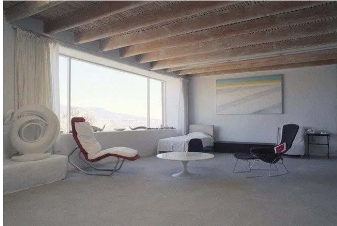
Şekil 9. Yatak odasından bir görünüm (URL-4)

New Mexico Evi'nin yatak odasının tasarımında fiziksel konfora önem verildiği görülmektedir (Şekil 9). Dinlenme alanındaki fiziksel konfor, zihinsel rahatlamayı da beraberinde getirerek mekâna karşı rahatlık ve huzur duygularını geliştirmelerini sağlayabileceğinden ev veya yuva olarak nitelendirilmesine katkıda bulunabilir. Bununla birlikte yatak odasında heykeller ve tablo gibi kişisel öneme sahip nesnelere gözlemlenmektedir. Bu nesnelere mekânda bulunması yaşam alanının kişiselleştirilmesine; sanatçıdaki aidiyet ve sahiplenme duygularının beslenmesine yardımcı olmakta ve mekânla arasındaki diyalogları artırarak yaşadığı evle arasındaki varoluşsal bağın güçlenmesine imkân sağlamaktadır.