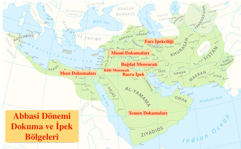
Resim 4. Abbâsî Döneminde İslam Beldelerinde Dokuma ve İpek Ürünleri Bölgeleri