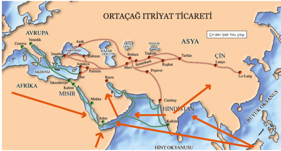
Resim 3. Orta Çağ İtiryat Ticareti İçerisinde Üd (Öd Ağacı)