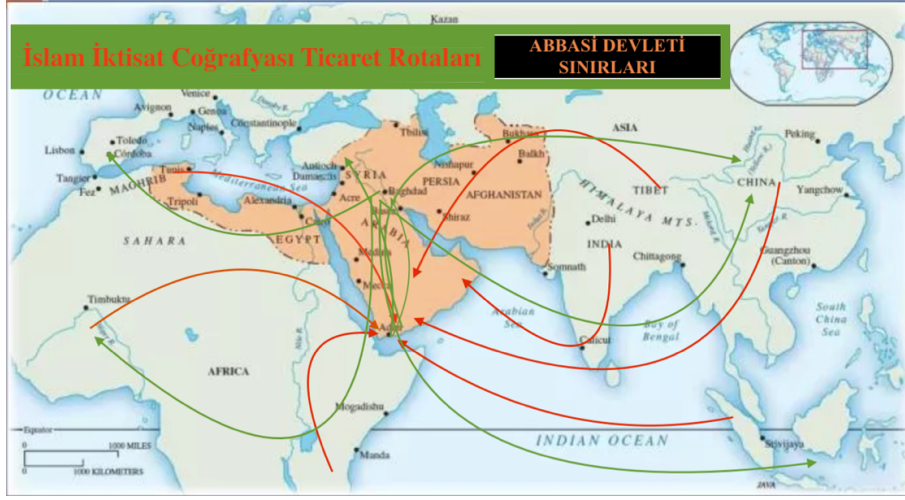
Resim 2. İslam İktisat Coğrafyası Abbâsî Dönemi