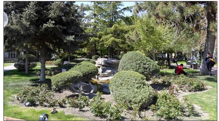
Şekil 9. Burdur Cumhuriyet Meydanı'nda yer alan havuz

Burdur Cumhuriyet Parkı'nda yer alan havuz, peyzaj süslemeleri ile vurgulanmaya çalışılmıştır (Şekil 9). Estetik bir görünüm vermeye çalışılan havuz bir süs havuzu niteliğinde olup, etrafı taşlarla süslenmiştir. Ayrıca, havuzun yerleştirildiği alanın peyzajı ile çevresinin uyumlu olduğu tespit edilmiştir.