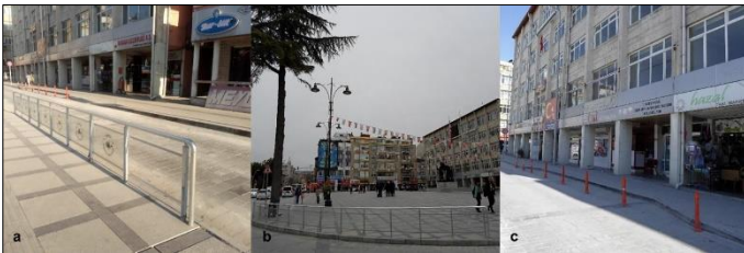
Şekil 7. Burdur Cumhuriyet Meydanı'nda yer alan yeni (a), (b) ve eski (c) sınırlayıcılar

Burdur Cumhuriyet Meydanı'nda yer alan sınırlayıcılar hem görsel hem de fiziksel açıdan sağlam ve monte edildiği zemine sağlam oturtulmuştur. Meydan içerisinde bulunan sınırlayıcıların kent dokusuyla uyumlu olmasının yanında, kullanılan malzemelerin yeni olması estetiklik sağlamıştır (Şekil 7a-b). Yine Atatürk Anıtı arkasında konumlandırılan sınırlayıcıların oldukça eski olduğu fakat tekerlekli sandalyelerin aralarında rahatça geçebileceği şekilde tasarlandığı belirlenmiştir (Şekil 7c).