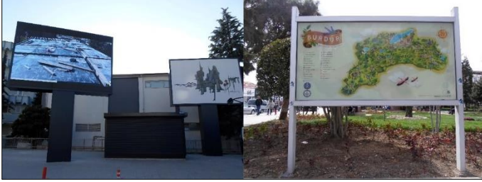
Şekil 6. Burdur Cumhuriyet Meydanı'nda yer alan reklam panoları

Çalışma alanında yer alan reklam panoları ilgi çekici olmalarının yanında estetik olmalarıyla da dikkat çekmektedir. Meydandaki reklam panolarının görsel erişimi engelleyecek şekilde olmadıkları tespit edilmiştir. Yine meydandaki reklam panoları için kullanılan direklerin şehir estetiği ile uyumlu oldukları saptanmıştır.