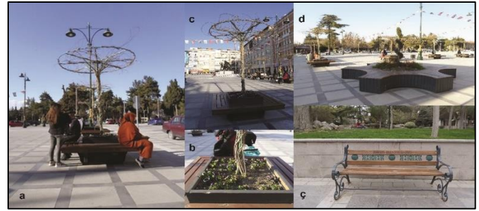
Şekil 2. Burdur Cumhuriyet Meydanı'nda uyumsuz (a, b, c, d) ve bakımsız (b, ç) oturma grupları

Saksılı oturma gruplarında ise bitkilerin kullanımı için tasarımda yeterli detayın düşünülmediği tespit edilmiştir. Bununla birlikte oturma grubunda yer alan saksılarda kullanılan bitkilerin seçiminde tür, renk ve uyum sorunu olduğu gözlemlenmiş ve bunun sonucunda bitki tür seçiminin peyzaj kriterleri açısından yeteri kadar önemsenmediği ve ayrıca kullanılan bitkilerin bakımının da yapılmadığı saptanmıştır (Şekil 2a-c). Bütüner Çetin ve ark. (2023) tarafından meydanlarda çok farklı bitki türünün bir arada kullanılmasının meydanları daha zengin ve algılanabilir kıldığı vurgulanmaktadır.