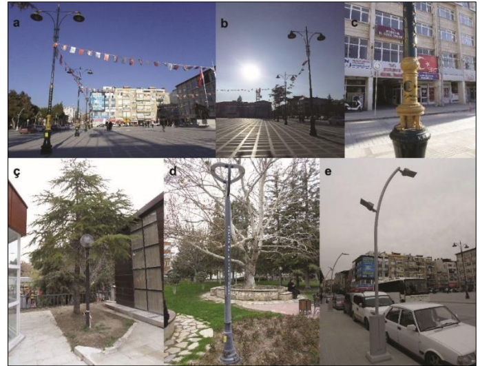
Şekil 4. Burdur Cumhuriyet Meydanı'nda aydınlatma elemanlarının doğru (a, b, c, e) ve yanlış (ç, d) konumları

Aydınlatma elemanı görsel açıdan erişimi sağlayacak, en uygun aydınlık düzeyi ve konuma sahip olmalıdır (Akpınar Külekçi, 2018). Bu bilgilerden yola çıkılarak alanda genel olarak aydınlatma elemanları kısmi bütünlük sağlamaktadır. Bunun yanında aydınlatma elemanları uygun aydınlık düzeyi ayrıca görsel açıdan erişimi de sağlamaktadır. Çalışma alanında dört tip aydınlatma elemanının kullanıldığı tespit edilmiştir. Bu durum alanın çevre ile uyumsuz bir şekilde algılanmasını sağlamaktadır (Şekil 4 a-ç-d-e). Burdur Cumhuriyet Meydanı'nın simgesi olan Atatürk Heykeli için kullanılan bir aydınlatma elemanın olmayışı da aydınlatma elemanlarının hem işlevsellik görevini yerine getirmemesine hem de çekici olmamasına neden olmaktadır.