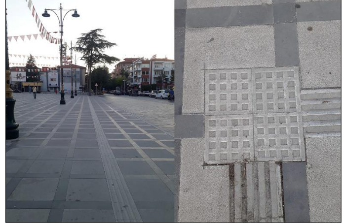
Şekil 8. Burdur Cumhuriyet Meydanı'nda yer alan zemin döşemesi

edilmiştir. Bunun yanında meydan alanında kullanılan plak taş döşeme alanda silik bir izlenim bırakmaktadır. Bu durum kent mobilyaları bağlamında Burdur Cumhuriyet Meydanı'nın dezavantajları arasına girmekte ve meydanın vurgulanmasını engellemektedir.