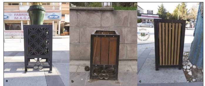
Şekil 3. Burdur Cumhuriyet Meydanı'nda uyumlu ve estetik (a ve c), uyumsuz ve bakımsız (b) çöp kutuları

Burdur Cumhuriyet Meydanı'nda kent mobilyaları kapsamında toplam 25 adet çöp kutusu elemanı tespit edilmiştir. Meydanda yer alan çöp kutularının genel olarak aydınlatma elemanlarının önünde kullanılması ise algılanabilirlik açısından dikkat çekici olmuştur. Meydan içerisinde çöp kutularının genel olarak oturma grupları yakınında, insanların yürüyüş yolu güzergahında konumlandırıldığı ve alanın genelinde ise sokak ve blok başları ile kullanımın yoğun olduğu yerlerde buldukları belirlenmiştir. Yine meydanadaki çöp kutularının farklı form ve ölçülerde kullanıldığı görülmüş ve alan genelinde bir bütünlük oluşturmadıkları tespit edilmiştir (Şekil 3).