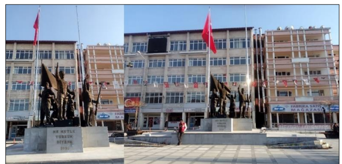
Şekil 5. Burdur Cumhuriyet Meydanı'nda yer alan Atatürk Anıtı

Burdur Cumhuriyet Meydanı'nın odak noktasını Atatürk Anıtı oluşturmaktadır (Şekil 5). Zaman zaman mekân içerisinde simgesel ve kent kimliğini etkileyici anlamlar taşıyan heykeller çoğu zaman kompozisyon tamamlayan elemanlar olarak görev almalıdır (Öztürk, 2005; Karaca ve ark., 2020). Burdur Cumhuriyet Meydanı'nda yer alan Atatürk Anıtı Cumhuriyet Meydanı isminin simgesel göstergesi olarak kent kimliği açısından etkileyici anlamlar taşımaktadır. Ancak, yetersiz peyzaj düzenlemesi ve Atatürk Anıtı'nı vurgulayıcı tasarımların olmaması nedeniyle Atatürk Anıtı kentin odak noktası olmaktan çıkmıştır. Ayrıca, heykel çevresinde yeterince aydınlatma elemanının olmaması da başka bir eksikliklerdir. Bunun yanı sıra, arka planda yer alan binaların eski olması ve herhangi bir restorasyon çalışmasının yapılmaması da Atatürk Anıtı'nın vurgulanmasını engellemektedir.