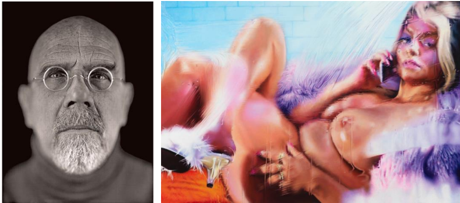
Görsel: 5. Chuck Close, Self-Portrait, 2002, daguerrotype, 8,5x6,5 in. 21,6 x 16,5 cm

Charles Baudelaire; portreyi anlamının tarih ve roman üzerinden iki yolu olduğunu belirtmektedir. İlki; natüralistler, modelin zihindeki en karakteristik tavrını idealize etmek için onun konturunu ve biçimlenişini aslına sadık, katı, titiz ve bir yaklaşımla oluşturmaktadırlar. Rastlantısal bir bozulmanın sonucu olan anlamsız olan her şeyi ihmal etmektedirler. Renkçilere özgü ikinci yöntemde portre, uzam ve düşlem dolu şiir haline getirilerek oluşturulmaktadır. Burada imgelemin gücünün payı daha büyük olmakla birlikte, roman da tarihten daha gerçek olmaktadır (2021: 156-157).