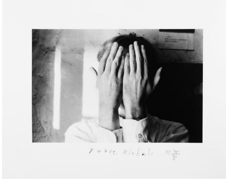
Görsel: 4. Andy Warhol (Covering Face), c. 1958, Gelatin silver print, 6 5/8 x 10 inches (image); 11 x 14 inches (paper), AP IV/V