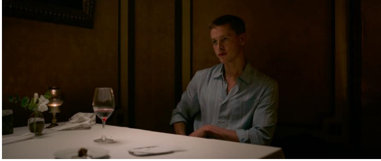
Görsel: 15. ve 16. Ruben Östlund, 2022, Hüzün Üçgeni (Triangle of Sandness)

Bülent Özçelik'e göre; Hakikat sonrası (post-truth) bir kavram olarak ilk kez Steve Tesich tarafından ilk kez 1992 yılında kullanılmıştır. Tesich, The Nation'daki "A Governments of Lies" makalesinde, ABD dış politikasındaki yalan ve aldatmacaların topluma benimsetilmesi sırasındaki anlayışı ve toplum tarafından bu durumun benimsenmesini ifade etmek için "özgür insanlar olarak bizler, son derece köklü bir yoldan, hakikat-sonrası bir dünyada yaşamak istediğimize özgürce karar verdik" şeklinde açıklamaktadır (Özçelik 2023: 31). Post-truth sürecin, yani "Hakikatin önemsizleşmesinin getirdiği yenilik, kitlelerin, kendi önyargılarına, görüşlerine ya da kanaatlerine uyumlu olduğu sürece, yalanların yalan olduğunu bilse dahi, onları hakikatmiş gibi kabul etmesidir. Kitlelerin, yalan olduğunu bildiği söylemler karşısında, sanki doğruymuşçasına pozisyon alması, onları savunması, onlara sahip çıkmasıdır" (Alpay 2023: 29). Bu bağlamda, Ruben Östlund'un 2022 Altın Palmiye ödülünü kazanan ve yönetmenin kendine özgü formları olan 'Hüzün Üçgeni' filmi, post-truth süreçteki gerçek bir hayata işaret ederek, bireylerin yalana neden başvurduklarını, yaşamlarının büyük bir bölümüne yalanı koyarak ikili ilişkilerde bunu nasıl kullandıklarını, yalanın birey ve toplum üzerinde yarattığı