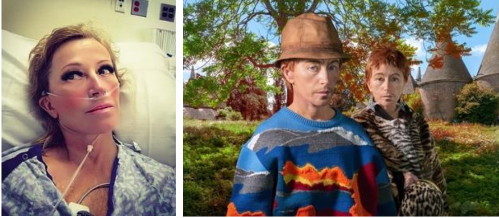
Görsel: 11. Cindy Sherman, 2017, İyileştim mi doktor? (Am I cured doctor?)

eleştiriyi de beraberinde getirmiştir. Hem yazınsal alanın hem fotoğrafik görüntülerin tüketilebilirlik açısından kitlelere hızla yayılması, üreten olarak sanatçılara da kolaylık sağlamış, ancak ortaya çıkan sanat eserlerinin yapaylığı tartışmaların ana konularından birini oluşturmuştur. Bu durum üzerine yapılan sanat eleştirileri, olumlu ve aksi iddia edilmek üzere iki kola ayrılmıştır.