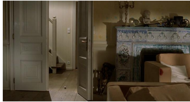
Görsel: 13. Alfred Hitchcock, 1946, Aşktan da Üstün, (Notorious)