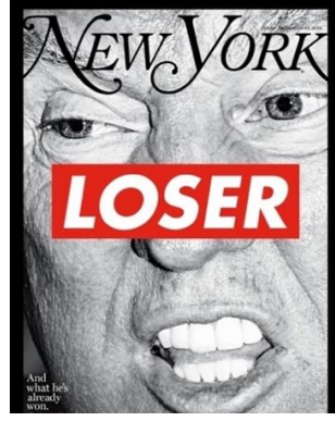
Görsel: 17. Seçim Sayısı kapağı. 2016. New York Magazine için Barbara Kruger tarafından çizilmiştir.