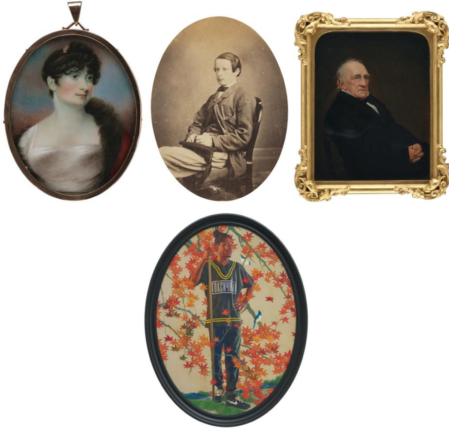
Görsel: 7. Rosoman Mountain, watercolor and gouache on ivory, 1806,18012, 76x64 mm

W. Benjamin'e göre, ressamın fotoğrafı teknik bir araç olarak kullanmaktadır. Fotoğrafçı ne kadar düzenlilik ve ustalığa sahip, fotoğrafı çekilen kişi de ne kadar dikkatlice poz vermiş olursa olsun, fotoğrafa bakan kişi fotoğrafta hep beklenmedik bir şey aramaktadır (Benjamin 2014: 10-15). Eugène Delacroix içinse fotoğraf aynı zamanda kesinlikleri olmayan bir görme biçimidir. Fotoğraf gözün görme yapısından farklı, oldukça ayrıntılı görüntüler sunmaktadır. Delacroix fotoğrafı bu yüzden eksik bulmaktadır. Göz bu eksikleri kapatabilen bir araçtır (Akkaya 2012: 21). W. Benjamin ve E. Delacroix'nın düşüncelerine bir arada bakıldığında 'bakanın bir şey araması' ve 'gözün eksiklikleri kapatması' ifadeleri birbirlerini tamamlayan yakın ifadelerdir. İkisi de gözün bakma edimine odaklanmaktadır. Hatta bakma ya da görmenin ötesinde mistik bir vizyona da işaret etmektedir. Bunun bilincinde olan ve çağını iyi süzebilen ressamların eserlerinin şu anki uluslararası statü ve değerlerine bakıldığında, fotoğrafı eserlerinde ya sadece teknik bir araç olarak kullanmışlar ya da onu sanat ilan ederek araç olmanın ötesine götürmüşlerdir.