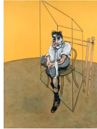
Görsel: 1. The Artist (Francis Bacon) in His Studio, 1973