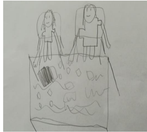
Şekil 3. C14 ve C4'ün arkadaşlarıyla oynamayı sevdiği ortamlar