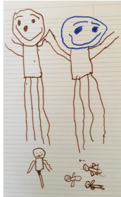
Şekil 1. C4'ün ve C2'nin arkadaşlık tasviri

Dört yaşındaki C4 Şekil 1'de arkadaşını anlatırken ve çizimlerken sadece bir arkadaşını diğerlerinden ayırt ediyor ve onun gitmesini, başkalarıyla oynamasını istemiyor. Onun için arkadaşlık birlikte oyun oynayabileceği, onu hiç bırakmayacağı, onunla mutlu olabileceği kişiler olarak tasvir ediyor.