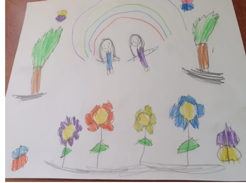
Şekil 2. C22 ve C21'in arkadaşlarıyla sevdiği oyunlar

C22 ise arkadaşlığı hareketli oyunlar ile ilişkilendirmiş ve şu şekilde ifade etmiştir: “Arkadaşım la çim halısında futbol oynuyoruz. Güneşli güzel bir gün ikimizde birbirimizle futbol oynadığımız için gülüyoruz.” C21 resmiyle ilgili arkadaşıyla en çok neler yapmayı sevdiğini şu şekilde ifade etmiştir: “Arkadaşım la sarılıyor. Gökkuşaağı, çiçekler, kelebekler, ağaçlar var.” C21 güzel resim çizdiği için yakın arkadaşıyla resim çizmekten ve evcilik oynamaktan hoşlandığını ifade etmiştir.