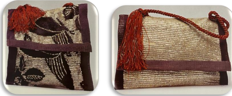
Görsel 7: Tel kırma çanta (Paksoy, 2003).

Gelişen teknoloji, sanayi ve endüstri dallarının geleneksel el sanatlarının kullanımının gözle görülür şekilde azalmasına ve yok olmasına sebep olduğu bilinmektedir. Bu gibi sebepler gelecek kuşaklara tarihin,