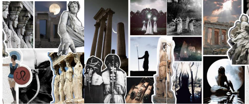
Görsel12: Apasas; The City of The Mother Goddess Moodboard (URL-10).

Apasas; The City of The Mother Goddess koleksiyonunda tasarımcı ilhamını mitolojideki güçlü kadınlardan arasında olan ve Anadolu’ da yaşamış Amazon kadınlarından ve onların hayat hikayelerinden esinlenerek İzmir Selçuk Efes Antik Harabeleri’ n de gerçekleştirmiştir. Efes Antik kentinin isminin tarihte eski dönemlerde Arzawa Krallığı’ nın dilinde Ana Tanrıça kenti anlamına gelen Apasas kelimesinden geldiği düşünülmektedir. Birçok mitolojik hikâyeye sahip olan bu bölge de Anadolu’ ya yayılmış ve tamamı kadınlardan oluşan topluluklardan oluştuğu bilinmektedir. Erkeklerin egemen olduğu dünya da onlara baş kaldıran ilk kadınlar olarak bilinen bu topluluğun aynı zamanda Savaş tanrısı Ares’ in kızlarına, vahşi doğa ve ay tanrıçası olan Artemis’ e taptıkları bilinmektedir (Görsel 12) (URL-9).