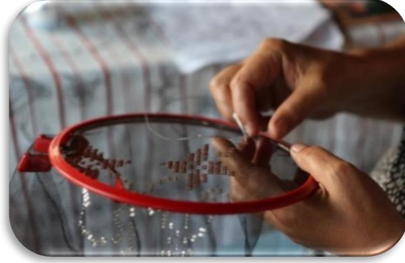
Görsel 1: Tel kırma işlemesi (URL-1).