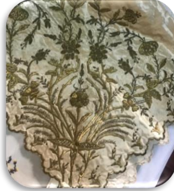
Görsel 4: Tel kırma örnekleri.

Tel kırma ilk yapıldığı yapıldığı zamanlarda genellikle başörtüsü, yatak örtüsü, yastık, kırlent, gelin bohçası vb. gibi eşyaların süslenmesinde tercih edilmiştir. Ancak şimdilerde birçok çeşitli ev ve giyim donatısının süslenmesinde tel kırma sıklıkla görebilmekteyiz (Görsel 5-6-7).