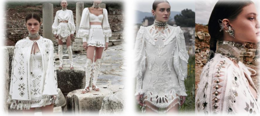
Görsel 13: Apasas; The City of The Mother Goddess koleksiyonu (URL-11).

Koleksiyonda bulunan her bir parça geleneksel el sanatları işleme teknik ve yöntemleri kullanılarak oluşturulmuştur. Tüm parçalardaki işlemler ay ve güneşten yola çıkarak yeni başlangıç olarak ay figürü, gün doğumu ve doğanın uyanış ritüellerine güneş figürü kullanılmıştır. Tamamı özel tasarım olan işlemler Bartın yöresine ait tel sarma, tel kırma, Kastamonu yöresine ait düğüm, püskül işleme teknikleri kasnak, lazer teknikleri ve ajur gibi geleneksel işleme yöntemleri kullanılmıştır (Görsel 14).