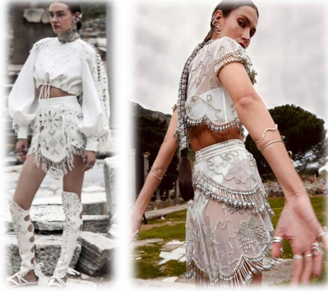
Görsel 14: Geleneksel teknikler (URL-12).

Antik Çağlardan beri dişilik ile özdeşleşen, yeniden doğum ve ölümsüzlük gibi olguları simgeleyen inci işlemlerde yılan figürlerini sıklıkla tel kırma tekniği kullanılarak yapıldığı görülmektedir. Boyundan çapraz bağlamalı olan üstler, derin yırtmaçlara sahip etekler, şalvarlar ve iki parçadan oluşan Amazon kadın silüet kombinlerinden esinlenerek tasarımlar gerçekleştirilmiştir (Görsel 15).