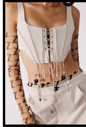
Görsel 9: From Anatolia to Sirius koleksiyonu, 2023 (URL-5).

Yeşil, turuncu, bej ve taş renklerinin hâkim olduğu koleksiyonda renkler Anadolu ovaları, güneş doğumu ve güneş aracılığıyla oluşan klorofilden gelmektedir. Moderne edilmiş ve gelenekselin ön planda olduğu etnik el işlemleri, keten etamin kumaşlarla parlak dokuların birlikteliği ile zıtlıkların vurgusu yapılmaktadır. Kastamonu işi el yapımı yeniay, dolunay, güneş, yıldız şeklinde kumaşlar üzerine pullarla işleme yapılmış desenlere sahip kumaşlardan elbise, etek, büstiyer, şapka, pelerin, korse, ceket ve pantolon tasarımları dikkat çekici özelliğindedir.