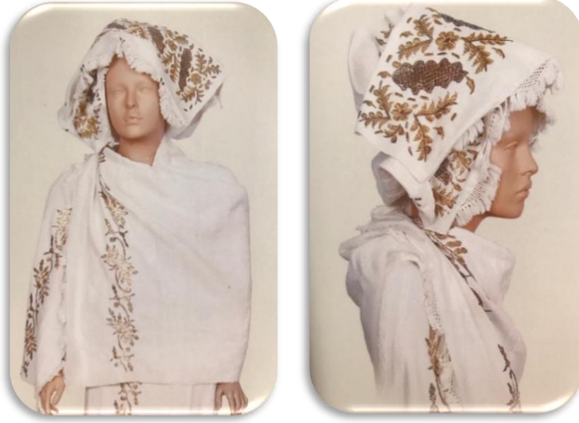
Görsel 5: Tel kırma havlu seti (Tansuğ, 2021).