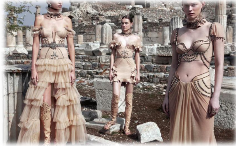
Görsel 15: Amazon kadın görünümleri (URL-13).

Antik Çağlardan beri dişilik ile özdeşleşen, yeniden doğum ve ölümsüzlük gibi olguları simgeleyen inci işlemlerde yılan figürlerini sıklıkla tel kırma tekniği kullanılarak yapıldığı görülmektedir. Boyundan çapraz bağlamalı olan üstler, derin yırtmaçlara sahip etekler, şalvarlar ve iki parçadan oluşan Amazon kadın silüet kombinlerinden esinlenerek tasarımlar gerçekleştirilmiştir (Görsel 15).