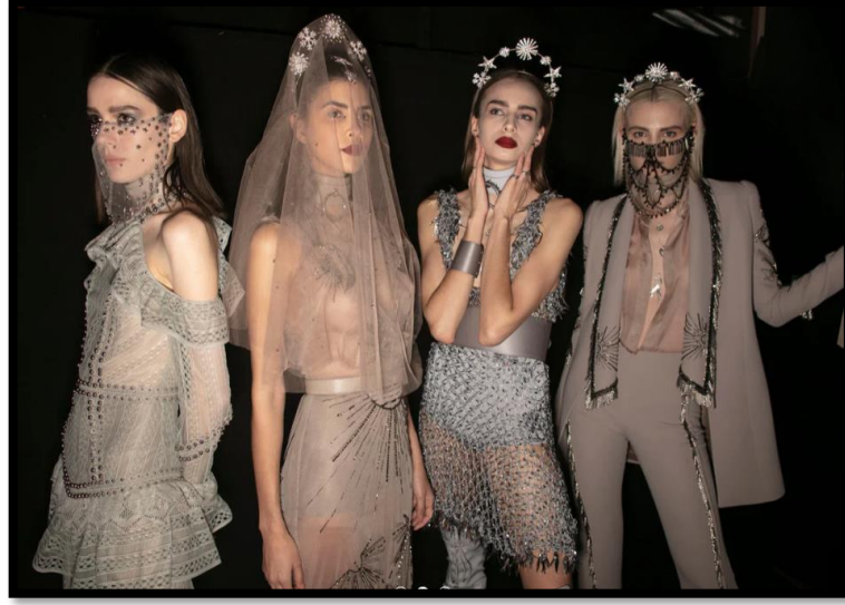
Görsel 11: Harem Geceler koleksiyonu (URL-8).

Modanın, yaratıcılığa ve üreticiliğe olan yoğun ilgisi tasarımların sürekli olarak kendilerini yenilemelerini ve geliştirmelerini sağlamaktadır. Kültürel, yerel, etnik, eklektik ve gelenekselin bulunduğu Zeynep Tosun tasarımlarında modanın yenilikçi ve geleneğin modern yansımasını görmek mümkündür. Kültürel mirasın taşıyıcısı olan bu tasarımlar geleceğe kültürel yatırımlar olarak yansımaktadır.