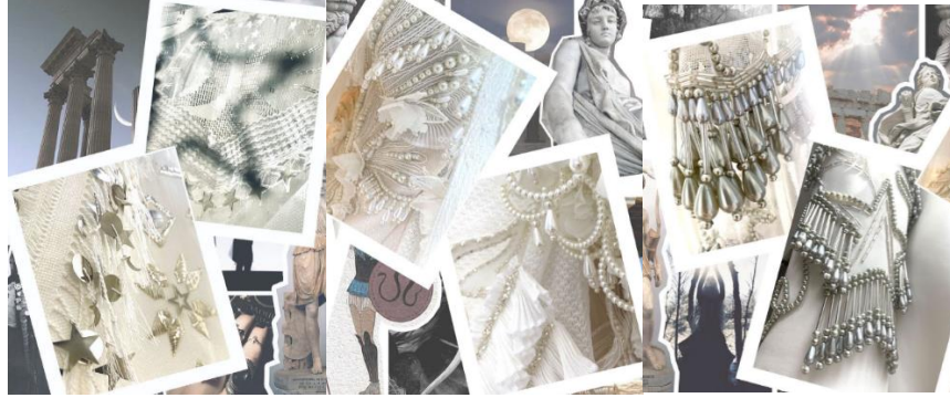
Görsel 16: Apasas koleksiyonu işlemler (URL-14).