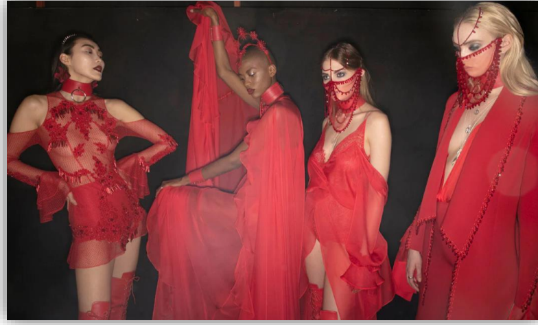
Görsel 10: Harem Geceler koleksiyonu.