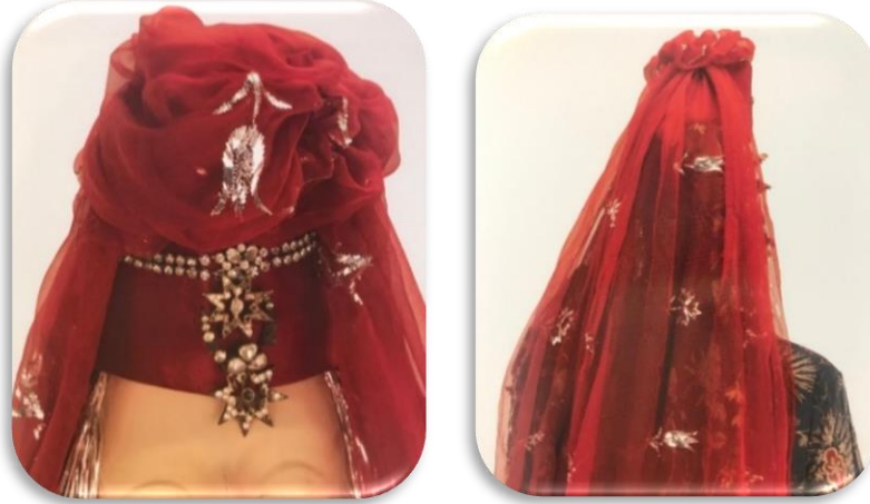
Görsel 6: Tel kırma Kütahya gelin başı (Tansuğ, 2021).