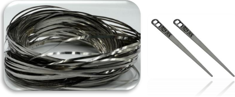
Görsel 2: Tel kırma iğnesi ve Tel kırma ipliği (URL-2).

Tel kırma yapılırken (+) artı şeklinde ve (x) çarpı şeklinde olarak iki tekniği bulunmaktadır (Görsel 3). Bu teknikler yan yana getirilerek motifler oluşturulmaktadır (Karaçorlu ve Yetim,2016:1119).