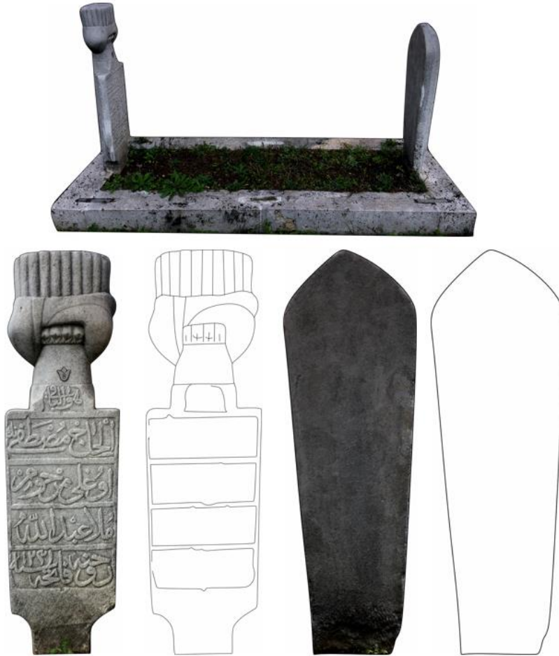
Şekil 7. Abdullah'ın Mezarı, Baş ve Ayak Şahidesi

هول باقی ال حاج مصطفیٰ اوغلی مرحوم ملا عبد اللہ روحنه فاتحه سن ۱۲۳۱