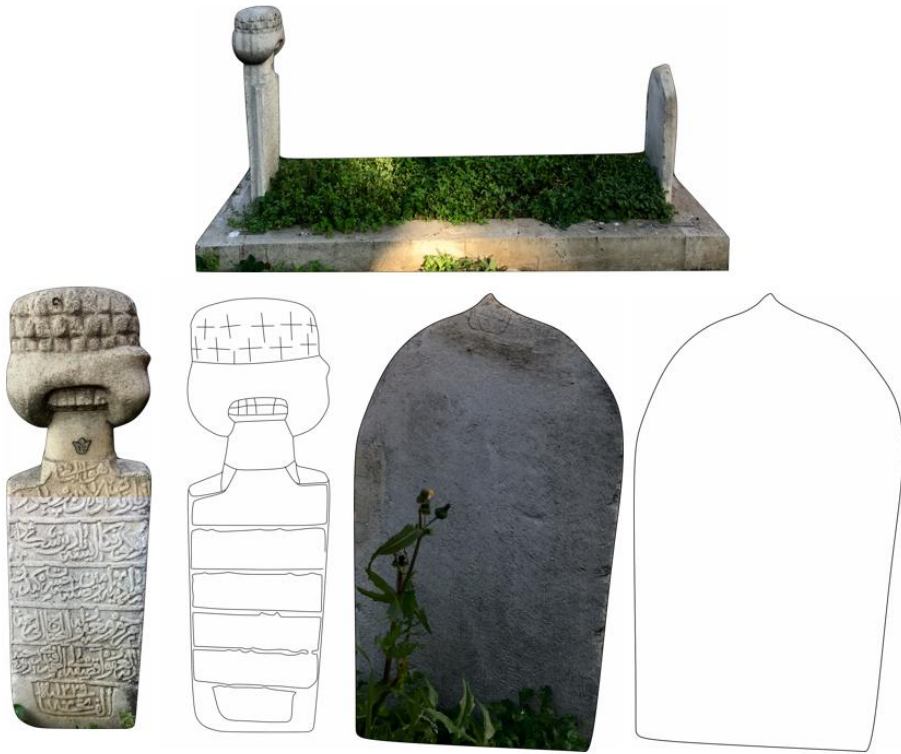
Şekil 6. Ahmed Efendi'nin Mezarı, Baş ve Ayak Şahidesi

هول باقی زیارتدن اولان بر دعدر بوکوم بنکا ایسه یارن سکا در مورادنا ایرمدن صلسنه حسرت کیدن مرحوم و مغفورون له ال محتاج ایلا رحمتی رأبحیل غافور احسحای أحمد افندی روحونه ال فاتحه ۱۲۲۹