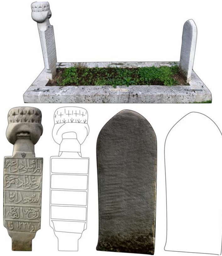
Şekil 4. Esad Ağa'nın Mezarı, Baş ve Ayak Şahidesi

ابرايلى دلي عمر اوغلي زاده مرحوم اسعد اغا روحنه ال فاتحه في ١١ ذا ١٢٢٧