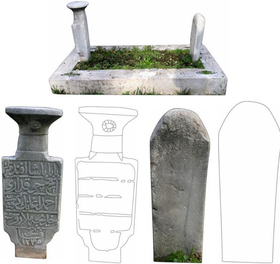
Şekil 8. Hadice Hanım'ın Mezarı, Baş ve Ayak Şahidesi

بابا پاشا افندي ال حاج چوقداري آحمد آغا نك كريمسي حدي جه ملا روحنه فاتحه ١٢٣٥