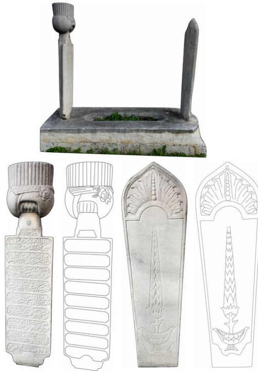
Şekil 5. Mustafa Ağa'nın Mezarı, Baş ve Ayak Şahidesi