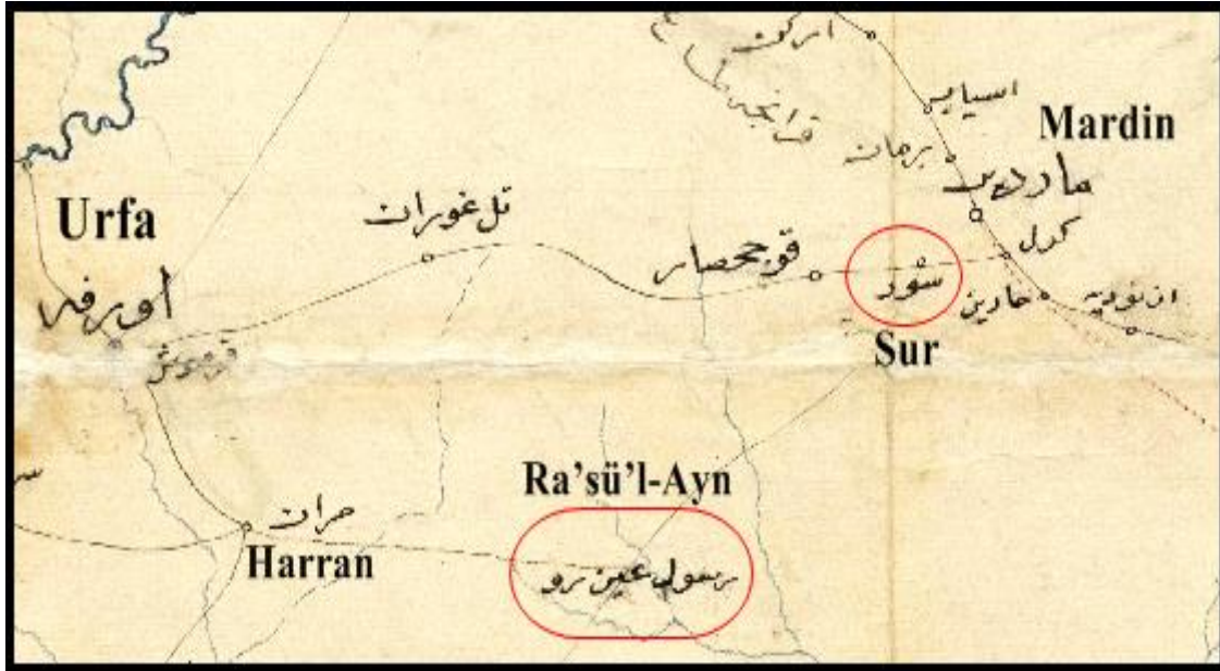
Harita 1: Ra'sü'l-Ayn ve Sur Kasabasını Gösteren Harita (BOA, HRT. 401, (Hicri 29 Zilhicce 1341)

Bu doğrultuda ilgili devlet birimleri harekete geçirilmiş ve su isale hattının yapılması için bölgeye bir mühendis gönderilmiştir. Ancak gönderilen mühendisin hastalanması üzerine proje gecikmiştir (BOA, BEO, 329/ 24627.1). Bu durum kasabadaki su sorunun daha da büyümesine neden olmuştur. Sur kasabasındaki susuzluk sorunu büyüyünce suyun bir an önce kasabaya ulaştırılması için yeni bir keşfin yapılması ve su isale hattının biran önce yapılması istenmiştir (BOA, BEO, 422 / 31594).