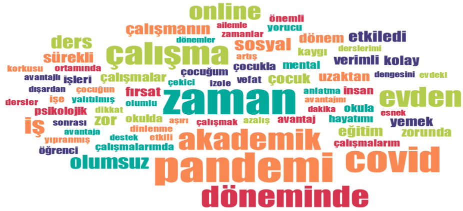
Şekil 1. En Fazla Kullanılan Kelimelere Ait Kelime Bulutu

Evde çalışma yöntemi hakkındaki soruların analizi yapıldığında katılımcıların verdiği cevaplar doğrultusunda “Avantaj” ve “Dezavantaj” ana temaları belirlenmiştir. “Avantaj” ana temasının alt temaları ise “Mesainin Olmaması, Zaman Tasarrufu, Mekân Kolaylığı, Yoldan Tasarruf (Ekonomik Açıdan), Derslerin Online Olması” olarak sıralanmaktadır. “Dezavantaj” ana temasında ise “Çalışma Disiplinin Azalması, Çalışma Verimliliğinin Düşüklüğü, Yüz yüze Eğitimin Olmaması, İş-Yaşam Dengesinin Bozulması, Çocuk Bakımı ile Harcanan Sürenin Artması” gibi temalar yer almaktadır. Yapılan analizler sonucunda katılımcılar tarafından en fazla dile getirilen alt temalar “Dezavantaj” ana teması alt başlığında yer alan “Çalışma Verimliliğinin Düşmesi” ve “İş Yaşam Dengesinin Bozulması” alt temaları olarak görülmektedir. İkinci en çok bahsedilen alt tema ise “Mental Yorgunluk” olmaktadır. Analiz sonucunda ortaya çıkan bir diğer sonuca göre katılımcıların en az bahsettiği alt tema ise “Avantaj” ana temasında yer alan “Yoldan Tasarruf” alt temasıdır. Buna göre “Yoldan Tasarruf” temasının katılımcılar tarafından çok fazla değerlendirilmediği görülmektedir.