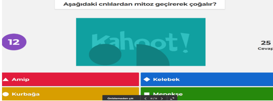
Şekil 6. Kahoot ile Çevrimiçi Bilgi Yarışması

önemli noktaları test sorularına dönüştürmüş ve oluşturdukları 30 soruluk testi kaydederek uygulamanın belirlediği pin koduyla arkadaşlarıyla paylaşmışlardır. Yarışmayı tasarlayan öğrenci, kendi telefonundan yarışmayı yönetmiş ve başarılı olan öğrencilerin dereceleri sesli duyurularak sınıfta yarışma atmosferi oluşturulmuştur.