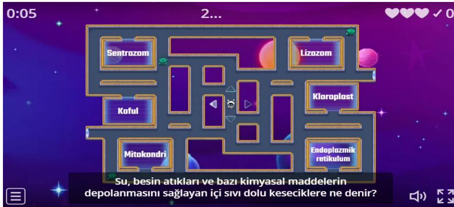
Şekil 1. Sitoplazma Organellerini Labirent Kovalamaca Oyunu ile Bulma

Öğrenciler tarafından hazırlanan Şekil 2'deki oyun, wordwall isimli sitede gerçekleşen eşleştirme oyunudur. Bu oyun, sitoplazmanın görevleri ile organellerin doğru bir şekilde eşleştirilmesini gerektirmektedir. Tüm eşleştirmelerin doğru bir şekilde yapılması durumunda puan alınırken, yanlış yanıtlama durumunda herhangi bir puan elde edilememektedir. Bu oyunun birkaç kez tekrarlanarak öğrencilerin yanlış yanıtlarını gözden geçirmeleri amaçlanmıştır.