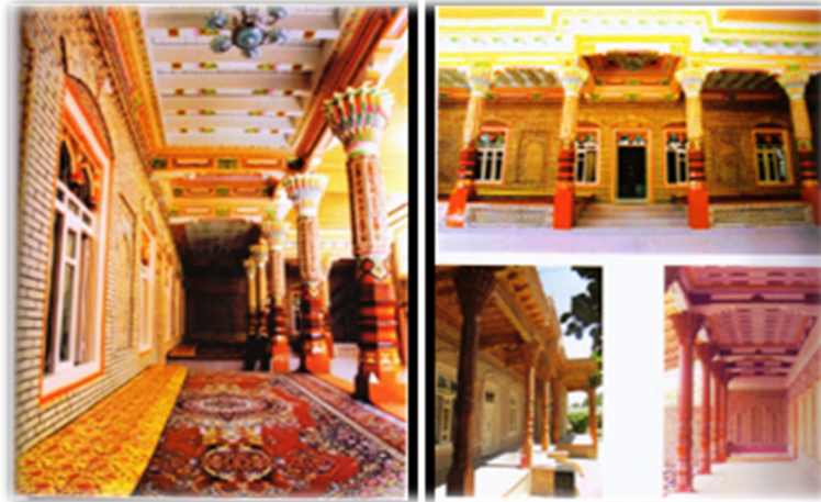
Görsel 6: Uygur geleneksel Pişayvan görüntüsü (Tursun 2005: 77).

Pişayvan'ın Görsel 7'de görüldüğü gibi üst tarafı ve iki yanı kapalıdır, ön tarafı süslenmiş ahşap direklerle desteklenmiştir (Tursun, 2005: 75). Veranda yazın misafir ağırlama ya da ev halkının yeme içme, dinlenme mekânı olarak kullanılır.