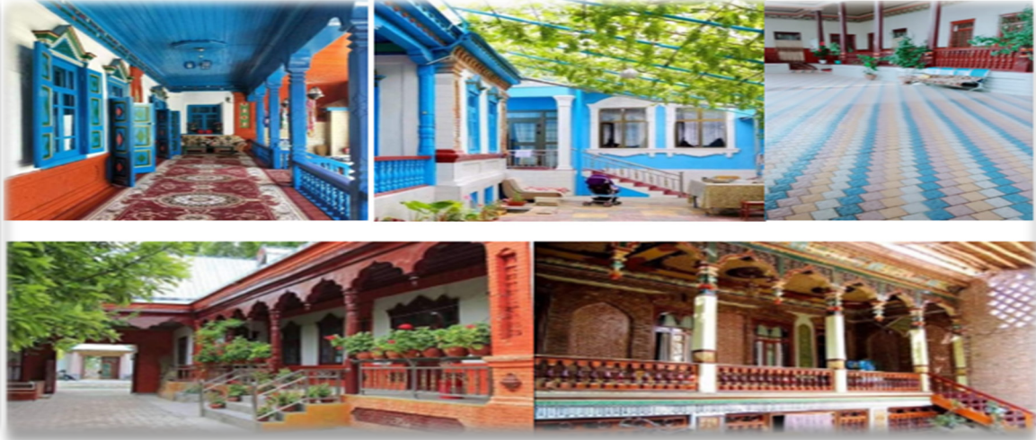
Görsel 5: Uygur geleneksel evlerinin avlu ve veranda görüntüsü (URL 1).

Geleneksel Uygur ev mimarisi farklı şekillerde yapılsa da her evin kendi içinde barındırdığı bölümlerin bezeme şekli ve kullanım amacı farklıdır. Salonlar, özel düzenlenmiş odalar olup evin büyüklüğüne göre her evde iki ya da üç salon olur. Bu bölümler, misafirleri ağırlamak için hazırlanır ve sahibinin ekonomik durumuna göre düzenlenir. Genellikle Görsel 6'da görüldüğü gibi çok ihtişamlıdır. Saray denilen oda, ev sahibinin yaz ve kış, günün belli saatlerinde oturma, yatma, dinlenme ve aile fertlerinin çay içip sohbet etmesi için kullanılan oda olup gündelik yaşam için gerekli malzemeler ile donatılmıştır. Odanın süslemesi salona göre biraz basittir. Kiler (kaznak) kışlık ve yazlık yiyeceklerin konulduğu depo amaçlı kullanılan mekândır. Mutfak (aşhana) yemek pişirme ve yemek yeme bölümlerinden oluşur. Köylerde mutfakta genelde soba veya duvar ocağı bulunur. Yemek kışın sobada, yazın duvar ocağında pişirilir. Yemekler ev halkı ile birlikte yer sofrasında yenilir.