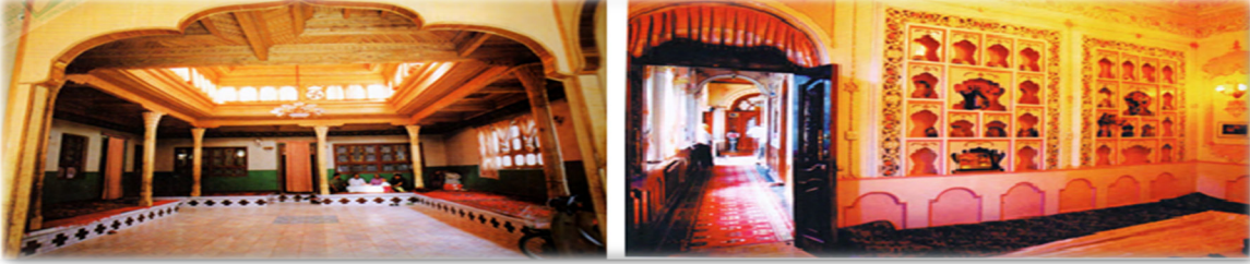
Görsel 4: Uygur geleneksel evinin iç mekân görüntüsü (Kırsal ve Şehirde) (URL 1).