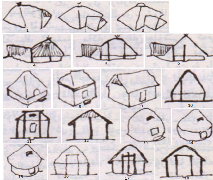
Görsel 1: İlk çağ çadır evlerin gelişim şeması (Mehsut, 1999: 34-35).

İnsanlar, tarih öncesi çağlarda ilk önce ormanlarda ve mağaralarda yaşamışlardır, daha sonra ağaç dalları, yapraklar ve otlar ile basit çadırlar yapıp, üstünü ağaç kabukları ve hayvan derileri ile kapatıp yağışlardan korunmalarını sağlayan basit yapılar inşa etmişlerdir. İlk çağlarda basit yapılarda yaşayan insanlar zaman içerisinde, doğanın gücüne olan bir nevi saygılarını ve sevgilerini yansıttıkları, avlulu evler inşa etmeye başlamışlardır. Mehsut'e göre, ev mimarisi mimarlık tarihindeki en eski tür olup, ilk çağlardan başlamıştır ve (Görsel 1'deki gibi) basitlikten zorluğa, küçükten büyüğe, kabalıktan zarıflığe doğru gelişmiştir (Mehsut, 1999: 33).