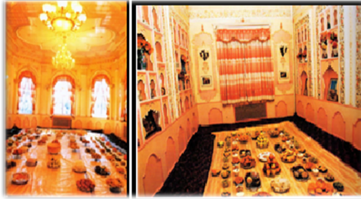
Görsel 6: Uygur geleneksel evinin salon (Mihmanhana) görüntüsü (Tursun, 2005: 44).

Ayrıca her odadan avluya çıkış kapıları bulunmaktadır. Hem de bir kapıdan girdikten sonra içerideki bütün odalar dolaşılabilir. Odaların kapıları veya pencereleri güneşe göre ayarlanmış olup bazıları caddeye, manzaraya bakacak şekilde, bazıları avluya bakacak şekilde yerleştirilmiştir. Avlunun bir tarafında (bahçeye yakın kısmında) yaşam alanı ile bitişik olmayan alanda büyük-küçükbaş hayvan ahırları ve köpek kulübeleri, tavuk katekleri (kümes) yer alır.