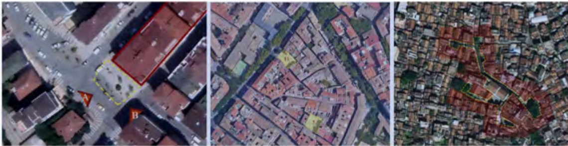
Şekil 12. Sırasıyla Zümrütevler Uygulaması (Taktiksel Şehircilik), Estonoesunsolar (Kentsel Akupunktur) ve Shajin Fuarı (Kentsel Kürasyon) örneklerinin kentsel dokuya ölçek bağlamında etkisi

için farklı aktörlere başvurulmaktadır. Aktör müdahaleyi üretirken kullanıcıyla iletişime geçebilmekte ve onu sürece dahil edebilmektedir ancak kurgunun organizasyonu tasarımcı aktördedir. Bu durum müdahalenin gücünün planlama süreçlerine etki etmesi ve devamlılığının takibi açısından olumludur. Taktiksel şehircilik uygulamalarında da ortaya çıktıktan sonra, hareketin farklı kuruluş veya tasarımcılar tarafından sahiplenilip devam ettirildiği veya başka yerlerde benzer şekilde uygulandığı görülmektedir. Kentsel kürasyon, kullanıcı ile çözüm aktörleri arasında arabulucu bir süreç ürettiğinden fikirler birlikte tartışılmakta; uygulamalar tasarımcıların veya sanatçıların yönlendirmesi ve öncülüğünde gerçekleşmektedir. Alandan ve kullanıcıdan alınan verilerin birlikte işlenmesinden sonra üretimin belli grupların yönlendirmesiyle yapılması, tutarlı, bütünsel ve kentin diğer noktalarıyla ilişkili olmasını sağlamaktadır. Katılımın düzeyi farklılaşsa da üç yaklaşımda da kentlinin dönüşüme dahil edilmesi önemsenmektedir. Ölçek üzerinden bakıldığında taktiksel şehirciliğin yerel nitelikli ve genelde yüzey, parsel veya donatı bazında; mahalle ölçeğinde etkin olduğu görülmektedir (Şekil 12). Kentsel akupunktur farklı ölçeklerde, aynı anda veya aşamalı olarak tekrarlanabilir