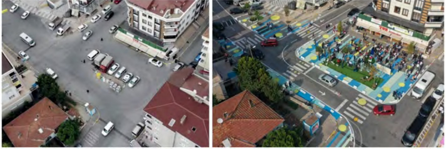
Şekil 6. Zümrütevler Uygulaması Öncesi ve Sonrası

belirgin hale getiren yaya geçitleri ve dönüş sınırları planlanmıştır. Tasarım aşamasından sonra yayaların ve çocukların güvenli ve aktif şekilde kullanabileceği, oturma ve oyun elemanları içeren, renklerle belirlenmiş bir kullanım alanı uygulaması yapılmıştır (Şekil 6). Tasarımın oluşturulmasından uygulanmasına kadar olan süreçte mahalle halkı projeye her aşamada dahil edilerek katılımcı ve kapsayıcı bir süreç izlenmiştir. Deneyim ve kullanım sonrası çevreden alınan geri bildirimlerle alanda vakit geçiren kişi sayısında %72'lik bir artış ve insanların sokakta kendilerini güvende hissetme oranında artış olduğu gözlemlenmiştir (Superpool, 2021). Projenin her adımının şeffaflık ve açıklıkla paylaşılması, güncel yaklaşımların Türkiye’de yeni uygulanmaya başladığı düşünüldüğünde, yol gösterici ve diğer aktörler için farkındalık yaratıcı olması açısından değerli görülmektedir.