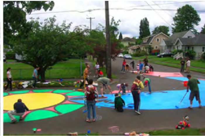
Şekil 2. Oturma Mekânı Oluşturma, Asfalt Boyama Gibi Kendin Yap Şehircilik Örnekleri