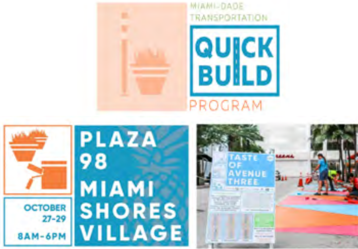
Şekil 4. MDT Program Logosu ve Projelerin Tanıtım Görselleri

marka kimliği, logo hazırlama ve pazarlama süreçlerinden sonra 2017 yılının ocak ve haziran ayları arasında her ay düzenlenen atölyelerle, pilot projeler üretmeleri için insanların hızlı-inşa sürecini öğrenmesi, katılımın teşvik edilmesi ve uygulama fikirlerinin ortaya çıkarılması desteklenmiştir (SPC, nd.). Hazırlanan 68 öneri proje arasından MDT programı paydaşları tarafından coğrafi çeşitlilik, erişilebilirlik, bütçe eşleşmesi gibi parametrelere göre ayrılmış bisiklet yolları, otobüs durağı iyileştirmeleri, yol bulma ( wayfinding ) ve trafiği düzenleme önerilerini içeren 18 proje seçilmiştir. 2017 yılı kasım ayında boş bir kaldırım alanının bir etkinlik alanına dönüşümüyle gerçekleşen “Plaza 98” projesiyle ilk uygulaması yapılan program, Miami’nin Little Havana semtinde metrobüs ve tramvay ile ilişki kuran yol bulma projeleri, 2018 yılı ekim ayında gerçekleşen “Taste of Avenue 3” cadde düzenleme ve etkinlik alanı ile devam etmiştir (SPC, nd.) (Şekil 4).