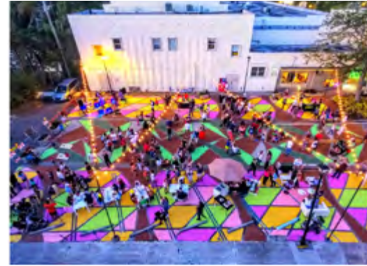
Şekil 5. Plaza 98 Uygulamasının Öncesi ve Sonrası

Türkiye’de yapılan bir projede Superpool tasarım ofisi, Maltepe, Zümrütevler Mahallesi’nde Bernard van Leer Vakfı tarafından yürütülen ve “Kenti 95 santimetreden, yani üç yaşındaki sağlıklı bir çocuğun boyundan görseydiniz, neyi değiştirirdiniz?” sorusuyla yola çıkan Urban95 programı kapsamında bir taktiksel şehircilik uygulaması gerçekleştirmiştir (Superpool, 2021). Uygulama öncesinde toplanan veriler ve yapılan analizler doğrultusunda, bölgedeki açık alan ve park eksikliği göz önüne alınarak, tanımsız bir yol ve kavşak alanını daha