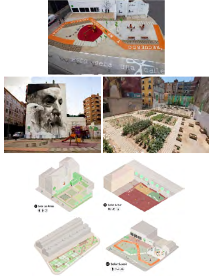
Şekil 8. Estonoesunsolar Müdahalelerinden Örnekler ve Mekân Kullanım Çeşitliliği

Müdahalelerin hepsinde çeşitli kültürel etkinlikler, toplanma ve paylaşım senaryoları gerçekleştirilmektedir. Günün sonunda her müdahalenin ayrı gibi görünse de küçük eylemlerin birliktelikleriyle daha geniş etki yaratan bir ağ oluşturduğu görülmektedir. Çeşitli referanslarla incelenen kentsel akupunkturun, mekâna yalın ve noktasal müdahalelerle yaklaşmasıyla küçük ölçekte fiziksel değişimler yaratmasına karşın kentte geniş alanlara yayılan etki düzeyleri ve mekânı yaşamsal boyutta dönüştürme alternatifleri ürettiği görülmektedir.