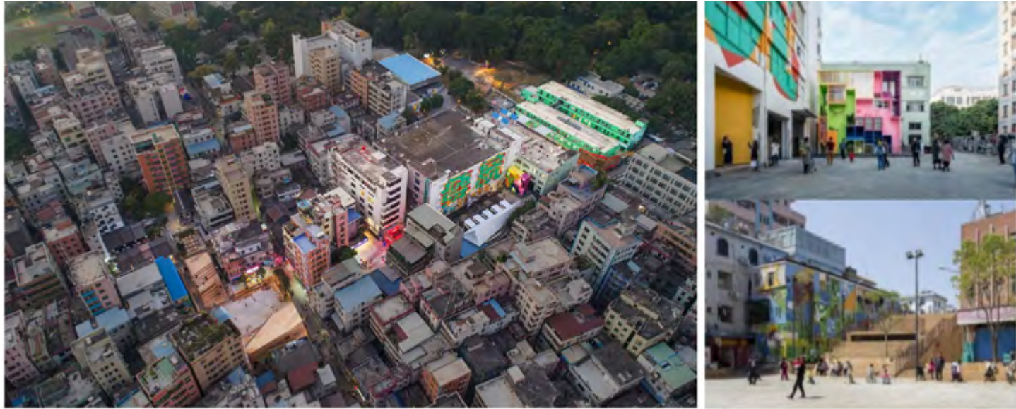
Şekil 11. Nantou Antik Kenti Yenilemesinin kentsel dokuya mekânsal etkisi

İncelenen örneklerle birlikte kentsel kürasyon yaklaşımının parçalı müdahalelerle oluşmasına rağmen bu müdahalelerin kendi aralarında anlamsal ilişkiler taşımaları açısından diğer yaklaşımlardan farklılaşmakta olduğu görülmektedir. Kentsel kürasyon; kentsel bir düzenleme veya hareketin, çeşitli boyutlarla birlikte aşamalı ve süreklilik içeren mekânsal-zamansal ilişkilerle, bir deneyim mekânı ve süreci olarak kurgulanması şeklinde ifade edilebilir. Bununla birlikte yaklaşım, farklı disiplinleri birleştiren organizasyonel karakterini sanat ile kurduğu yakın ilişki üzerinden kazanmaktadır. Kentin çok boyutlu yapısına duyarlı stratejiler benimseyerek deneyimi çeşitlendirmesi; planlama ve sanat arasındaki çeşitli uygulamaları tanımlayan terimlerden biri olarak uygulama ve araştırmayı içermesiyle kentsel pratiklere yeni perspektifler açma potansiyeli taşımaktadır.