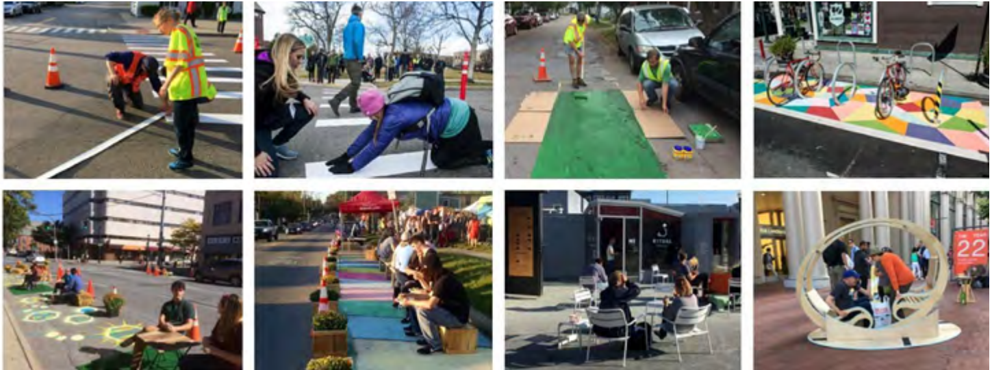
Şekil 3. Taktiksel Şehircilikte Yüzey, Kentsel Donatı ve Peyzaj Elemanı Uygulama Örnekleri (Kaynak: Lydon & Garcia, 2015)

Street Plan Colloborative (SPC) farklı paydaşların ve halktan katılımcıların da içerisinde yer aldığı birçok proje gerçekleştirmektedir. Bunlardan “MDT Quick Build Program” olarak adlandırılan hızlı uygulama projesi kapsamında Miami-Dade İlçesi Ulaştırma ve Bayındırlık Bakanlığı ve Yeşil Hareketlilik Ağı ile aşamalı ve birbirleriyle ilişkili uygulamalar yapılmaktadır. İş birliği, insanların mahallelerinde katılımlı ve anlamlı iyileştirmeler yapmasını kolaylaştırmayı, proje önerileri ve fikirlerinin devlet kurumlarına ulaştırılabilmesini ve paydaşlar arasında ortaklık sağlamayı amaçlamaktadır. SPC’nin koordine ettiği