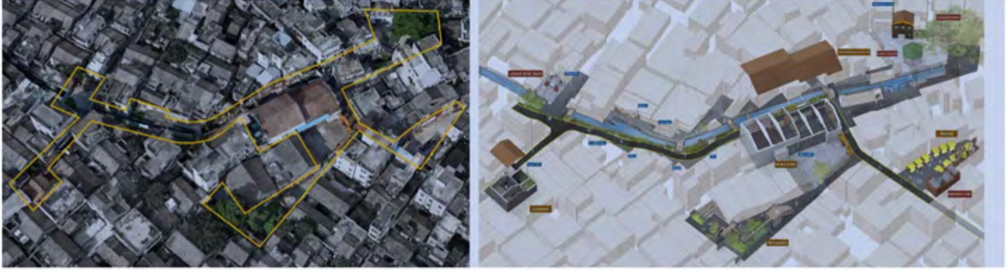
Şekil 9. Shajing Antik Fuarı'nın Yenilenmesi Mekânsal Kurgusunun Öncesi ve Sonrası- ARcity-2019

Projedeki tüm yenilemelerin içerisinde dahil olarak nehir boyunca mahallede bir akış yaratan; duvar resimleriyle, boyanmış yüzeylerle ve çevreye eklenen üç boyutlu sanatsal elemanlarla bir rota oluşturan 'Zamanın Kayması' sergisi müdahaleleri bütünlükten bir omurga niteliğindedir (Şekil 10). Mahalledeki yaşamsal akışı bir kent sergisi ile birleştiren bu yaklaşım yeni bir kentsel deneyim biçimi üretmektedir. Kentin yeni dönüşüm biçimini 'kentsel kürasyon' olarak nitelendiren tasarım ofisi, bu stratejinin