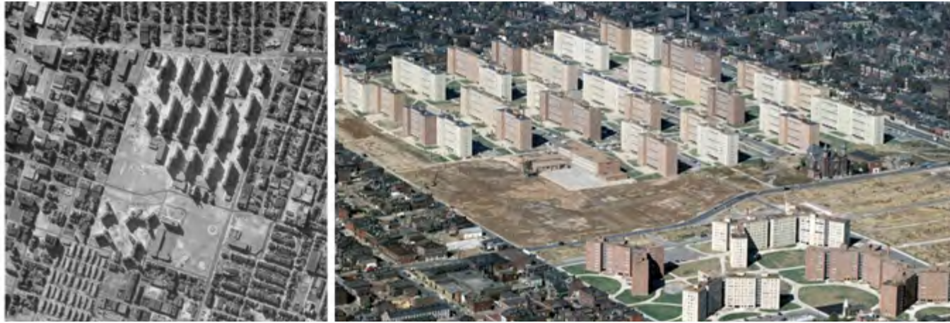
Şekil 1. Pruitt-Igoe Konutlarının Çevresiyle ve Kullanılmayan Alanlarla Kurduğu İlişki (Kaynak: Fiederer, 2017)

sonrasında artakalan geniş bölgelerin oluşması, modern kent planlaması anlayışının kenti bölgelemesi ve açık alanların ölçeksizleşmesi sonucu ortaya çıkan durum kentte ihmal edilen ve atılmaşan mekânlar ortaya çıkarmıştır (Trancik, 1986). Loukatiou ve Sideris’in “çöp ve insan atıklarıyla doldurulan boş alanlar; artık, yeterince kullanılmayan ve genellikle bozulmaya yüz tutmuş yerler” şeklinde açıkladıkları “şehirdeki çatlaklar” kavramı da bahsedilen tanımsız mekânlar için yapılan bir başka yorumdur (Loukatiou ve Sideris, 1996). Northam (1971) tarafından inşa edilebilirlik, inşa edilebilirliğin maddi değeri ve mülkiyet üzerinden yorumlanarak açıklanan “boş arazi” kavramı, Pagano ve Bowman (2000) tarafından terk edilmiş yapıların bulunduğu veya terk edilmiş araziler, kullanılmayan veya az kullanılan parseller, çevresel tarım arazileri gibi ifadelerle tanımlanırken kavramın çağrıştırdığı olumsuz anlamın yanında yerelliği maksimize etme potansiyeli ve fırsatları sembolize ettiğine dikkat çekilmektedir (Pagano ve Bowman, 2000).