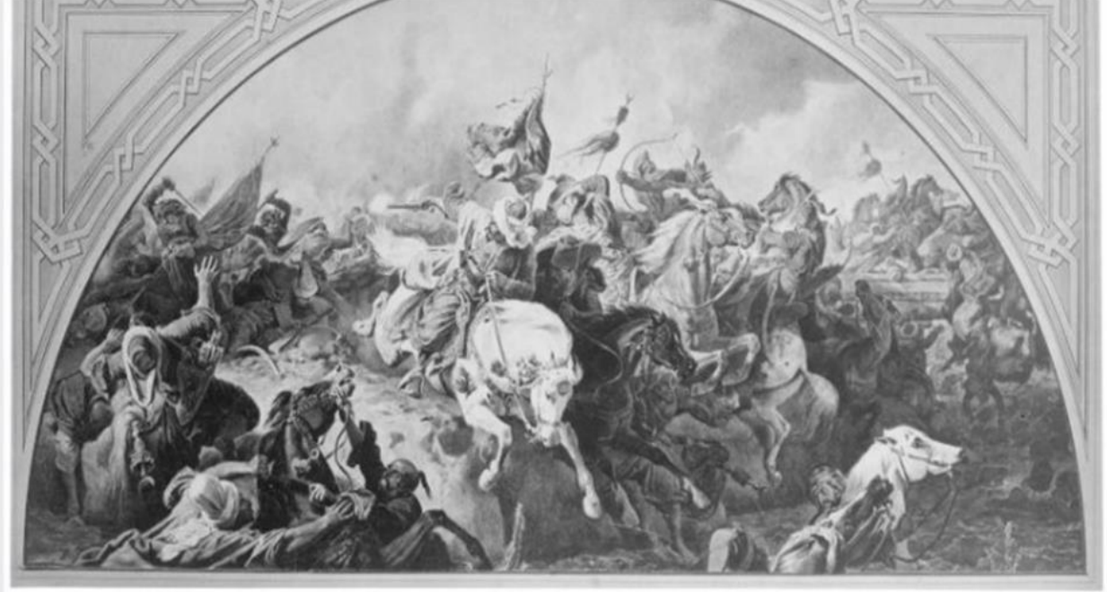
Die Schlacht bei Zenta. 1697. Sept. 11.

(Österreichische Nationalbibliothek Bildarchiv und Grafiksammlung Signatur: L 58928-C)