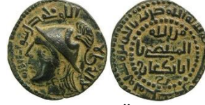
Görsel 4a. Ön Yüz