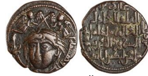
Görsel 2a. Ön Yüz Görsel 2b. Arka Yüz ANS-1917.215.1003

Ön Yüz Tanımı: Orta bölümde insan büstü ve uçan yaratık figürleri yer almaktadır. Hafifçe sağa bakan insan; pelerinli dağınık saçlı, iri badem gözlü ince burunlu, şişkin yanaklı ve küçük ağızlı tasvir edilmiştir. Yaratıklar ise kanatlı insan tarzında betimlenmiştir. Bu figürlerin etrafına sikkenin basım yılı hakkedilmiştir. Kompozisyon sikkenin en dış yüzeyine yerleştirilen inci dizili daire konturla sonlanmıştır (Görsel 2a).