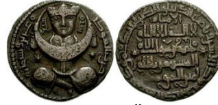
Görsel 12a. Ön Yüz Görsel 12b. Arka Yüz Zeno.ru-45165

Ön Yüz Tanımı: Orta bölümde bağdaş kurmuş elinde hilal tutan insan figürü yer almaktadır. Düz bakan insan; börklü, kaftanlı, iri badem gözlü, ince burunlu, şişkin yanaklı ve küçük ağızlı tasvir edilmiştir. Bu figürün sağında ve solunda basit yıldız motifleri bulunmaktadır. Figür ve motiflerin etrafına sikkenin basım yeri ve yılı hakkedilmiştir. Kompozisyon sikkenin en dış yüzeyine yerleştirilen inci dizili daire konturla sonlanmıştır (Görsel 12a).