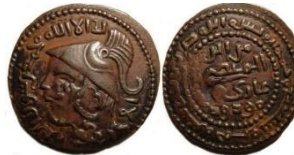
Görsel 5a. Ön Yüz