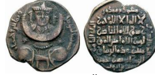
Görsel 8a. Ön Yüz Görsel 8b. Arka Yüz Zeno.ru-46198

Ön Yüz Tanımı: Orta bölümde bağdaş kurmuş elinde hilal tutan insan figürü yer almaktadır. Düz bakan insan; börklü, kaftanlı, iri badem gözlü, ince burunlu, şişkin yanaklı ve küçük ağızlı tasvir edilmiştir. Bu figürün sağında ve solunda basit yıldız motifleri bulunmaktadır. Figür ve motiflerin etrafına sikkenin basım yeri ve yılı hakkedilmiştir. Kompozisyon sikkenin en dış yüzeyine yerleştirilen düz daire konturla sonlanmıştır (Görsel 8a).