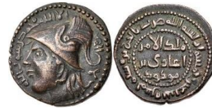
Görsel 3a. Ön Yüz Görsel 3b. Arka Yüz Zeno.ru-67807

Ön Yüz Tanımı: Orta bölümde insan büstü figürü yer almaktadır. Sağa bakan insan; miğferli, uzun saçlı, iri gözlü, kalın ve uzun burunlu, şişkin yanaklı, büyük ağızlı ve uzun çeneli tasvir edilmiştir. Bu figürün etrafına Kelime-i Tevhid hakkedilmiştir. Kompozisyon sikkenin en dış yüzeyine yerleştirilen inci dizili daire konturla sonlanmıştır (Görsel 3a).