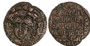
Görsel 11a. Ön Yüz Görsel 11b. Arka Yüz ANS-1991.3.560