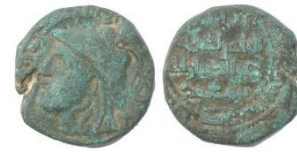
Görsel 7a. Ön Yüz Görsel 7b. Arka Yüz Zeno.ru-36491

Ön Yüz Tanımı: Orta bölümde insan büstü figürü yer almaktadır. Sağa bakan insan; miğferli, uzun saçlı, iri gözlü, kalın ve uzun burunlu, şişkin yanaklı, büyük ağızlı ve uzun çeneli tasvir edilmiştir. Bu figürün etrafına Kelime-i Tevhid hakkedilmiştir. Kompozisyon sikkenin en dış yüzeyine yerleştirilen inci dizili daire konturla sonlanmıştır (Görsel 7a).