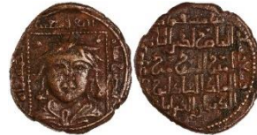
Görsel 9a. Ön Yüz Görsel 9b. Arka Yüz ANS-1941.55.5

Ön Yüz Tanımı: Orta bölümde insan büstü figürü yer almaktadır. Düz bakan insan; pelerimli, pendilialı, dağınık saçlı, iri badem gözlü, ince burunlu, şişkin yanaklı ve küçük ağızlı tasvir edilmiştir. Bu figürün sağında ve solunda basit yıldız motifleri bulunmaktadır. Figür ve motifler, inci dizili kare konturla çevrelenmiştir. Konturun etrafına sikkenin basım yeri ve yılı hakkedilmiştir. Kompozisyon sikkenin en dış yüzeyine yerleştirilen inci dizili daire konturla sonlanmıştır (Görsel 9a).