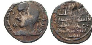
Görsel 10a. Ön Yüz Görsel 10b. Arka Yüz Zeno.ru-134541

Ön Yüz Tanımı: Orta bölümde insan büstü figürü yer almaktadır. Sağa bakan insan; diademli, pelerinli, kıvrıkcık saçlı, iri gözlü, kalın ve uzun burunlu, şişkin yanaklı, büyük ağızlı ve uzun çeneli tasvir edilmiştir. Bu figürün sağında ve solunda basit yıldız motifleri bulunmaktadır. Figür ve motiflerin etrafına besmele, sikkenin basım yeri ve yılı hakkedilmiştir. Kompozisyon sikkenin en dış yüzeyine yerleştirilen inci dizili daire konturla sonlanmıştır (Görsel 10a).