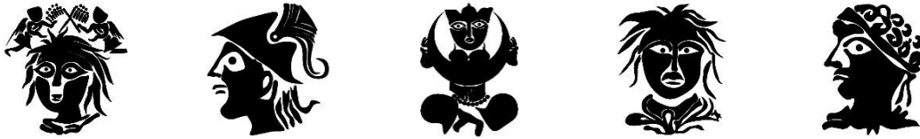
Çizim 1, 2, 3, 4, 5. Sikkelerde Yer Alan Figürlerin Çizimleri

Figürlerin tamamı insan figürleri şeklindedir. Hükümdarlığı ve gücü simgelediği benimsenen insan figürleri; üstünde kanatlı yaratıklarla hafifçe sağa bakan büst, miğferli sağa bakan büst, bağdaş kurmuş, pendilia ve pelerinli düz bakan büst ile diademli ve pelerinli sağa bakan büst gibi farklı betimlemeleriyle ön plana çıkmaktadır (Çizim 1, 2, 3, 4, 5).