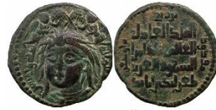
Görsel 1a. Ön Yüz