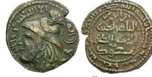
Görsel 6a. Ön Yüz Görsel 6b. Arka Yüz Zeno.ru-17829

Ön Yüz Tanımı: Orta bölümde insan büst figürü yer almaktadır. Sağa bakan insan; miğferli, uzun saçlı, iri gözlü, kalın ve uzun burunlu, şişkin yanaklı, büyük ağızlı ve uzun çeneli tasvir edilmiştir. Bu figürün etrafına Kelime-i Tevhid hakkedilmiştir. Kompozisyon sikkenin en dış yüzeyine yerleştirilen inci dizili daire konturla sonlanmıştır (Görsel 6a).