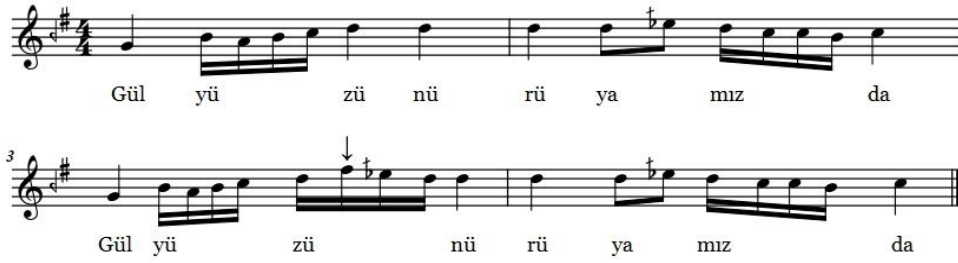
Şekil 20. Gül Yüzünü

3) Pest notalardan tiz notalara geçişte ya da tersi durumlarda pestleşme ve tizleşme hissiyatını vermeden yumuşak icra yapılmalıdır.