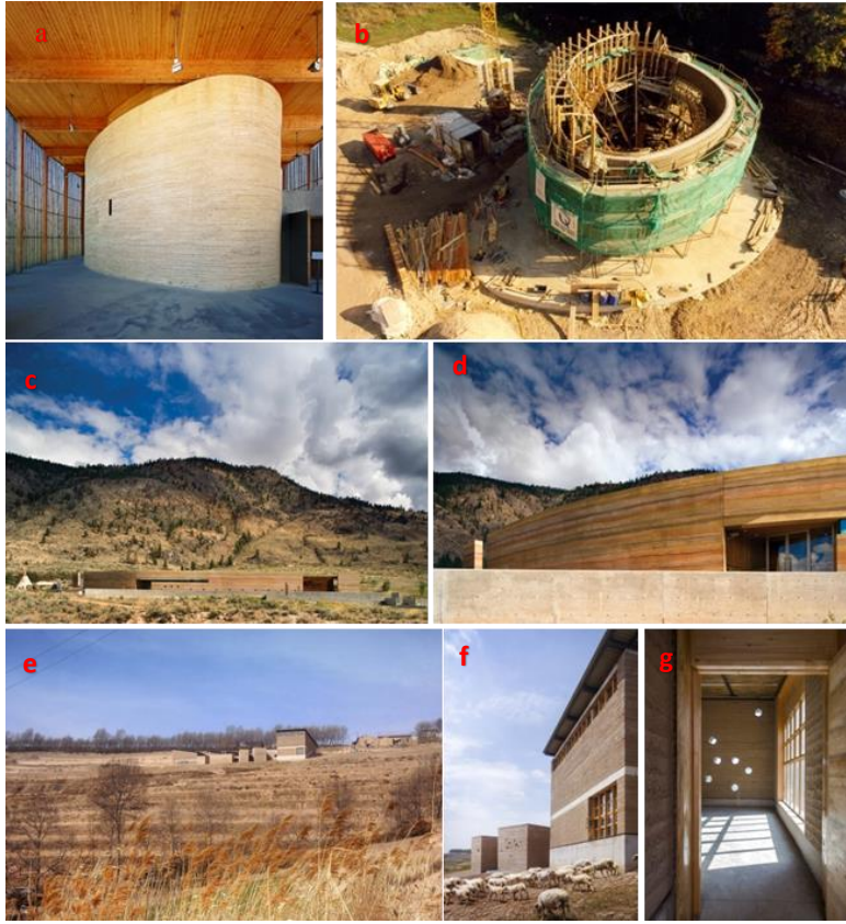
Şekil 3. Uzlaşma şapeli (a, b), Çöl Kültür Merkezi (c, d), Maçka Köyü konutları (e, f, g) (Url-3; Url-4; Url-5)

Türkiye’de ise 2011 yılında Konya’da inşa edilen 30 haneli Şükran Köyü, Şanlıurfa’da 2018 yılında inşa edilen Göbeklitepe Ziyaretçi ve Canlandırma Merkezi, İstanbul’da bulunan Cengiz Bektaş tarafından tasarlanan modern at çiftliği yapısı ve Elazığ’da inşa edilen Kadın Eğitim ve Üretim Merkezi modern kerpiç yapılara örnek olarak verilebilir. Şekil 4’te Türkiye’den örnek verilebilecek modern kerpiç yapılar gösterilmiştir.