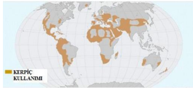
Şekil 1. Kerpiç kullanımının dünya üzerindeki dağılımı (Blondet, Garcia, Brzev, ve Rubiños, 2003)

Neolitik dönemin başlangıcı olan M.Ö. X. bin yıllara dayanan kerpiç kullanımı (Stevanović, 1997) ilk olarak Mezopotamya’da başlamış, Avrupa kıtasındaki ilk kullanımı ise Almanya’da görülmüştür (Minke, 2006). Kıbrıs’ta da kerpicin yapı malzemesi olarak kullanımı yine tarih öncesi çağlardan başlayarak 20. yy. ortalarına kadar devam etmiştir (Illampas, Ioannou, ve Charmpis, 2009). Dünyanın birçok yerinde yapı malzemesi olarak kullanılan kerpiç en çok Anadolu, Orta Asya, Orta ve Güney Amerika ve Afrika’da bulunmaktadır (Yavaş, 2021). Şekil 1’deki haritada kerpicin dünya üzerindeki dağılımı gösterilmiştir.