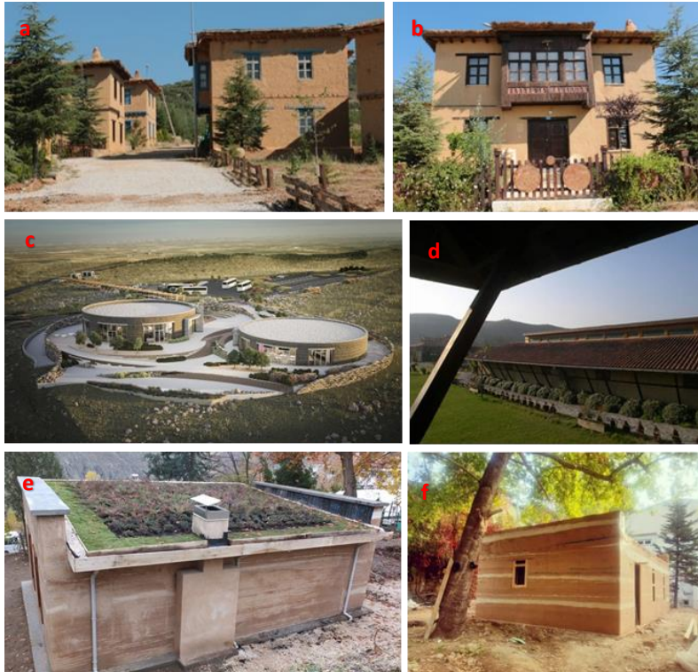
Şekil 4. Şükran Köyü konutları (a, b), Göbeklitepe Ziyaretçi ve Canlandırma Merkezi (c), At çiftliği (d), Kadın Eğitim ve Üretim Merkezi (f) (Url-6; Url-7; Url-8; Url-9)

Türkiye’de ise 2011 yılında Konya’da inşa edilen 30 haneli Şükran Köyü, Şanlıurfa’da 2018 yılında inşa edilen Göbeklitepe Ziyaretçi ve Canlandırma Merkezi, İstanbul’da bulunan Cengiz Bektaş tarafından tasarlanan modern at çiftliği yapısı ve Elazığ’da inşa edilen Kadın Eğitim ve Üretim Merkezi modern kerpiç yapılara örnek olarak verilebilir. Şekil 4’te Türkiye’den örnek verilebilecek modern kerpiç yapılar gösterilmiştir.