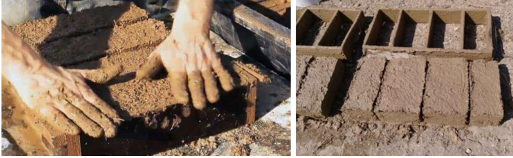
Şekil 5. Kerpiç tuğlası yapımı (Url-10)

Kil, kerpiçte dayanım sağlamakla birlikte kuruma esnasında çatlak oluşumuna da neden olur. Kerpiç harcının kuruma sırasında oluşabilecek çatlaklar bünyesine saman gibi lifli malzemeler katılarak kontrol altına alınmalıdır (Zami ve Lee, 2010). Saman genellikle 3-5 cm bölünerek karışıma eklenir (Bozyel, 2021). Literatürde kerpiç harcına farklı uzunluklarda eklenen lifin harçtaki davranışlarının aynı olmadığı deneysel çalışmalarla kanıtlanmıştır. Uygun kerpiç toprağı ve samanın belirlenen oranlarda harç haline gelmesi için ise su ile karılması gerekmektedir. Kullanılacak suda yağ, çürümüş madde, tuz miktarı kabarma yapacak oranda olmamalıdır (TSE, 1977). Şekil 5'te geleneksel kerpiçin hazırlanışı gösterilmiştir.