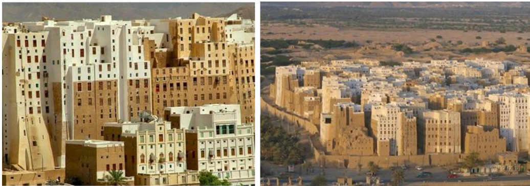
Şekil 2. UNESCO tarafından korunan Yemen/Sana bölgesindeki yüksek katlı kerpiç yapıları (Url-2)

Uzakdoğu’da savunma amaçlı güçlü Çin Seddi duvarı ve Van Kalesi kerpiçten inşa edilmiş olup (Url-1) Yemen’de çoğu 5-10 kat arasında değişen yapılar 30 metreyi bulan yükseklikleri ile dünyanın en yüksek kerpiç yapılarını oluşturmuştur (Yavaş, 2021) Şekil 2’de Yemen’in Sana bölgesinde bulunan yüksek katlı kerpiç yapılar gösterilmiştir.