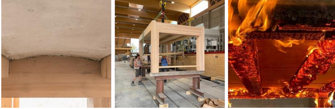
Şekil 7. Toprak blokla inşa edilen döşemede yangın testi (Url-11)