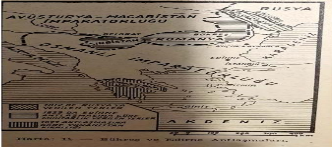
Görsel 4. Bükreş ve Edirne Antlaşmaları 103

Akşit'in Tarih III 'de, "Yunan ayaklanması" yan başlığında, ilk olarak Yunanların, Sırlar ve Bulgarlardan daha fazla imtiyaza sahip olduğu, toplu olarak bir bölgede yaşamadıkları; Osmanlı Devleti'nin her tarafına dağıldıkları ancak kıyı şehir ile kasabalarında daha kalabalık olarak buldukları Mora, Teselya ve Yunan adalarında çoğunluk oluşturdukları belirtilmiştir. Daha sonra Osmanlı Devleti'nde diğer Hristiyan milletlere olduğu gibi Yunanlara da dil, din ve mezhep özgürlüğü sağlandığı, bu durumdan yararlanan Yunanların âdeta bağımsız bir halde yaşadıkları ve Türk bayrağının koruması altında bulunan Rum gemicilerin Akdeniz ve Karadeniz ticaretini ellerine alarak zenginleştikleri vurgulanmıştır. Bu şekilde zenginleşen Rumların XIX. yüzyılın başlarında yüz civarında gemiye sahip oldukları ve korsanlara karşı bu gemileri silahlandırdıkları ifade edilmiştir 104 .