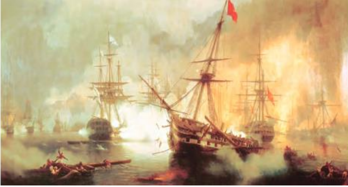
Görsel 7. Navarin Baskını Resmeden Tablo 153