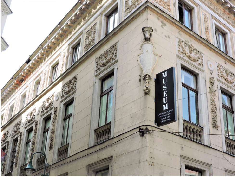
Görsel 3. İnsanlığa Karşı Suç ve Soykırım Müzesi.

Müzedede ayrıca Lahey'deki Eski Yugoslavya Uluslararası Ceza Mahkemesinde (ICTY) görülen savaş suçları davalarının arşivi, Bosna-Hersek genelindeki toplama kampları ve toplu mezarlara dair bilgiler ve belgeseller de bulunmakta, ciltler dolusu kayıtlarda öldürülen kişilerin isimleri, yaşları, ölüm tarihleri sıralanmaktadır (Besic, 2018; Söylemez, 2019). Müze sahip olduđu zengin arşiv ile 1992-1995 döneminde Bosna-Hersek'te yaşanan olayların araştırılması ve anlaşılması için multidisipliner bir yaklaşım sunmaktadır (Viator, 2023). "Kuşatma Altındaki Şehir" ve "Cezasızlığın Sonu - Mahkeme Önünde Cinsel Şiddet" ve korkularını yenerek mahkemede ifade veren mağdur ve tanıkları konu alan "Onların Gözünden" gibi savaşla ilgili filmlerin de gösterildiđi müzedede (Tolj, 2016) ayrıca ziyaretleri daha gerçekçi kılmak için bir toplu mezar simülasyonu ve bir hücre hapsi sunulmaktadır (Safarway, 2023).