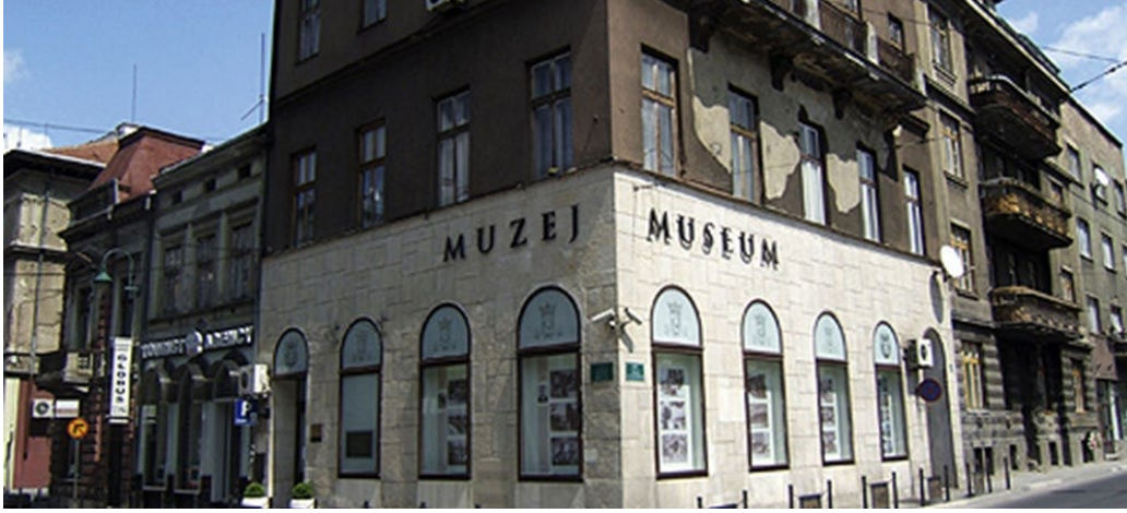
Görsel 1. Franz Ferdinand Suikast Alanı ve Müzesi (Museums of The World, 2024).

Dolayısıyla, bu alanların önemine dair değerlendirmeler, ziyaretçilerin beklentilerine ve turizm deneyimlerinden ne beklediklerine göre değişiklik gösterebilmektedir.