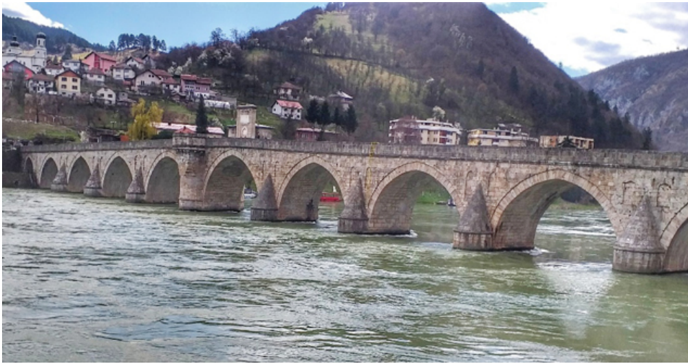
Görsel 10. Drina Köprüsü (Balkan News, 2021).

Vişegrad kasabası, 1992-1995 Bosna Savaşı sırasında Bosnalı Sırp tarafından başlatılan etnik temizlik ve soykırım harekâtlarının merkezi haline gelmiştir. Bu dönemde Drina Köprüsü, Sırp askerlerinin Müslüman Boşnaklara karşı işlediği katliamların simgesi olmuştur. Köprü, binlerce Boşnak'ın cesetlerinin Drina Nehri'ne atıldığı, nehrin turkuaz sularının kanla kıvılcı boyandığı ve yıllar sonra baraj gölünde cesetlerin bulunduğu bir trajediye tanıklık etmiştir. Vişegrad'daki bu olaylar, köprüyü bir ölüm simgesi haline getirmiş ve Bosna Savaşı'nın en karanlık yüzünü yansıtan bir sembol olarak öne çıkarmıştır (Çetinkaya, 2013; United Nations - International Criminal Tribunal for the former Yugoslavia, 2024; Vulliamy & Jelacic, 2005). Drina Köprüsü, bu trajik geçmişi ve sembolik değeriyle savaş turizminin en çarpıcı örneklerinden biri olarak anılmaktadır. Bu yüzden de belki de dünya üzerindeki "en hüznü köprü" olarak nitelendirilebilir (Popović, 2023; Totejo Türkiye, 2024).