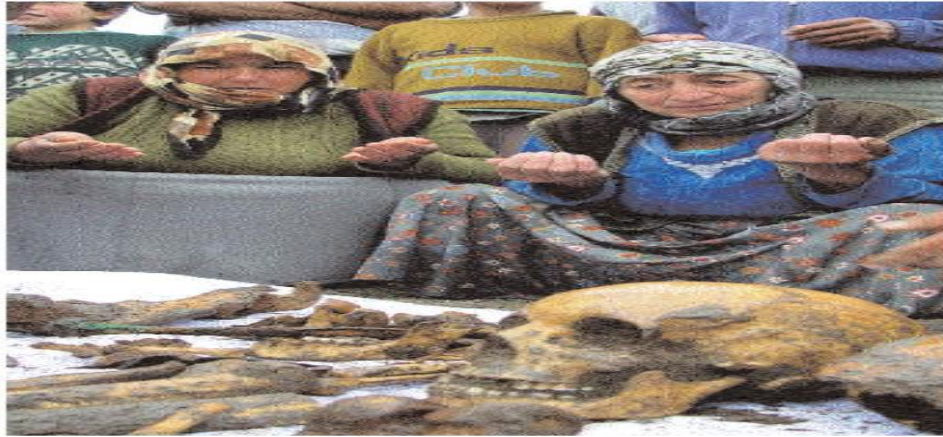
Gedikli/Tavus köyü kazısından görüntüler.

Ek:1 27 Mayıs 2003'te İğdır'ın Tuzluca İlçesi'ne bağlı Gedikli (Tavus) Köyü'nde yapılan toplu mezar kazısına ait görüntüler ( Kantarcı, 2003).