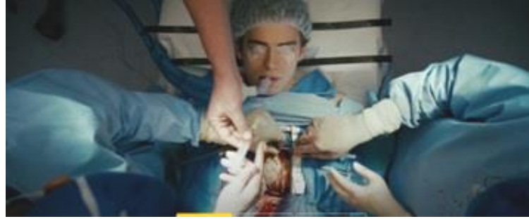
Görsel 14. Seyirciye Tüm Açıklığıyla Gösterilen Ameliyat Süreci (Awake - 2007)( https://www.hdfilmcehennemi.life/awake-hd-1/ )