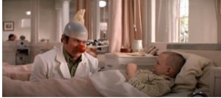
Görsel 15 Komik ve eğlenceli doktor figürü (Patch Adams -1998) ( https://www.fullhdfilmizlesene.pw/film/gercek-bir-hikaye-izle-1/ )

bölümlerde görülen otoriter ve sert tarafının filmde daha geri planda kalmasını sağlar. Ana karakter olan doktorun palyaço başta olmak üzere çeşitli taklitlerle çocuk hastalarını eğlendirdiği ve içinde bulunduğu gerçeklikten uzaklaştırdığı sahneler aslında bu durumun bir özeti gibidir (Görsel 15). Bu yolla seyirci, hastane mekânlarının işlevselliğe dayalı soğuk yapısından uzaklaştırılarak, doktorun hastalarına olan pozitif tavrına ve mizahi kimliğine yönlendirilir. Hasta çocukların yattığı bölümün mimarisi ve mekânsal özelliklerinin de bu komedi ve dram duygusunu destekler şekilde tasarlandığı görülür. Duvarlarda çizili resimler, bir evi andıran dolaplar, çocuklar için oyuncaklar ve odada parlak ışık ve renklerin kullanılması gibi unsurlarla izleyiciyi hastane ortamının soğukluğundan uzaklaştıran, daha sıcak, pozitif ve keyifli bir ortam yaratılmıştır (Görsel 16). Filmlerde hastanelerin sert ve soğuk havasının dağıtılması için bu tip mekânsal düzenlemelerin, dekor ve görüntü yönetimi planlamalarının sıklıkla yapıldığı görülür, -ki hastanelerin hasta psikolojisine uygun hale getirilmesi için benzer mimari tasarımların gerçek hayatta da uygulandığı görülür.