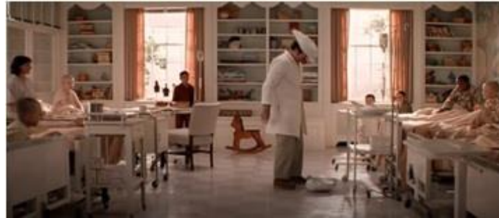
Görsel 16 Renkli ve aydınlık bir mimariye sahip olan çocuk yatak bölümü (Patch Adams - 1998)( https://www.fullhdfilmizlesene.pw/film/gercek-bir-hikaye-izle-1/ )