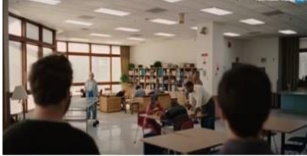
Görsel 18 Filmde kullanılan hastanenin çok amaçlı salonu (Komik Bir Hikaye - 2010)( https://www.fullhdfilmizlesene.pw/film/komik-bir-hikaye-izle-3/ )