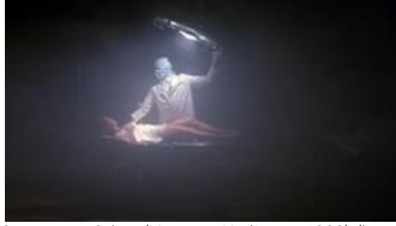
Görsel 12 9. Katta bulunan Operasyon Odası (Hastane Katliamı - 1982) ( https://ugurfilm3.com/hospital-massacre/ )