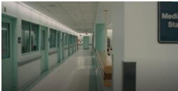
Görsel 20 Filmde kullanılan hasta yatak odası koridoru ve mimari yapısı (Komik Bir Hikaye - 2010)( https://www.fullhdfilmizlesene.pw/film/komik-bir-hikaye-izle-3/ )