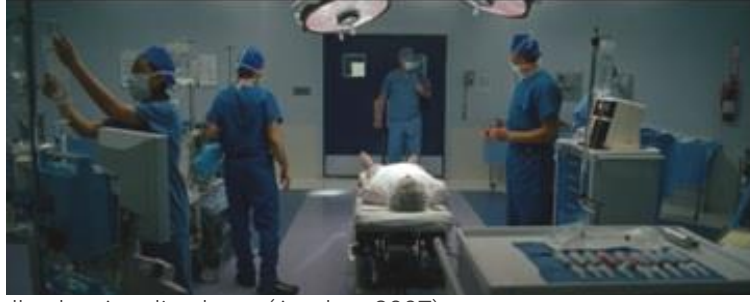
Görsel 13 Filmde Kullanılan Ameliyathane (Awake - 2007)