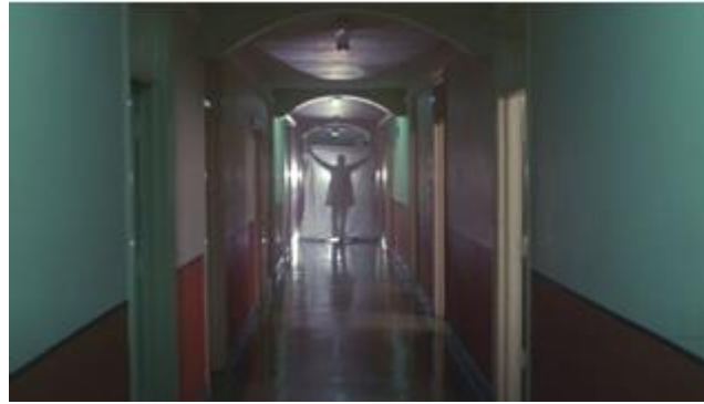
Görsel 10 Hastane koridoru ve katil doktor figürü (Hastane Katliamı - 1982)( https://ugurfilm3.com/hospital-massacre/3 )