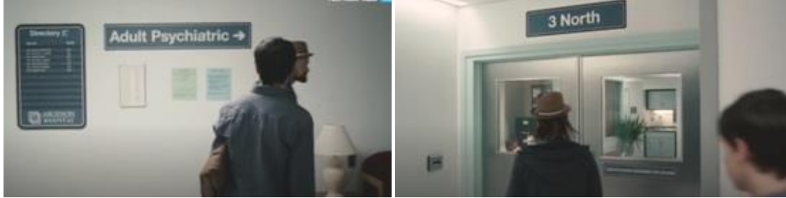
Görsel 17 Güvenlikli psikiyatri koğuşuna giriş sahnesi (Komik Bir Hikaye - 2010)( https://www.fullhdfilmizlesene.pw/film/komik-bir-hikaye-izle-3/ )

dramatik yapıya uygun olarak belirlenmiş karakterlere senaryoda yer verilmesiyle, filmin geçtiği hastanenin izleyiciye daha yaşanabilir bir mimari yapı ve ortam olarak sunulduğu gözlemlenir (Görsel 18-20). Bunun yanında, filmin önemli ve duygusal sahnelerinin geçtiği yer olan hasta yatak odası koridorunda ana karakterin okul arkadaşına ilan-ı aşk ederken hastanede tanıştığı kız tarafından görüldüğü sahnede, hasta yatak odası koridorunun mekânsal niteliği ve derinliğinden faydalanarak güçlü bir dramatik etki yaratılır (Görsel 21).