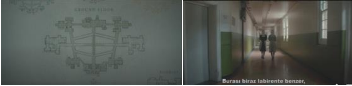
Görsel 4 The Power filmi (2021) ( https://www.fullhdizle.me/the-power-izle-2021-full-hd/ )

Bu çerçevede, 2021 yılında vizyona giren The Power filmi gibi tamamı hastanede geçen veya 2022 yılında vizyona giren Scream 5 filmi gibi belli bölümleri hastanelerde geçen çok sayıda korku filmi saymak mümkündür. The Power filminin başlangıç kısmında filmin geçtiği hastanenin planı gösterilip, arkasından gelen sahnede kamera plana göre merkez bir noktadan döndürülerek hastanenin dolaşım şeması gösterilir ve karakterler arasında geçen diyalogda "Burası biraz labirente benzer" ifadesi kullanılır (Görsel 4). Bu noktada filmin hikayesinde önemli bir yer tutan hastanenin mimari yapısının altı çizilir. Zira, filmin devamında bu labirente benzetilen mimari kurgunun filmin hikayesinin oluşturulmasında oynadığı belirleyici rol izleyici tarafından açık bir şekilde görülür. Scream 5 filminde ise hasta yatak odasının ve hasta yatak bölümü koridorunun mimari özellikleri ve mekânsal derinliğinden yararlanılarak kovalamaca ve şiddet sahnelerinin izleyici üzerindeki etkisinin arttırıldığı görülür (Görsel 5).