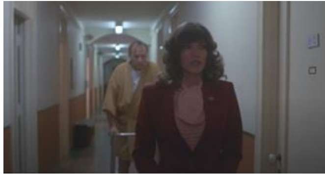
Görsel 8 Hastane koridorundaki korkutucu hasta figürü (Hastane Katliamı - 1982) ( https://ugurfilm3.com/hospital-massacre/ )

Mekânsal olarak ise hasta yatak odası, laboratuvar, muayene odası, arşiv ve şişe odası gibi belli hastane birimleri, mimari ve işlevsel özelliklerinin de etkisiyle korku ve gerilim öğeleri haline gelirler. İçerdiği şeffaf pano nedeniyle hasta hareketlerinin diğer taraftan izlenebildiği ve hasta mahremiyeti ve güvenliğinin ortadan kalktığı muayene odası bu anlamda filmin öne çıkan mekânlarından biridir (Görsel 9). Dar, kemerli, belli seviyeye kadar kırmızı renk duvarlı ve mozaik