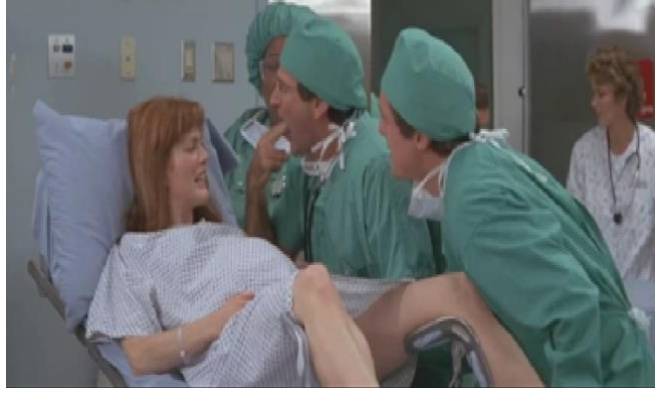
Görsel 1 Yaklaşan doğum anını ve anne adayının durumunu gösteren bir sahne (Nine Months-1995)( https://ugurfilm3.com/nine-months/ )