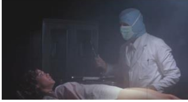
Görsel 6 Maskeli katil doktor figürü (Hastane Katliamı - 1982) ( https://ugurfilm3.com/hospital-massacre/ )

hastanenin kişi üzerinde yarattığı tedirginlik ve korkma duygusunu pekiştirecek şekilde filmde kullanılır (Görsel 6). “Korkutucu tıbbi fotolar, X-ray görüntüleri ve tıbbi cihazlar (iğne, serum, bıçak, bistüri, testere, vb.) gibi aksesuarlardan ketum ve otoriter doktor ve hemşireler ile anormal ve düşman hasta profillerine” (tamamı sargılı insanlar, koridorda destekle yürüyen korkutucu hasta figürü, vb.) kadar tüm sinematik unsurlar hastanelerin ve hastane çalışanlarının gerçek hayatta mevcut otorite ve disipline dayalı yapılarının daha ön plana çıkarılması ve uç noktalarda işlenmesi yoluyla korku ve gerilim yaratma amacıyla kurgulanır ve kullanılırlar (Sipos, 2010: 45) (Görsel 7-8).