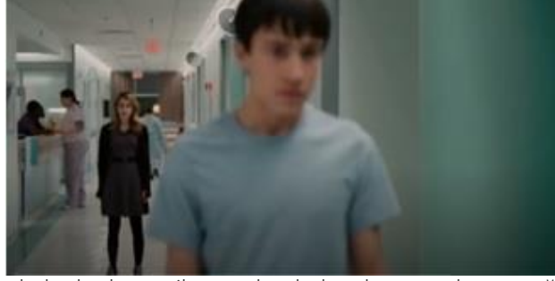
Görsel 21 Ana karakterin okul arkadaşına ilan-ı aşk ederken hastanede tanıştığı kız tarafından görüldüğü sahne (Komik Bir Hikaye - 2010)( https://www.fullhdfilmizlesene.pw/film/komik-bir-hikaye-izle-3/ )