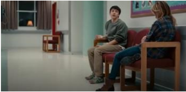
Görsel 19 Renkli duvar ve mobilyalarıyla hastane koridoru (Komik Bir Hikaye - 2010)( https://www.fullhdfilmizlesene.pw/film/komik-bir-hikaye-izle-3/ )