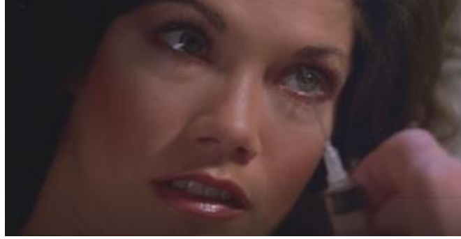
Görsel 7 Tıbbi cihaz olan iğnenin filmde korku unsuru olarak öne çıkarıldığı sahne (Hastane Katliamı - 1982) ( https://ugurfilm3.com/hospital-massacre/ )