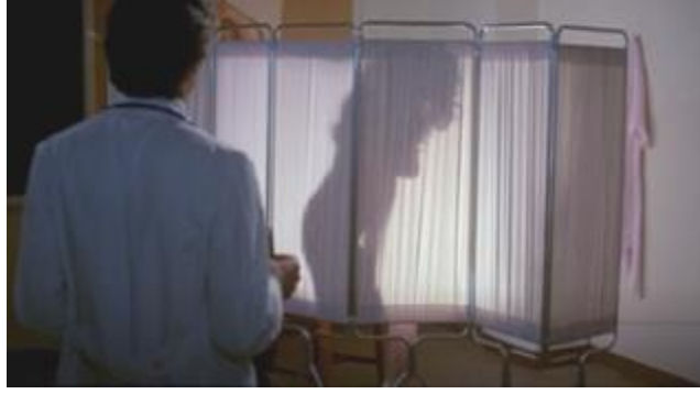
Görsel 9 Muayene odası (Hastane Katliamı - 1982)( https://ugurfilm3.com/hospital-massacre/ )

kaplı zemine sahip hastane koridorları ise tekinsiz bir atmosfer yaratılacak şekilde kullanılarak, insanların yalnızlığı ve çaresizliğini (yaklaşan insan gölgeleri, vb.) vurgulayıp onları kurban olarak gösteren bir sinematografi oluşturulmasına katkı sağlar (Görsel 10).