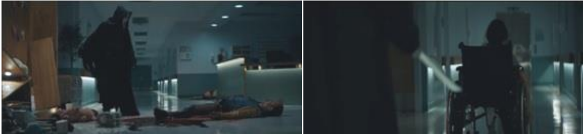
Görsel 5 Scream 5 filmi (2022) ( https://www.fullhdfilmizlesene.pw/film/cigliik-5-izle/ )

Bu noktada, korku filmlerinde hastanelerin ve mekânsal özelliklerinin rolü hususuna dair incelemeyi daha tanımlı ve geniş bir çerçevede yapabilme adına, hastaneler bağlamında sinemada korku öğesi olarak kullanılabilir pek çok mimari ve mekânsal öğeye ve hastaneye özgü aksesuar, mobilya ve tıbbi aletlere yer verilmesi, doktorlar başta olmak üzere hastane personelinin hikayede önemli bir yere sahip olması ve tamamı bir hastanede geçmesi nedeniyle kapsayıcı ve yol gösterici bir örnek olabilecek 'slasher' türü bir korku filmi olan 1982 tarihli Hospital Massacre (X-ray) (Hastane Katliamı) filmi detaylı olarak ele alınacaktır. Hikayenin ana çatkısının oluşturulmasında hastanenin oynadığı rol incelendiğinde ilk dikkati çeken husus, filmin birçok insanın psikolojisinde "hastane ve doktorlara dair mevcut olan paranoyak korkuları büyütüp tekrar öne çıkararak pek çok şiddet sahnesini" içeren bir senaryoya sahip oluşudur (Sipos, 2010: 45). Bu çerçevede tıbbi maske, önlük ve muayene eldiveniyle korkunç bir profil kazandırılan katil doktor figürü, deney fareleri ve insan maketleri gibi unsurların neredeyse tamamı,