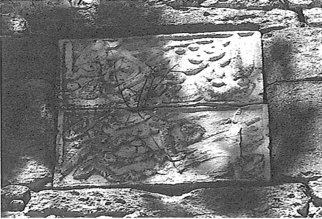
Ek-6: Ali Yardım, Alanya Kitabeleri , (İstanbul: İstanbul Fetih Cemiyeti Yayınları, 2002), s. 112.