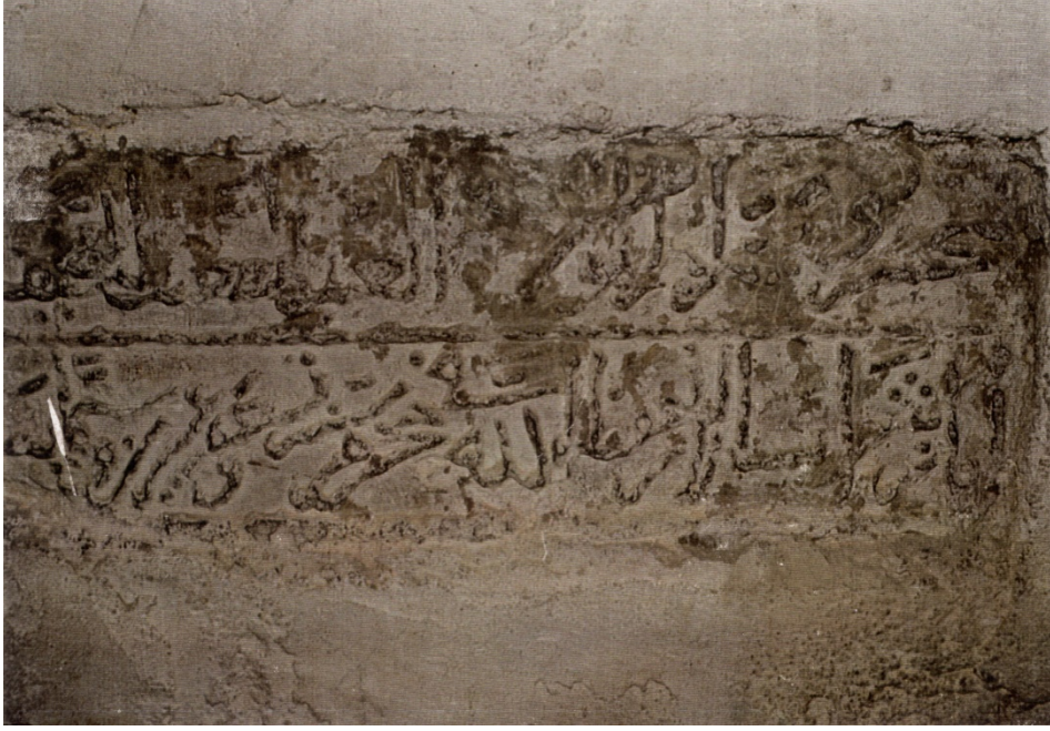
Ek-9: En-nahif Ayaz-ı Şarab-sâlâr afaullah fi Muharrem sene tis'un ve işrine ve sittemie ( 629/1231)