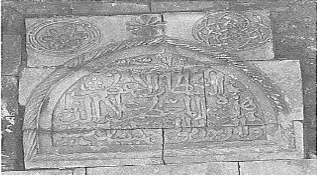
Ek-3: Ali Yardım, Alanya Kitabeleri , (İstanbul: İstanbul Fetih Cemiyeti Yayınları, 2002), s. 107.