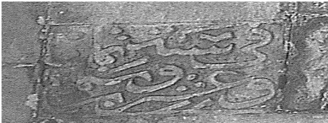
Ek-5: Ali Yardım, Alanya Kitabeleri , (İstanbul: İstanbul Fetih Cemiyeti Yayınları, 2002), s. 108.