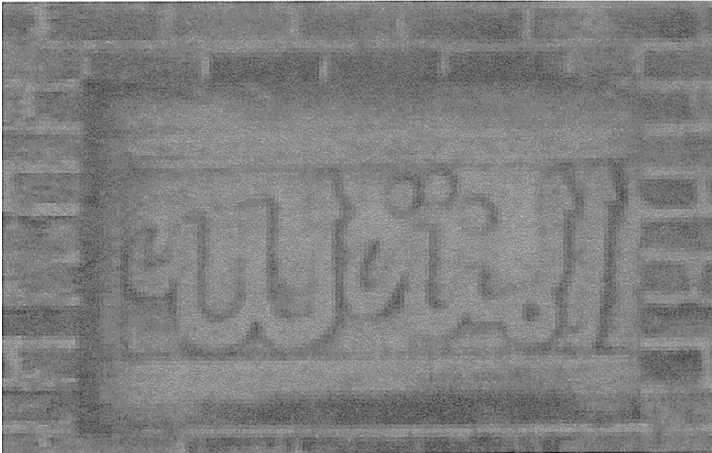
Ek-1: Ali Yardım, Alanya Kitabeleri , (İstanbul: İstanbul Fetih Cemiyeti Yayınları, 2002), s.76.