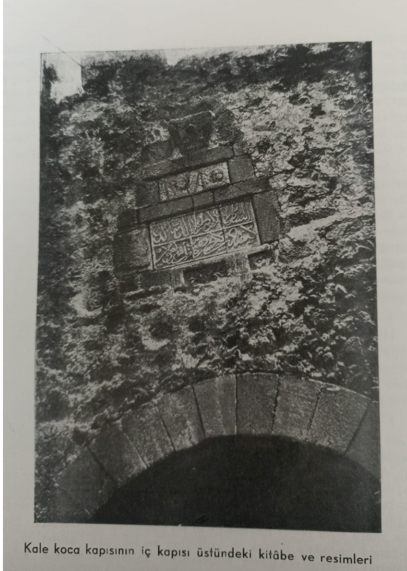
Ek-5c: İ. Hakkı Konyalı, Alanya (Alâtiyye) , (İstanbul:Ayaydın Basımevi, 1946), s. 184.