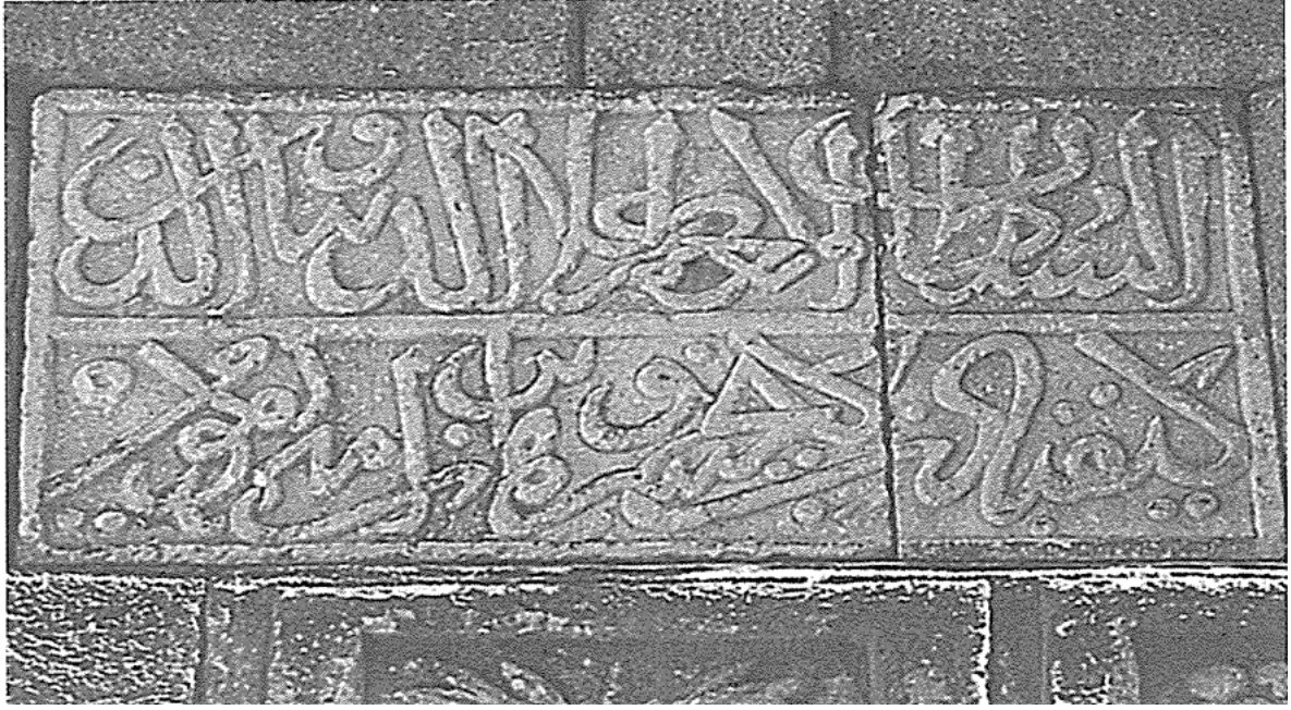
Ek-5a: Ali Yardım, Alanya Kitabeleri , (İstanbul: İstanbul Fetih Cemiyeti Yayınları, 2002), s. 110