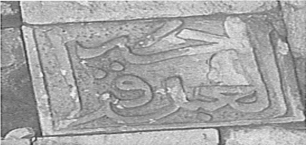
Ek-4: Ali Yardım, Alanya Kitabeleri , (İstanbul: İstanbul Fetih Cemiyeti Yayınları, 2002), s. 107.