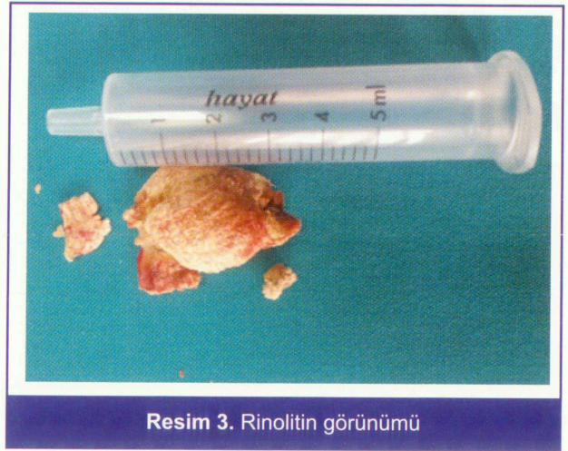
Resim 3. Rinolitinin görünümü

Rinolitın etyopatogenezi tam olarak bilinmemekle beraber, genellikle burun boşluğunda uzun süre kalan, düzensiz yüzeyli veya delikli, organik veya inorganik