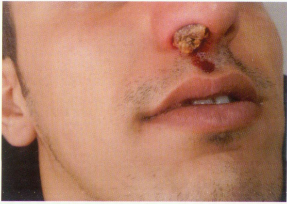
Resim 1. Sağ nazal meada rinolitinin görünümü.

Rinolit ilk kez 1654 yılında Bartholin tarafından tanımlanmıştır 4,5 . Kadınlarda, erkeklere göre daha sık görül- düğü bildirilmiştir. En sık genç erişkinlerde olmak üzere, her yaş grubunda