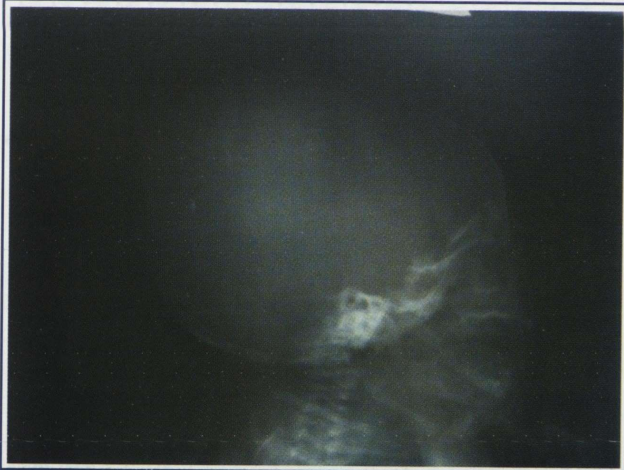
Resim 1. Direkt Kranial Grafi

Bu olguda erken yenidoğan döneminde nadir görülen EDH olgusuna dikkat çekilmek istenmiştir.