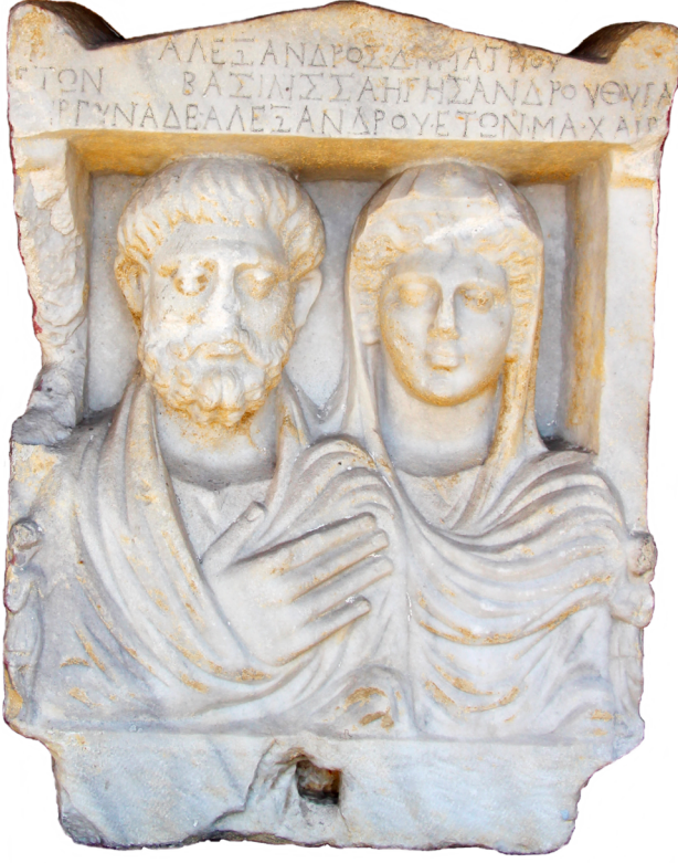
Figür 17 Oikonomos Tertius ve Eşi Oikonomissa Auge'nin Mezar Steli / Grave Stele of Oikonomos Tertius and His Wife Oikonomissa Auge