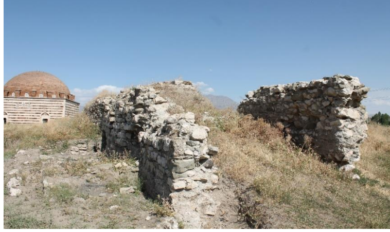
Fotoğraf 1. Ortada Kerpiç Duvar Kalacak Şekilde İçeriden ve Dışarıdan Taş ile Örülen Van Kalesi Varoş Duvarları