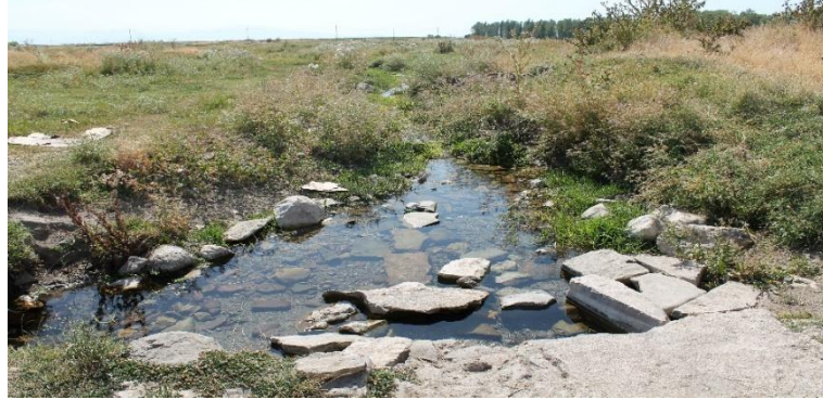
Fotoğraf 3. Van Kalesi Varoşunda Bugün de Görülebilen Bir Su Kaynağı

Safevîler ile devam eden husumet döneminde Osmanlı İmparatorluğu’nun belirli aralıklarla Van kalesinin dış surlarını sürekli denetlediği ve tadilat işlerine devam ettiği anlaşılmaktadır. Nitekim kalenin duvarlarının, hendeklerinin ve top konulan yerlerinin denetlenmesi, muhtemel bir saldırıya hazır hâle getirilmesi noktasında esas olarak Erzurum beylerbeyine, bir sureti de Van beylerbeyine