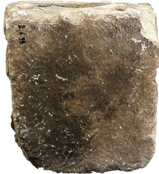
Fig. 5. Sunak (Üst Görünüm)