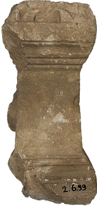
Fig. 3. Sunak (Sol Dar Yüz)

Trebenna 2.6.99 Envanter Numaralı sunađın üst kısmı tarakla düzleřtirilmiř bir yzeye sahipken bütün tahribata rađmen alt kısmında oturtma oyuđu görülebilmektedir (Fig. 5-6).