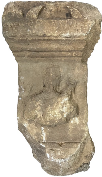
Fig. 1. Sunak (Ön Yüz)

Eserin ön yüzünde kaide bölümü büyük oranda kırılmıştır ve noksandır. Ayrıca sunağın arka yüzü kabaca tıraşlanmış olup burada herhangi bir motif işlenmemiştir (Fig. 2).