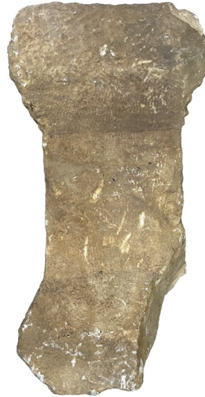
Fig. 2. Sunak (Arka Yüz)

ve Perbaina olarak da adlandırılmıştır. Trebenna, Roma Çağı'nda resmi olarak Lykia Eyaleti sınırlarında bulunmaktayken Doğu Roma İmparatorluk Dönemi'nde kesin olarak bir Pamphylia kentidir (Onur 2005, 7). Tarım terasları, mortarium, orbis, litus, pres yatağı ve şarap işliği gibi kalıntılardan Trebenna'da antikçağda zeytin ve üzüm tarımının yapıldığı, dolayısıyla burasının bir zeytinyağı ve şarap üretim merkezi olduğu anlaşılmaktadır (Bulut 2018, 676 vd.). Trebenna'da çok sayıda lahit ve ostohek tespit edilmiştir (Çevik et al. 2003, 265-267). Ayrıca söz konusu sunağı fotoğraflayan arkeolog Gökhan KAYIŞ'a çok teşekkür ediyorum.