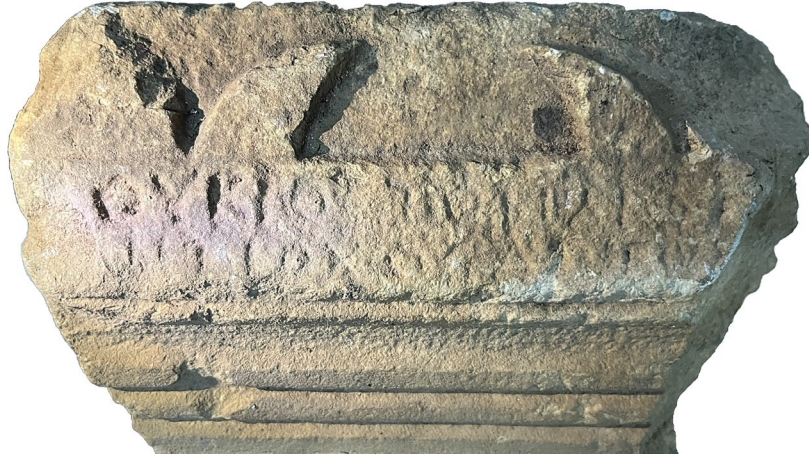
Fig. 7. Sunak (Yazıt)

Ortalama harf yüksekliği 1 cm olan yazıttan anlaşıldığına göre; Trebenna'da yaşayan Loukios adında bir erkek bu sunağı adamıştır. Babasının ismi Trophilos , dedesinin adı ise Antiokhos 'tur. Sunağın adandığı sırada babası veya dedesinin hayatta olup olmadığı anlaşılamamaktadır ancak ortalama bir insan ömrü düşünüldüğünde dedesinin babası Artas 'ın büyük olasılıkla öldüğü söylenebilir. Ayrıca babası, dedesi ve dedesinin babasını isim isim sayması, bu adamın devrinde Trebenna'nın önemli/taninan bir ailesine mensup olduğunu göstermelidir.