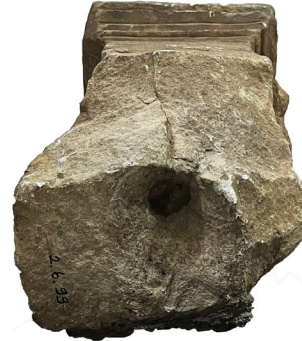
Fig. 6. Sunak (Alt Görünüm)