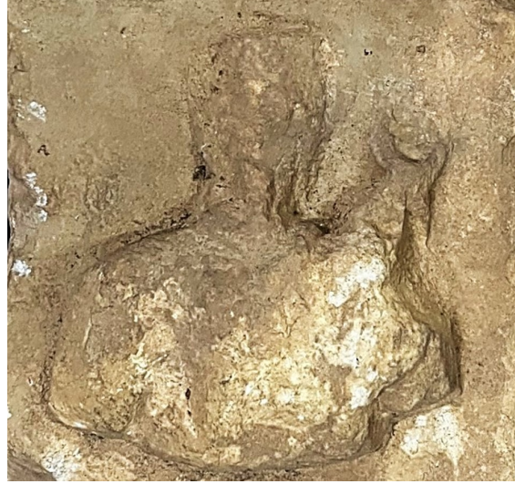
Fig. 8. Sunak (Hermes Büstü)

Trebenna sunağının ön yüz merkezinde bulunan büst 13 cm yükseklik ve 11 cm genişliğe sahiptir. Ancak büst aşınarak büyük oranda belirsizleşmiştir (Fig. 8). Özellikle baş/yüz kısmında büyük tahribat görülmekle beraber alın-burun-çene kısmında dikey düzensiz bir hat izlenebilmektedir. Bunun dışında yüzde seçilebilen herhangi bir uzuv yoktur. Fakat tüm yıpranmışlığına rağmen öncelikle bu büstün geniş omuz yapısıyla eril birine ait olduğunu belirtmek mümkündür. Sunaklarda bu tip eril figürler genelde tanrısal kişilikler olup örneğin Zeus, Helios, Men ve Hermes gibi tanrılara adanmış sunaklar bilinmektedir. Bu bağlamda adandığı tanrının kimliğinin belirlenmesine yönelik olarak tip ve atributları üzerinden muhtemel kimlikleri irdelemek ve böylece asıl kimliği belirlemek faydalı olacaktır.