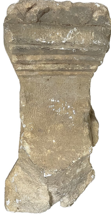
Fig. 4. Sunak (Sađ Dar Yüz)