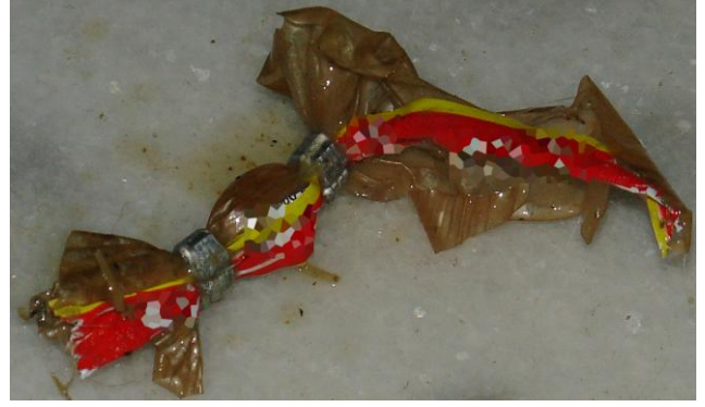
Şekil 2. Uzaklaştırılmış yabancı cismin görünümü. Figure 2. Removed foreign body appearance.

Figure 1. Endoscopic view of the gastric foreign body.