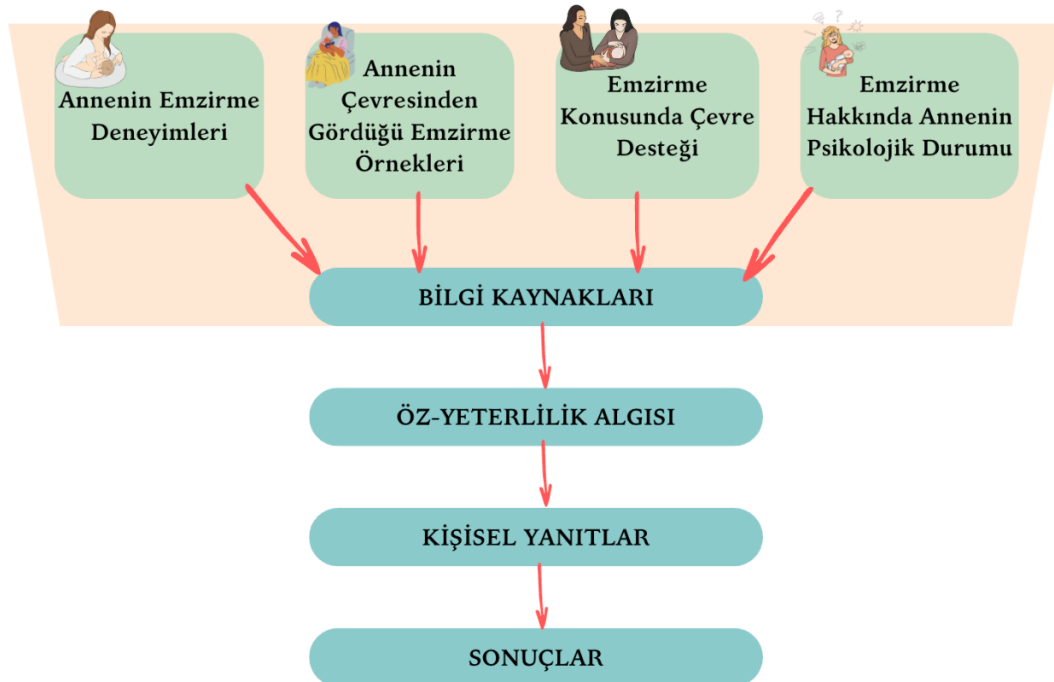
Şekil 1. Emzirme Öz-yeterlilik Kuramı Çerçevesi (9, 10, 13)

Emzirme öz-yeterliliği dört bilgi kaynağından etkilenmektedir (Şekil 1). Bilgi kaynaklarından annenin emzirme deneyimleri; annenin önceki bebeklerini emzirme durumunu ve annenin çevresinden gördüğü emzirme örneklerini; annenin başka bir anneyi emzirirken gözlemlemesini ya da deneyimlerini dinlemesini, emzirme konusunda çevre desteği; annenin ailesi, eşi ve arkadaşlarından ya da sağlık çalışanları tarafından desteklenme durumunu, emzirme hakkında annenin psikolojik durumu; annenin yaşadığı ağrı, yorgunluk, stres, anksiyete veya sütün yetersizliği algısını göstermektedir. Sağlık profesyonelleri öz-yeterliliği geliştirmek istiyorlarsa emzirmeyi etkileyen bilgi kaynaklarına odaklanmalı ve bunlara yönelik girişimlerde bulunmalıdırlar (13,14). Dennis'in tanımladığı emzirme öz-yeterlilik kuramının çerçevesini ise yine dört başlık altında inceleyebiliriz (Şekil 1). Kuramın çerçevesi bilgi kaynakları (annenin emzirme deneyimleri, çevredeki emzirme örnekleri, emzirme hakkında çevre desteği, annenin emzirme konusunda psikolojik durumu), öz-yeterlilik algısı (annenin emzirme hakkında kendine güvenmesi), kişisel yanıtlar (davranış seçeneği, çaba ve süreklilik, düşünceler, duygusal tepkiler) ve sonuçlar (emzirmeyi başlatma, performans, sürdürme) olarak ele alınmaktadır.