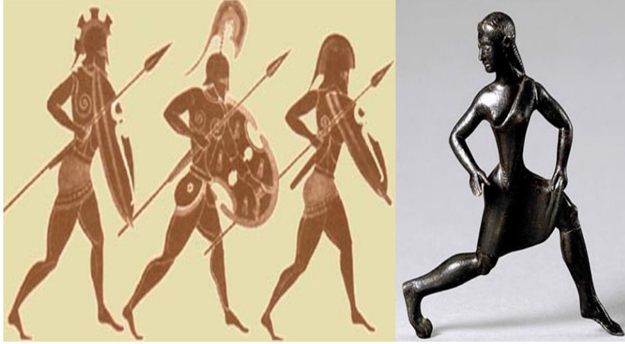
Görsel 2: Lykurgos'un inşa ettiği güçlü ve atletik beden formlarından örnekler. Sağda Spartalı bir kadın. Solda Spartalı erkekler (Pomeroy, 2002, s. 13).

Lykurgos'a göre Spartalı olan her bir vatandaş devletin yapısına ve iktidarın ihtiyacına göre yetiştirilmeliydi. Aksi halde düzen sağlanamazdı. Plutarkhos tarafından aktarılan Lykurgos'un yasalarına göre, Sparta'da bir çocuğu olan baba onu büyütmede serbest değildi. Öyle ki çocuk daha doğar doğmaz Leskhe denilen bir yere götürülür ve burada topluluğun en yaşlıları bulunurdu. Bu yaşlılar yeni doğan çocuğu kontrol eder, kusursuz ve gürbüz bulurlarsa büyütülmesini emreder ve dokuz toprak payından birini ona ayırırlardı. Ama çocuk sağlıklı ve kusurluysa Taygetos dağında yer alan Apothetas uçurumuna bırakılırdı. Doğuştan kusurlu ve sorunlu olan çocuğun yaşamaması hem kendisi için hem de devlet için daha yararlı görülmekteydi. Ayrıca kadınlar yeni doğan çocukların sağlıklı olup olmadıklarını anlamak için onları su yerine, şarapla yıkarlardı. Yıkama esnasında saralı, hastalıklı olan çocuk ya saf şarabın etkisiyle kıvranıp ölür, ya da sağlam olanlarsa bundan yararlanır, daha gürbüz olurlardı. Öyle ki bir çocuk daha bebek yıllarında dahi bezlerle sarıp sarmalanmaz, çıplak olarak elleri ve kolları serbest bırakılırdı. Ayrıca çocukları yiyecek ayırt etmemeye, nazlanmamaya, karanlıktan ve yalnızlıktan korkmamaya, ağlayıp bağırılardan kaçınmaya alıştırlırlardı (Plutarkhos, Lykurgos'un Hayatı, s. 39).