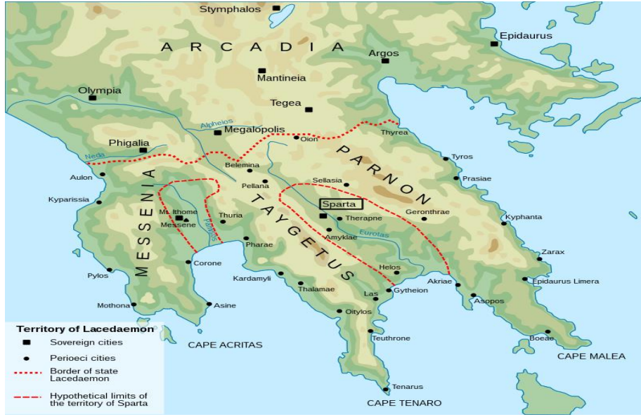
Görsel 1: Sparta topraklarını gösteren harita

tutumu, çoğunlukla fethedilen halkları kendi toplulukları içinde özümseyen diğer şehir-devletlerinin uygulamalarından tamamıyla farklıdır (Castle, 1961, s. 15).