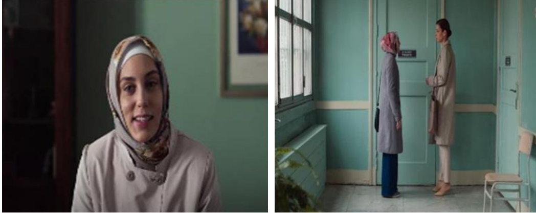
Görsel 3: Meryem Karakterine Ait Görüntüler

Dizide muhafazakâr kadın olarak gösterilen bir diğer kişi de imamın kızı olan Hayrunnisa karakteridir. Hayrunnisa üniversite okuyan, ait hissetmediği bir hayatı sırf ailesini üzmemek adına yaşamaktadır. Özgür ruhlu ve başına buyruk olduğu halde bunları ailesine belli etmeden yaşayan Hayrunnisa ailesiyle yaşadığı mahalleye döndüğünde başını kapatır ve muhafazakâr bir genç kız rolüne bürünür. Diğer taraftan anne ve babasına düşkündür ve onları üzmemek ister. Başını kendi isteğiyle örtmediği için üniversite okuduğu yerde başörtüsünü çıkarıp, barlara gider, alkol tüketir. Babasının imam olması nedeniyle muhafazakâr bir görünüme sahip olması gerektiği baskısı ile başını örtse de yaşadığı ikili hayatla gerçekte muhafazakâr olmadığı anlaşılan eşcinsel bir kadın olarak konumlandırılmıştır.