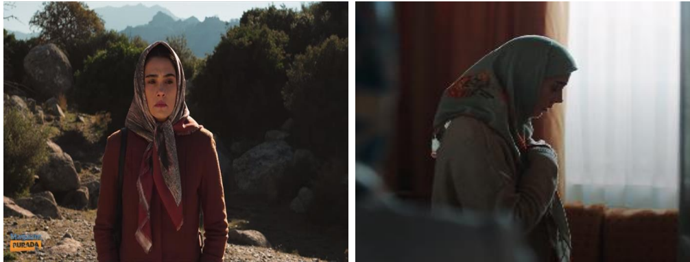
Görsel 6. Ruhiye Karakterine Ait Görüntüler

Dizideki bir başka muhafazakâr kadın da Meryem'in yengesi Ruhiye'dir. Ruhiye namaz kılan, yaşadığı psikolojik sorunlar nedeniyle sürekli ağlayan, depresif ve içine kapanık, kendine fiziksel zarar vermeye çalışan, intihara meyilli, devamlı uyuyan, pek konuşmayan, tepkisiz, çocukken tecavüze uğramış ve o travmayı atlatamamış, monoton bir görüntüsü olan, çocuğunu seven ama bunu pek belli edemeyen sessiz, sakin bir anne olarak konumlandırılmıştır.