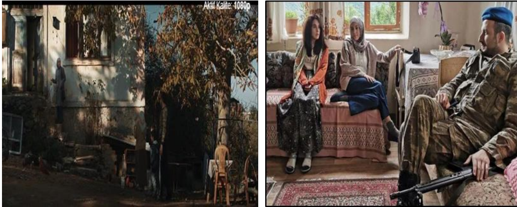
Görsel 2. Hayrunisa Karakterinin Evinin İç ve Dış Görüntüsü