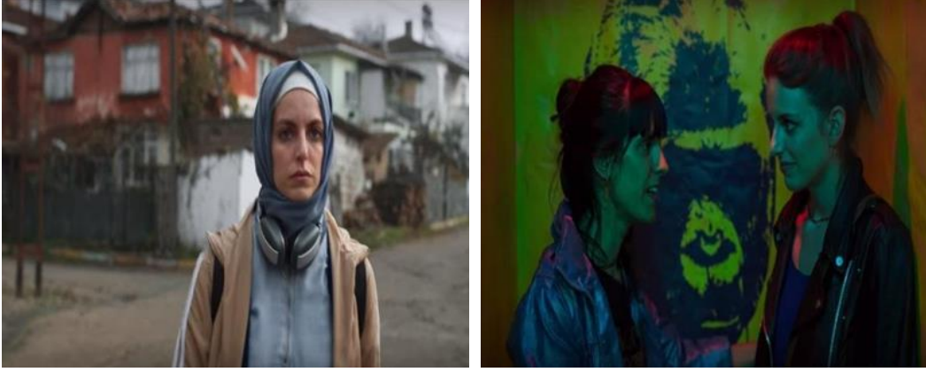
Görsel 4. Hayrunnisa Karakterine Ait Görüntüler

Dizideki bir diğer muhafazakâr kadın ise avukat Gülbin'in ablası Gülan karakteridir. Muhafazakâr ailenin büyük kızıdır. Başörtüsü takan Gülan, sigara içen, gergin ve saldırgan bir kadındır. Özellikle aile içinde hırçınlığı ve saldırganlığı ile herkesi sindirmeye çalışmaktadır. Zengin eşyle birlikte ailesine üstün gelmek isteyen Gülan bağırır-çağırır agresif bir kadın imajına sahiptir.