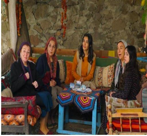
Görsel 9. Dizide Yer Alan Muhafazakâr Kadın Oyunculara Ait Görüntüler

Dizide muhafazakâr kadınlar oldukça geleneksel, muhafazakâr yaşam tarzını yansıtan, kırsal kesim kadın imajına uygun kıyafetler ile konumlandırılmışlardır. Bu imaj kırsal kesimdeki hayata oldukça uygundur ve bütünleştirilmiştir. Dizideki kadın karakterler; yaşlarına uygun olarak, etek, yelek, hırka, boydan elbise şeklinde giyinmekte ve saçlarına çoğunlukla yazma takmaktadırlar. Kadın karakterlerin çoğunun başörtüsü taktığı, uzun elbise ve etekler giydikleri, genellikle de pastel tonları tercih ettikleri görülmektedir. Abartıdan uzak, sade, etnik desenli, kapalı, geleneksel Türk köy yaşamına uyan rahat kıyafetler ile kadın karakterlerin yaşam biçimleri doğal ve samimi bir şekilde aktarılmaktadır.