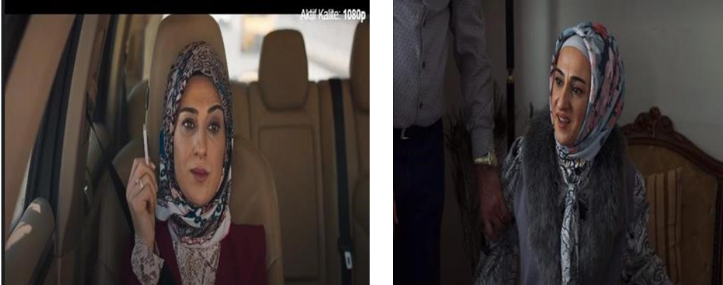
Görsel 5. Gülan Karakterine Ait Görüntüler

Dizideki bir başka muhafazakâr kadın da Meryem'in yengesi Ruhiye'dir. Ruhiye namaz kılan, yaşadığı psikolojik sorunlar nedeniyle sürekli ağlayan, depresif ve içine kapanık, kendine fiziksel zarar vermeye çalışan, intihara meyilli, devamlı uyuyan, pek konuşmayan, tepkisiz, çocukken tecavüze uğramış ve o travmayı atlatamamış, monoton bir görüntüsü olan, çocuğunu seven ama bunu pek belli edemeyen sessiz, sakin bir anne olarak konumlandırılmıştır.