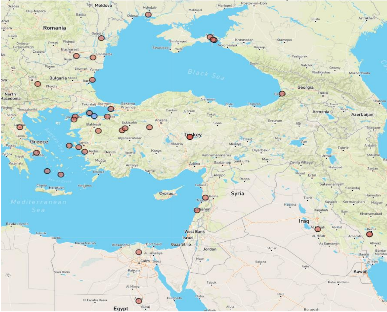
Fig. 1. Kyzikos sikkelerinin define ve kazı buluntularının yayılım alanı ( https://nomisma.org/map/cyzicus erişim tarihi: 31.08.2024)

Kyzikos Kenti'nin elektron stater ve hektelerinin , başta Karadeniz kıyı kesimleri olmak üzere birçok bölgede dolaşımda olması, daha çok onun bölgelerarası ticari işlemlerde kullanıldığını açıklar 17 . Ancak sadece ticari faaliyetlerde değil paralı askerlerin maaşlarının ödenmesi gibi devlet faaliyetlerinde kullanılmış olması muhtemeldir. Bulunduğu bir kaç definde Pers dareikoslarıyla birlikte yer alması 18 , bu görüşü güçlendirir 19 . Dareikos ve Kyzikenelerin yakın değerinde olmaları da bazı dönemlerde, birbirlerinin yerine kullanılma ihtimalini artırır. Buradaki temel belirleyici nokta, bir dareikos 20 ile bir kyzikenenin paralı bir askerin bir aylık maaşına denk gelmesidir 21 . Arkeolojik buluntular, bu sikkelerin Antik dünyanın büyük bir bölümüne yayıldığını kanıtlamaktadır (Fig. 1) 22 .