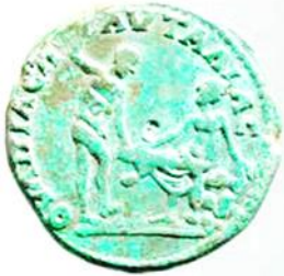
Fig. 10. Pautalia kent sikkesinin arka yüz betimi. Menadı dansa davet eden Satyros (German özel koleksiyonu. Habetzeder 2021:419-463, Fig.3.)

kulplu amphoradan kantharosa içki dökmektedir. Benzer betimlere Hadrianoi kent sikkelerinde de rastlanmaktadır 180 . Üçüncü grubu oluşturan 43-45 no'lu sikkelerde genç Satyros sağ elinde ton balığı tutar şekilde betimlenmiştir 181 . İlk iki grupta görülen diz çökme hareketi burada da görülmektedir. Baş, kollar ve bacaklar ile at kuyruğu profilden göğüs cepheden verilmiştir. Arkaik tipi boncuk boncuk verilmiş saçlarının altından sivri at kulakları fırlamıştır. 46 no'lu sikke -staterde ise yere oturmuş bir Silenos görülmektedir. Kucağında bir figür (bebek Dionysos?) görülmektedir. İki elinde birer nesne (çingirak?) vardır 182 . Roma Dönemi'nde genç Satyrosları, eşlikçi Pan, ağır sporların tanrısı Herkül/Herakles veya bir Menad ile beraber görmek mümkündür ( 17 ve 47 no'lu sikkeler ).