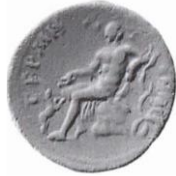
Fig. 6. Kayaya oturan Dionysos ile panter (SNG France: 976)

Tahtta oturup ayağının önündeki panteri besleme konusu uzun bir dönem favori betim olarak işlenmiştir ( 8-11 no'lu sikkeler ). Diğer Mysia kentlerinde de benzer ikonografi kullanılmıştır 120 . Örneğin, Marcus Aurelius dönemi Pergamon sikkesinde taht yerine kayaya oturup panterle oynayan Dionysos betimi görülmektedir ( Fig. 6 ). Bunun dışında baş tanrısı Dionysos olarak bilinen Teos kent sikkesinde Tanrı ayakta durmuş yanında eşlikçisi panter ile oynamaktadır ( Fig. 7 ).