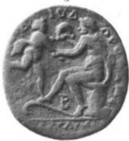
Fig. 9. Satyros'un önünde danseden çocuk Dionysos (BMC Mysia: 150, Kat. No. 306, Pl. XXX.3)

Hellen mitolojisinde Tanrı Dionysos ile yakından ilişkili olarak görülen bir diğer varlık Satyr ve Silenlerdir. Satyr ve Silenler, yarı insan ve yarı hayvan olarak betimlenen doğayı simgeleyen cinlerdir 156 . Bu yaratıklar erken dönemlerde, at kuyruğu ile at kulakları olan kıllı ve ithyphallic bir betimle kaba insanlar olarak biçimlendirilmişlerdir. Bazı mitologlar, Satyrlerin birkaç, bazıları ise yalnız bir kişi olduğunu yazar 157 . Hellenistik Dönem'de keçi bacaklı ve kuyruklu erkekler olarak temsil edildiler. Tek bir efsanevi varlık için iki farklı ismin kullanılması ile ilgili üç farklı açıklama getirilmiştir. Birinci açıklama aynı efsanevi varlığa Asya'daki Hellenlerin Silen, Yunan anakarasında yaşayan Hellenlerin Satyr ismini verdiği yönündedir. Diğer teori ise Silenlerin yarı at ve Satyrlerin yarı keçi olmalarından kaynaklı farklı isimlendirilmeleridir. Kimi yorumculara göre ise Satyrler ihtiyarlayınca Silen adını alırlar 158 .