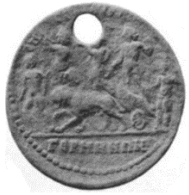
Fig. 8. Dionysos Alayı (BMC Mysia: 67, Cat. No 19, Lev. XVI.7)

Faustina'nın tasviri 123 vardır ( 16 no'lu sikke ). Benzer betim, Marcus Aurelius ve daha sonra Commodus 124 sikkesinde de nakşedilmiştir 125 . Bu sikkelerden hareketle Commodus Dönemi'nde Kyzikos'ta Kore'nin kült törenleriyle, Dionysos'un cümbüşlü kutlamalarının ortak yapıldığı düşünülebilir 126 . Kyzikos'a komşu Pergamon kent sikkelerinde de aynı sahneyi görmek mümkündür. L. Verus Döneminde darp edilen sikkede panter süren Dionysos betimi kullanılmıştır 127 . Septimus Severus