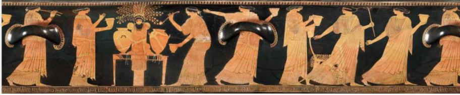
Fig. 2. Stamnos üzerinde ağaç kütüğü şeklindeki Dionysosa tapınım sahnesi (MFA Boston erişim numarası: 90.155a)

Dionysos'un adı iki parçadan oluşmuş birleşik bir kelimedir (Dios+Nysos) ve "Nysa'nın tanrısı" anlamına gelir 47 . Euripides'in "Bakkha'lar" adlı oyununda bu tanrı, Dionysos ve Euhios diye çağırılır 48 . Bromios (Gümbürdeyen, kahkahalar atan tanrı) 49 ; Bakkhos ise "Gürültücü" anlamına gelir. Dionysos, her ne kadar şarap tanrısı olarak bilinse de gerçekte bereket başlatılan bir doğa tanrısıdır. Köken olarak bir bitki (ağaç) tanrısıdır. Bu sebeple Dionysos'a en çok çiftçilerin saygı göstermesi anlaşılır bir durumdur. Bir ağaç tanrısı olarak Boeotia'da tapınılan bu tanrı, ağacın içindeki Dionysos olarak biliniyordu. O, elmanın ve incirin bulucusuydu. Şarap tanrısına atfedilen unvanlardan biri dentrides (yeni tomurcuklanan ağaç) idi 50 . Magnesia'da ise onun rüzgârdan dalları kırılmış bir çınar ağacında yaşadığına inanılırdı.