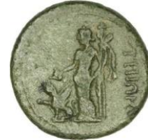
Fig. 7. Panter ile Dionysos (RPC I: 2515)

Dionysos'un sadece kültürel betimleri değil, şenlikleri (alayları) de Kyzikos sikkelerine yansımıştır. Dionysos'un Hint Zaferi'ni betimleyen tüm tasvirler imparatorluk dönemine ait gibi görünmektedir. Ancak hikâyenin en azından MÖ 3. yüzyılın başlarından beri bilindiği ve Ptolemaios Philadelphos'un İskenderiye'deki pompe 'sinin (yaklaşık MÖ 279-270) en önemli olaylarından biri olduğu görülmektedir. Bu nedenle, Hint Zaferi tasvirinin daha erken tasvirlerinin en azından Hellenistik Dönem'de var olduğunu düşünmek mantıklıdır 121 . Commodus Dönemi'ne tarihlenen iki tür homonoia sikkesinin ( 15 no'lu sikke ) arka yüzlerinde Dionysos alayı canlandırılmıştır 122 . Tanrı Dionysos'un alayının geçiş sahnesinde, ilişkili olduğu diğer tanrı ve tanrıçaların yanında Satyros ve menad gibi eşlikçilerine yer verilmiştir. Sahnede elinde bir meşaleyle Kore veya Demeter İki kentaurosun çektiği bigada gösterilmiştir. Sahnede ayrıca Tanrı Eros bulunmaktadır. Onu, sağ eliyle bir kalathosu yukarıya kaldırmış olan Silenos takip eder. Resmin arka planında iki Kentauros arasında solda tympanonlu bir menad, sağda ise çifte flüt (dioulos) çalan, boynuzlu bir Satyros bulunmaktadır.