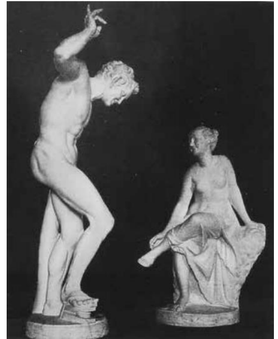
Fig. 11. Menadı dansa davet eden Satyros Heykeli (Klein, 1909: Fig. 10)

söyleyen ilk kişidir 183 . W. Klein ayrıca, söz konusu heykel kümesinin orijinalinin de, sikkenin basıldığı kentte, yani Kyzikos'ta bulunduğunu iddia eder. Ancak M. Koçak bu öneriye karşı çıkar. Aynı betimin aynı