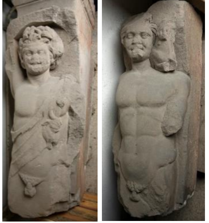
Fig. 4-5. Kyzikos Tiyatrosu'na ait Satyros betimleri (İstanbul Arkeoloji Müzesi)