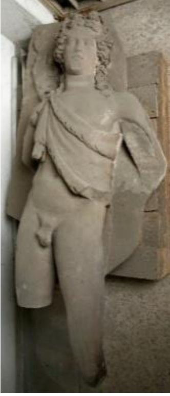
Fig. 3. Kyzikos Tiyatrosu'na ait genç Dionysos (İstanbul Arkeoloji Müzesi Env. No: 94 Kat. No. 637)

Reşit Mazhar Ertüzün, Kyzikos şehir harabeleri arasında pek çok Dionysos betimli kabartma ve heykellerin bulunduğunu söylemektedir. Bunlar arasında en göze çarpanı İstanbul Arkeoloji Müzesi'nin envanterinde 94 envanter numaralı 637 katalog numaralı yüksek kabartmalı eserdir 97 . Kyzikos Tiyatro yakınında bulunmuş MS 2 veya 3. yüzyıla tarihlenen iki adet sütunda yüksek kabartma olarak Satyros figürleri bulunmaktadır. Roma Dönemi Kyzikos Tiyatrosu'na ait genç Dionysos yüksek kabartması (Fig. 3) ve Satyros betimleri de (Fig. 4-5) İstanbul Arkeoloji Müzesi envanterinde bulunmaktadır.