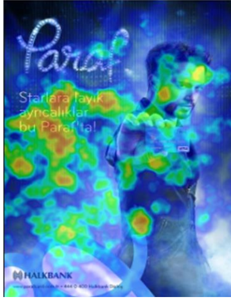
Görsel 2. Tüketici Isı Haritası (İkinci Reklam)