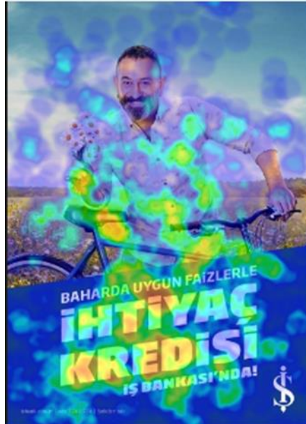
Görsel 1. Tüketici Isı Haritası (Birinci Reklam)

İkinci görselde Murat Boz’un yer aldığı Halk Bankası afişi gösterilmektedir. Isı haritası incelendiğinde bu reklamda da yazılı kısım tüketiciler tarafından en fazla dikkat edilen bölüm olmuştur. “Starlara layık ayrıcalıklar bu Paraf’ta” mesajı en çok dikkat edilen kısım olması banka açısından olumludur.