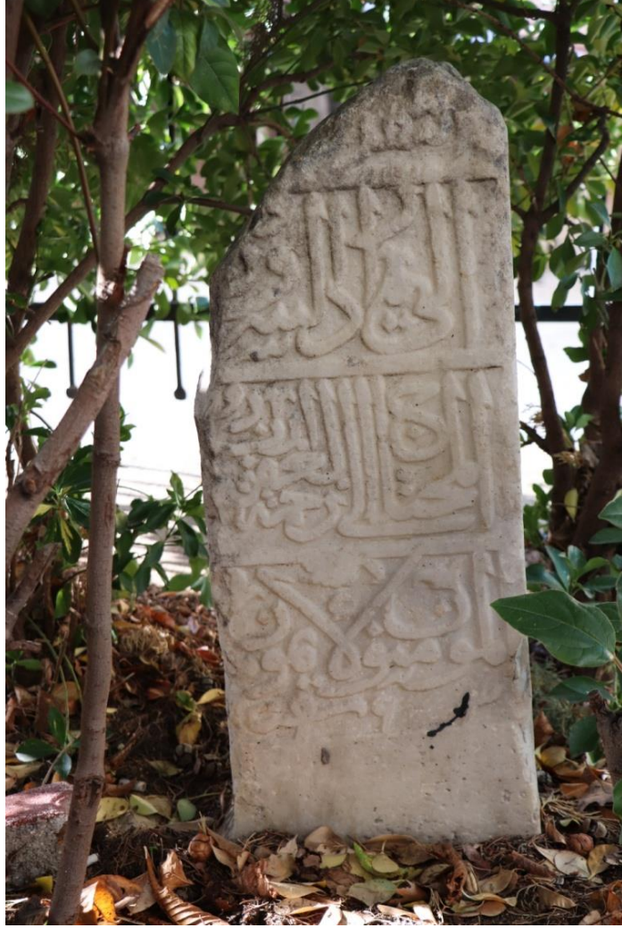
Resim 12: İkinci Mezar Taşı