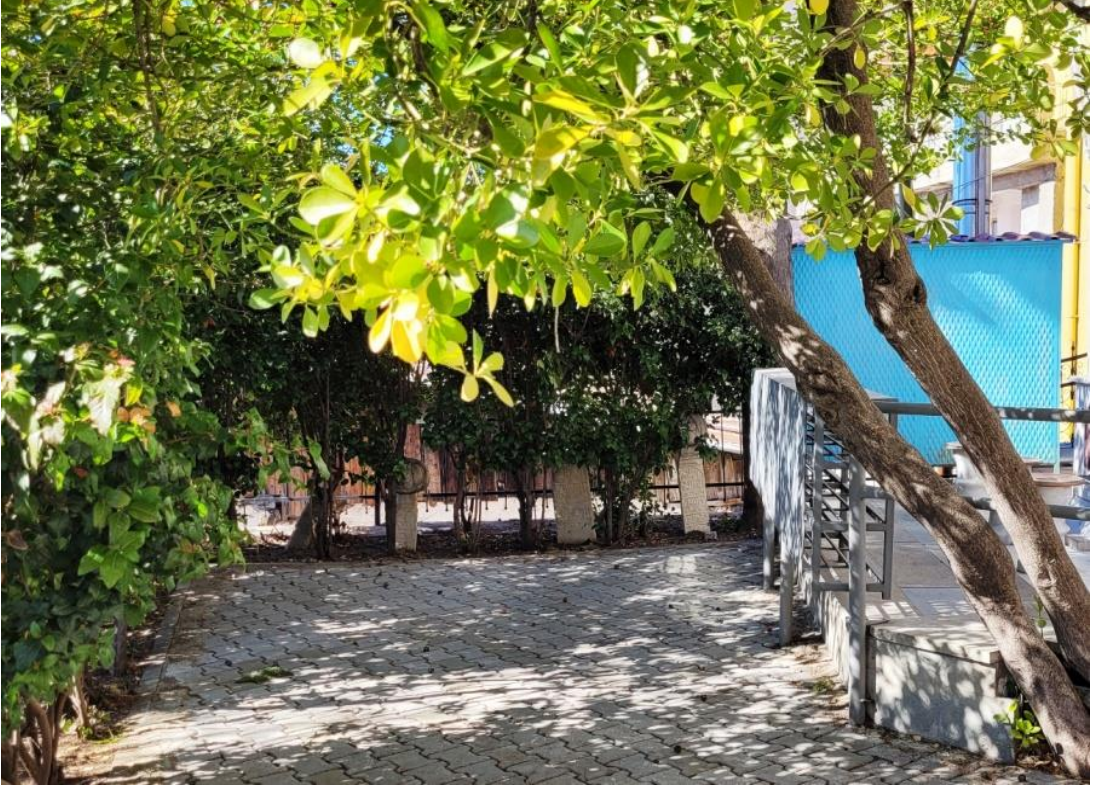
Resim 7: Sefer Ağa Camii'nin Haziresindeki Kitabeli Mezar Taşlarının Bugünkü Konumu