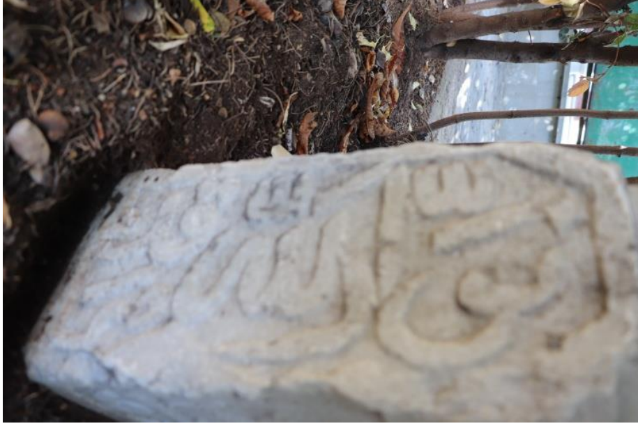
Resim 15: Üçüncü Mezar Taşının Diğer Yüzü