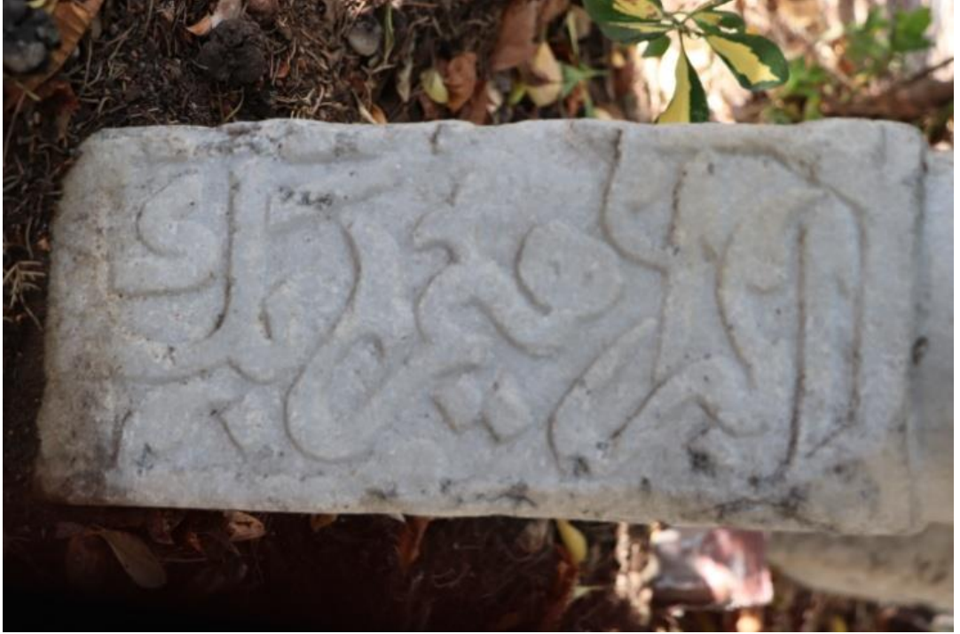
Resim 14: Üçüncü Mezar Taşının Diğer Yüzü

Süsleme Özellikleri: Bir baş şâhidesi olan ve dikdörtgen prizma formundaki mezar taşında burma sarıklı kavuk türünde bir başlık kullanılmıştır. Başlık üzerindeki iri destarlar yukarıdan aşağıya çapraz olarak atılan ikinci sıra destarlarla sarılmıştır (Bkz., Resim 13). Şâhide yüzeyindeki kitabeler dikey yönde gelişen satırlar halinde sülüs hatla ve kabartma tekniğinde yazılmış olup her biri yine dikey yönde gelişen dikdörtgen formlu kartuşlar içine alınmıştır. Harflerin boşlukları, stilize şekiller ve yapraklarla doldurulmuştur. Özellikle İbrahim ismindeki mim harfinin kuyruk kısmı ile ye harfinin üstünün rumî yaprak motifi ile tezyin edilmiş olması, dikkat çekicidir (Bkz., Resim 14 ve Resim 15). 43