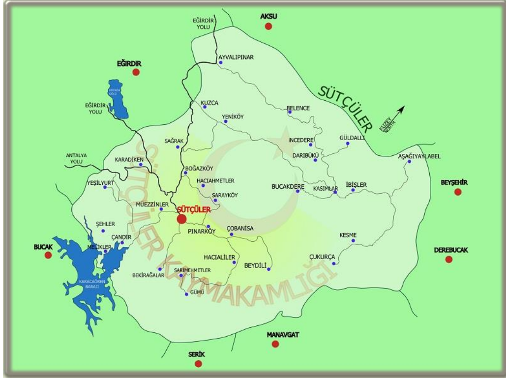
Sütçüler İlçe Haritası

da halkının İstanbul, Ankara ve Eskişehir gibi büyük kentlerde seyyar sütçülük ve süt ürünleri pazarlamacılığı yapmasından dolayı Sütçüler olarak değiştirilmiştir. 7 Daha önce Eğridir kazasına bağlı olan Sığırlık (Yeşilyurt) ve Selimler köyleri de, yeniden Sütçüler ilçesine bağlanmıştır. 8 Günümüzde Sütçüler ilçe merkezine bağlı 7 mahalle ve 30 tane de köy yerleşimi bulunmaktadır. 9