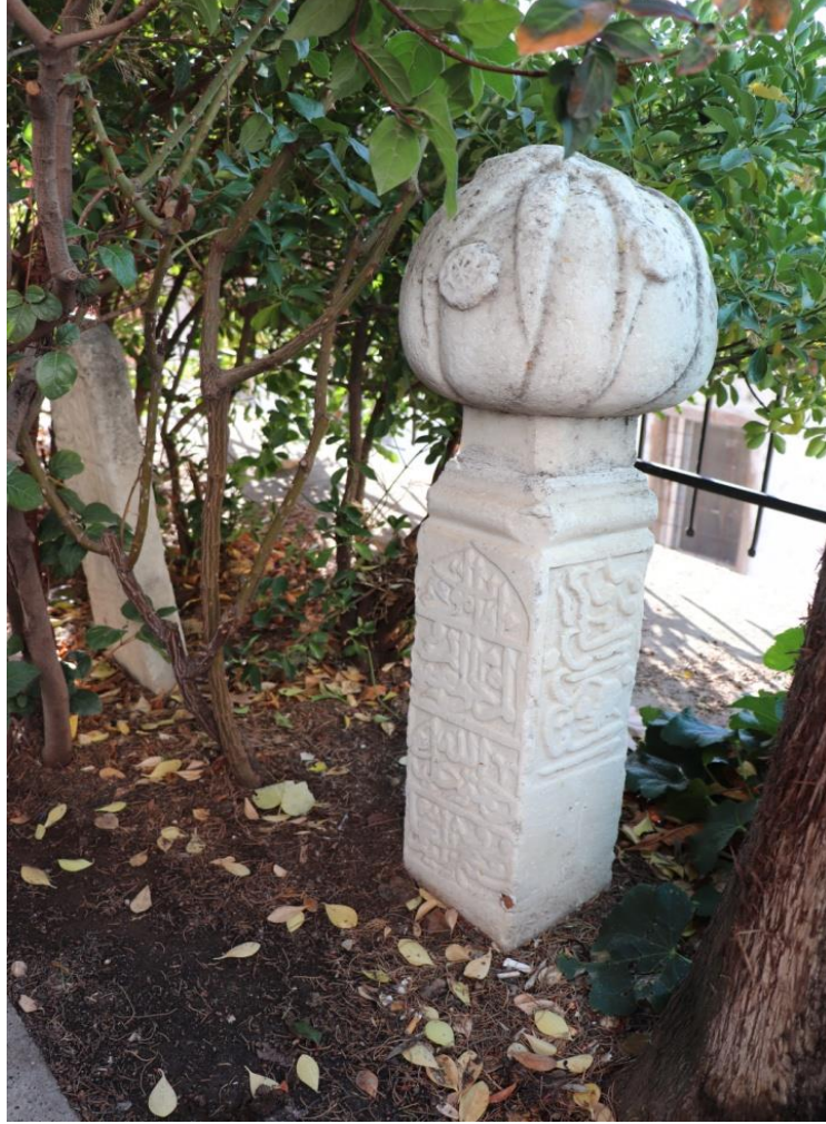
Resim 9: Birinci Mezar Taşı'nın Ön ve Yan Yüzü