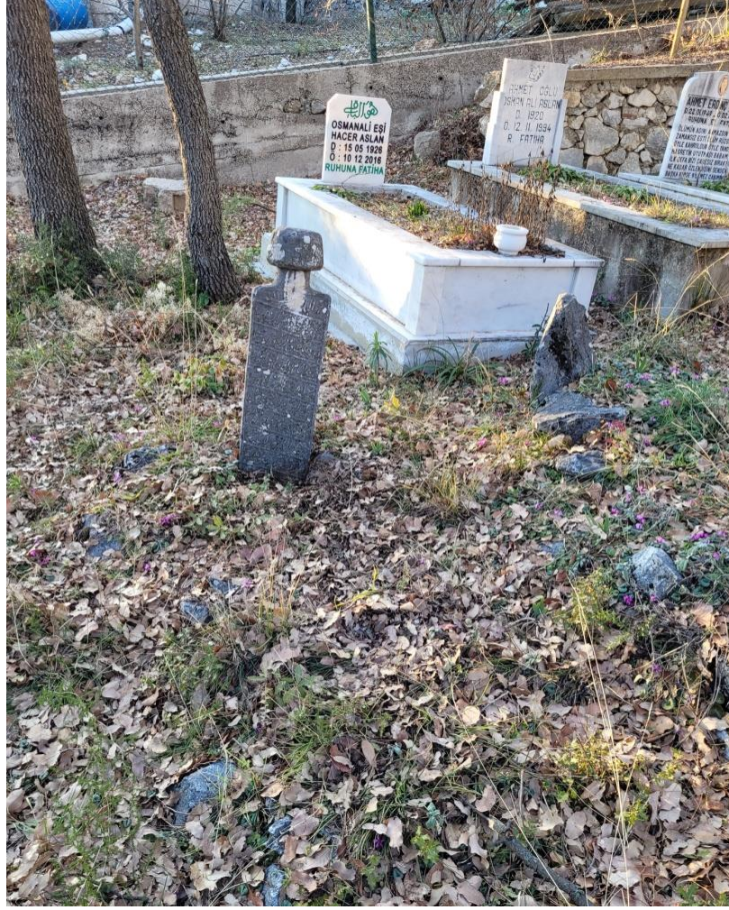
Resim 6: Kitabeli Mezarın Bugünkü Durumu