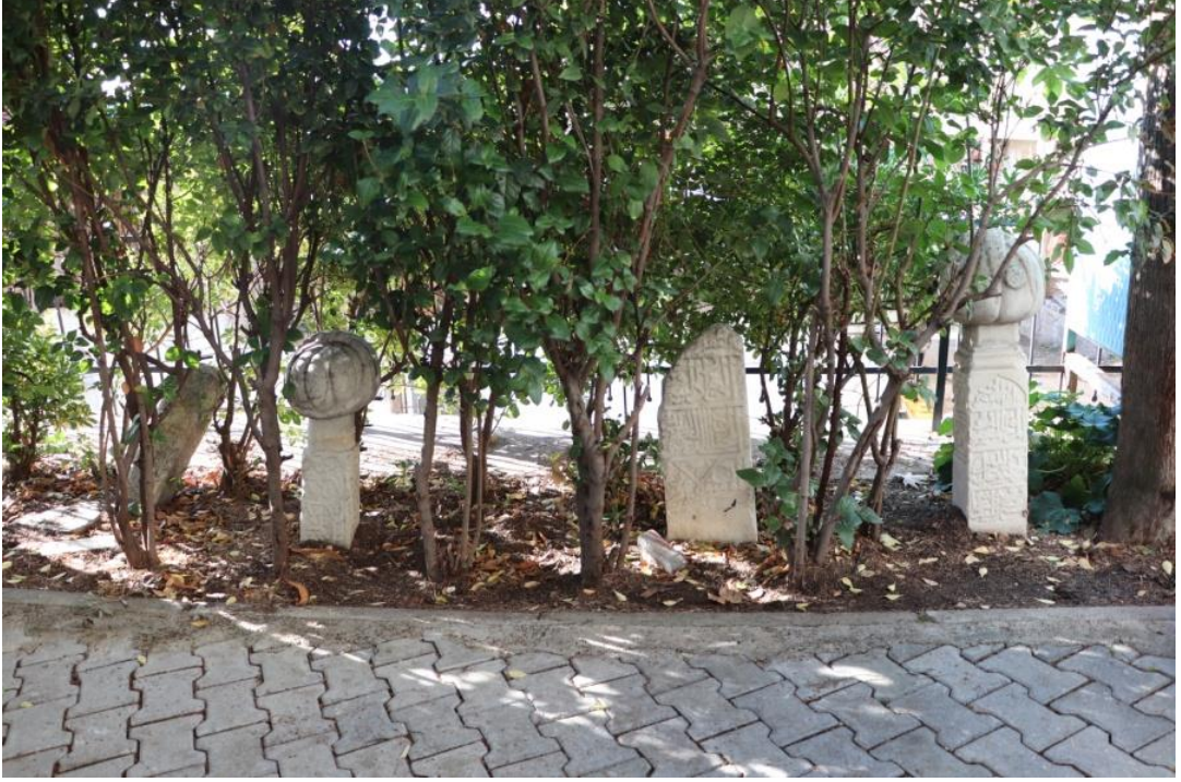
Resim 8: Sefer Ağa Camii Haziresi'ndeki Kitabeli Mezar Taşları