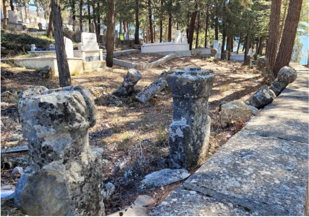
Resim 1: Musalla Mezarlığı'ndaki Sefer Ağa Camii Haziresinden Taşınan Bazı Kavuklu ve Fesli Mezar Taşları

1940'lı ve 1970'li yıllarda ilçe merkezindeki Sefer Ağa Camii Haziresi'ndeki mezar taşları da, bu Musalla Mezarlığı'na taşınmıştır. Taşınan birçok mezar taşı zamanla tahrip olmuş ve yeni mezarlık alanına gelişi güzel bırakılmıştır. Günümüzde mezarlığın ortasından geçen yolun üzerinde bulunan giriş kapısının hemen iç kısmındaki yeni mezarlık çeşmesinin alt taraflarında bu taşınan mezar taşlarının bazılarını rastlamak mümkündür. Bunlar küfeki taşından yapılmış sarıklı ve fesli mezar taşları olmakla birlikte, üzerlerinde herhangi bir yazı veya kitabe bulunmamaktadır. Bazılarının üzerinde Hüve'l-bâkî gibi yaygın kullanımı olan ibareler ve ölüm tarihini belirten rakam ve yazılar vardır. Ancak çoğu okunamaz durumdadır. Birçoğu zamanla tabiat ve insan faktörünün olumsuz etkilerinden dolayı asıl formunu kaybetmiş, tahrip olmuş veya son yıllarda burada yapılan yeni mezarlar arasında kaybolup gitmiştir (Resim 1).