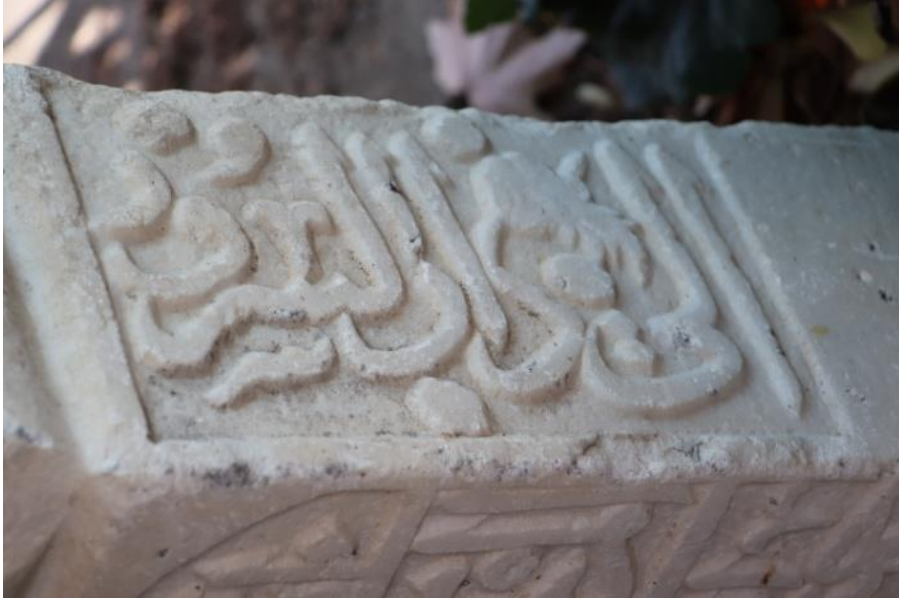
Resim 10: Birinci Mezar Taşının Yan Yüzü

Süsleme Özellikleri: Bir baş şahidesi olan ve dikdörtgen prizma formundaki mezar taşında burma sarıklı kavuk türünde bir başlık kullanılmıştır. Üzerindeki destarların çift kat olarak tasarlandığı başlıkta destarlar arasında iki adet gül motifi yerleştirilmiştir. Yatay yönde gelişen satırlar halinde sülüs hatla ve kabartma tekniğiyle yazılmış olan ön yüzeyindeki kitabede serlevha ibaresi sivri kemer formundaki bir kartuş içine alınmışken, diğer satırlar yatay yönde gelişen dikdörtgen formlu kartuşlar içine yerleştirilmiştir. Şâhidenin dikey yönde gelişen tek satır halinde sülüs hatla ve kabartma tekniğiyle yazılmış olan yan yüzeylerindeki kitabeler ise yine dikey yönde gelişen dikdörtgen formlu bir kartuş içine alınmıştır (Bkz., Resim 10 ve Resim 11). Kitabede yazıların boşluk kısımları ve bazı harflerin kuyruk veya üst tarafları stilize yaprak, lale veya çiçek motifleri ile doldurulmuştur. 39