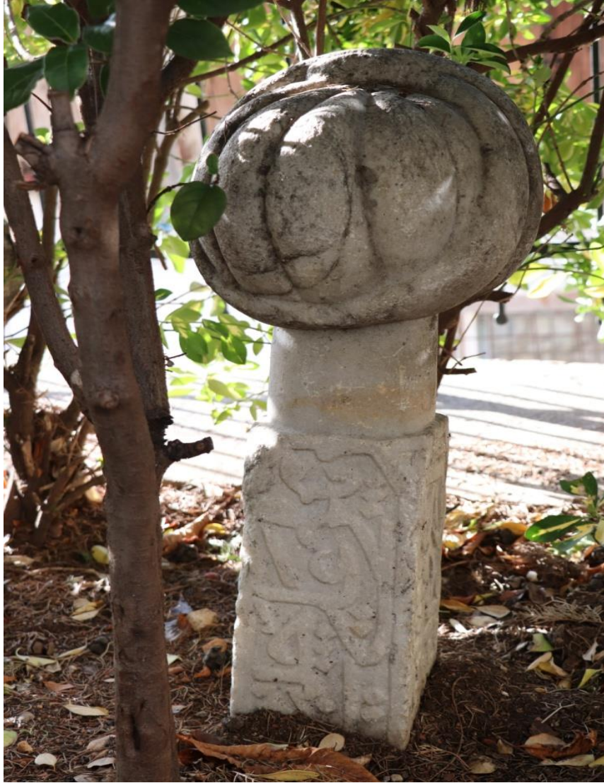
Resim 13: Üçüncü Mezar Taşının Ön Yüzü