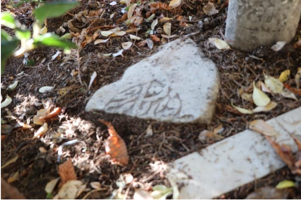
Resim 17: Beşinci Mezar Taşı (Foto: Emine Güzel, 2021)