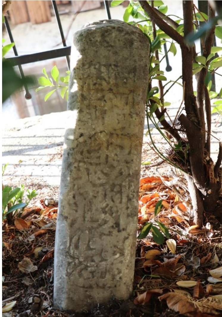
Resim 16: Dördüncü Mezar Taşı