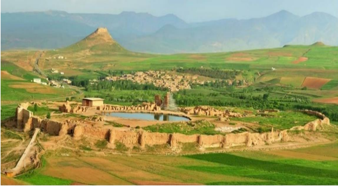
Resim 1. Unesco dünya kültür mirasında yer alan Taht-i Süleyman (Azîzîzelâlî- Aynînejâd- Ârifî, 1394 hş. s. 10).

Günümüzde Taht-i Süleyman olarak bilinen, (Resim 1-2) İlhanlı döneminin önemli tarihî mekânlarından biri olan Sugurluk'un tarihî sürecini on üçüncü yüzyıla kadar kısaca aktarmaya gayret ettik. Çalışmamızda İlhanlı dönemi araştırmalarında yönetim merkezi olarak çokça karşımıza çıkan ve oldukça tanıtılan Meraga, Tebriz, Sultaniye ve Alatak'ın gölgesinde kalan ve hakkında şimdiye kadar araştırma yapılmayan Sugurluk'u İlhanlı dönemi içerisinde ele almayı ve tanıtmayı hedeflemekteyiz. Bu doğrultuda Sugurluk'un İlhanlı dönemindeki tarihî sürecini ve siyasî önemi dönemin kaynaklarından istifade ederek aktaracağız.