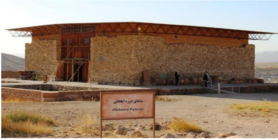
Resim 4. İlhanlılar zamanında inşa edilen dört sütunlu toplantı salonu 17