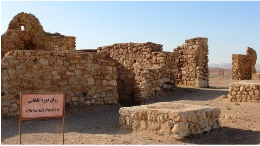
Resim 5. İlhanlı dönemi revakları 18