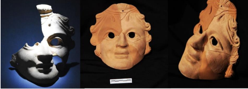
Şekil 4: Aizanoi Maskı.

Dorylaion'un merkezi olduğu düşünölen Şarhöyük'ün 7 km kuzeybatısında Eskişehir'in Kozyazı ve Kavacık Köyleri arasında yer alan Karatuzla Nekropolü de bölgenin Hellenistik dönemdeki ölü gömme geleneğiyle ilgili bilgi veren kısıtlı yerlerden biridir. 2001 yılında yapılan kurtarma kazısında, 9 adet mezarda tespit edilmiştir. Mezarların altısı oda mezar, biri taş sanduka tipi mezar, diğeri ise basit toprak mezardır. Oda mezarlar, kayaya açılan dikdörtgen planlı çukurlara kalker taş blokların yerleştirilmesiyle inşa edilmiştir. Mezarların tamamında Hellenistik Döneme ait seramik parçaları tespit edilmiştir. Bunlar arasında megara kâseleri, kulplu kaplar ve kantharoslar bulunmuştur. Ayırt edici bir mezar hediyesine rastlanmamıştır. 26