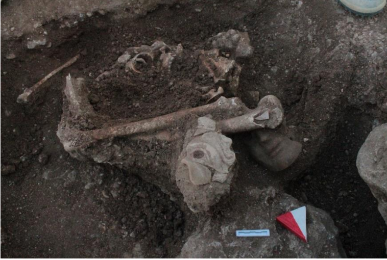
Şekil 3: Aizanoi Kuzey Nekropolü. Mask'ın bulunma anı.

Kentin kuzey nekropolündeki bu demografik çeşitliliğe karşılık, güneyde, Ana Tanrıça Kutsal Alanı'nın yakınında bulunan nekropoldeki bulgular, bu alanın Hellenistik dönem mezarların kentin varlıklı ailelerine ait olduğunu göstermiştir. 1992 yılında gerçekleşen bir kurtarma kazısında ortaya çıkan anıtsal mezar yapısında tespit edilen ve kentin Latin ailelerinden birine ait, iyi işçiliğe sahip lahdin yanı sıra, 24 2014'te yapılan bir başka kurtarma kazısında bulunan ve MS 2.yüzyıla ait olan 11.10 x 7.30 m ölçülerinde bir anıtsal mezar temeli, kuzey nekropoldeki mezar mimarisi ile belirgin farklılıklar göstermektedir. 25