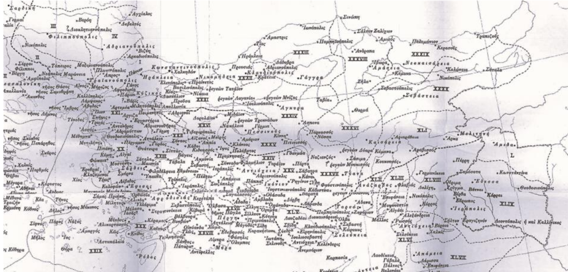
Harita 1: Hierokles Listesindeki Anadolu Eparkhiaları ve Kentleri (Hierokles, Le Synekdemòs d'Hiérokless et l'opuscule géographique de Georges de Chypre).

Thrakike Diokesisi'nini oluşturan Europe, Aiminontos, Rhodope, Thrake, Skythia ve Mysia II olmak üzere toplam 6 Eparkhia'dan üçü (Europe, Rhodope ve Aiminontos) bugün Türkiye Trakya'sı sınırlarında kalan kentleri barındırır (Tablo 1). Synekdemos'da birinci sırada verilen Europe, Thrakia'nın en doğu ucunu kapsar. Dolayısıyla Konstantinopolis'in bulunduğu alan da bu Eparkhia'nın sınırları içerisinde. Ancak Konstantinopolis yönetsel açıdan Eparkhiaların üstünde yer aldığı için, Eparkhia Europe'ye bağlı değildir. Europe'ye bağlı olan 14 kent, üç grup altında toplanmıştır 57 . Notitiae Episcopatumum'da Europe'nin piskoposluk merkezi olan Herekleia, Synekdemos'ta ikinci sırada verilmektedir. Thrakike Diokesisinin diğer iki Eparkhiasının ise sadece birer kenti bugün Türkiye topraklarındadır. Bunlardan biri, listede ikinci sırada verilen Rhodope'deki Ainos (Enez) 58 , diğeri de listede dördüncü sırada verilen Aiminontos kentlerinden Hadrianopolis'dir 59 . Hadrianopolis, Notitiae Episcopatumum'da Eparkhia'nın piskoposluk merkezidir.