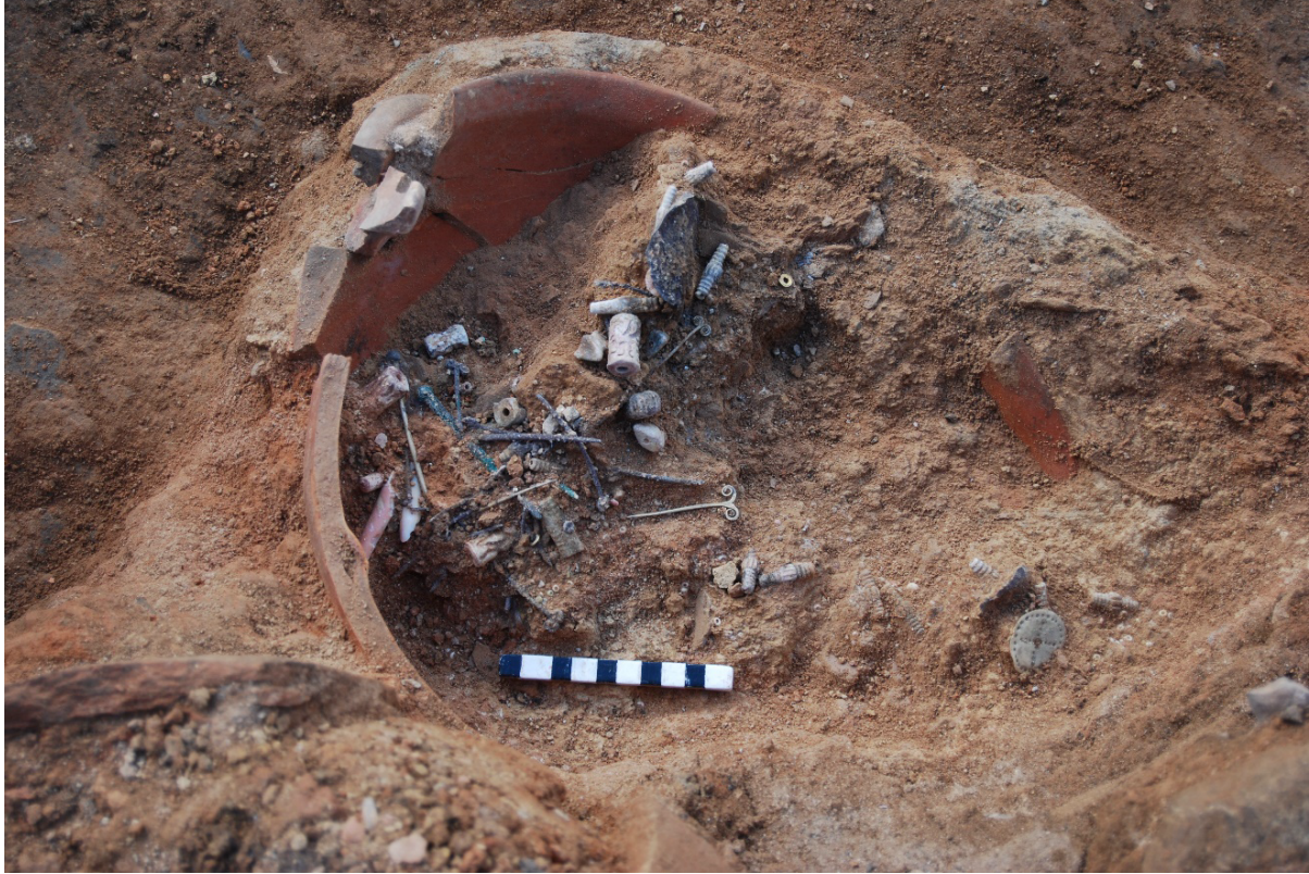
Fig. 1. Boncukların buluntu durumu

Çalışmanın konusunu oluşturan figürlü boncuklar, Seyitömer Höyük V/B evresi'nde höyüğün güneybatısında saray kompleksi olarak adlandırılan yönetici yapısının ana odasında çanak içinde ele geçirilmiştir (Fig. 1). Bu yapı, bir ana oda, bunun önünde bir ön oda ve etrafındaki çok sayıdaki depo odasından oluşmaktadır 2 . Saray kompleksinde toplam 13 oda yer almaktadır. Bu odalarda, 1'i ana oda ve 4'ü küçük odada olmak üzere toplam 5 adet boğa başlı ocak bulunmaktadır. Oda içlerinde yer alan boğa başlı ocaklara dayanarak bu odaların yaşam alanı diğer odaların ise depo odası olduğu düşünülmektedir 3 . Saray olduğu düşünülen yapının oldukça büyük bir alanı kapsadığı, dolayısıyla sadece buluntuları bağlamında değil aynı zamanda mimari anıtsallığı ile de önemli bir yapıyı işaret ettiği anlaşılmaktadır. Ayırt edici yapısal niteliklerinin yanı sıra diğer mekanlarda karşılaşılmayan, değerli ve sıra dışı buluntuları nedeniyle bu yapı kompleksinin diğer yapılardan ayrıcalıklı bir kullanım gördüğü önerilebilir. Kompleksin ana odasında çanak çömlek buluntularının yanı sıra altın, gümüş ve bronzdan yapılmış saç iğneleri, kolye, rozet gibi takılar, boncuklar ve Mezopotamya kökenli 10 adet Akad silindir mührü gibi oldukça önemli buluntular tespit edilmiştir 4 .