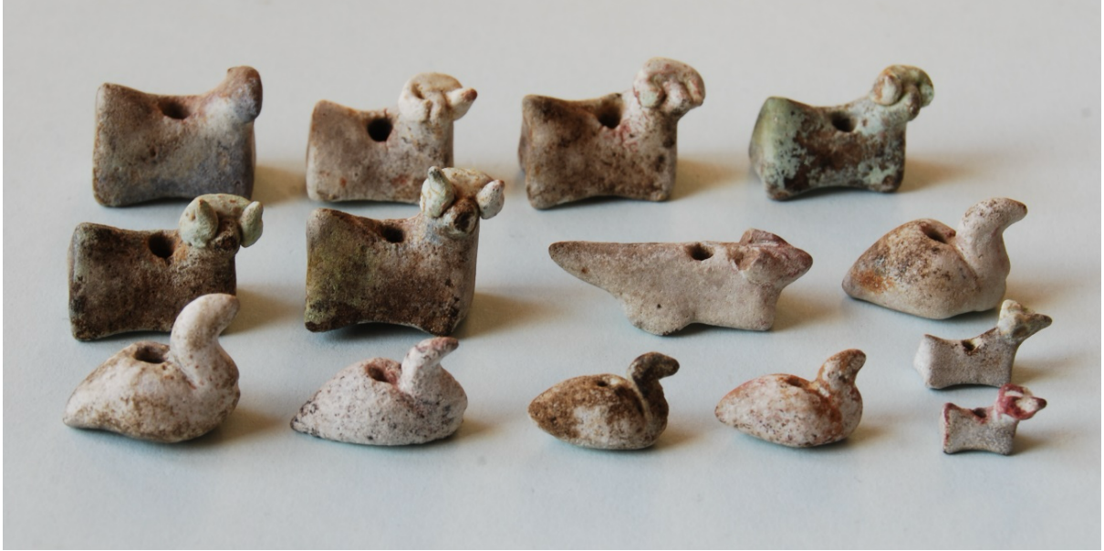
Fig. 2. Figürlü boncukların toplu fotoğrafı

Söz konusu yönetici yapısının ana odasında bulunan bir çanağın içinden 14 adet fayans 5 hayvan figürlü boncuk ele geçirilmiştir. Boncukların 8 adedi koç, 5 adedi ördek ve 1 adedi de tanımlanamayan bir hayvan biçiminde stilize tasvir edilmiştir (Fig. 2).