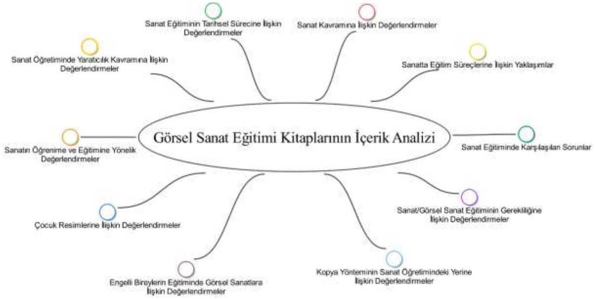
Şekil 1. Temalar Gösterimi

Şekil 1’de görüldüğü gibi kitaplar 10 temadan oluşmaktadır. Bu 10 tema içinde “Çocuk Resmi” temasına “Çocuk Resimlerine İlişkin Değerlendirmeler” koduyla değinilmiştir.