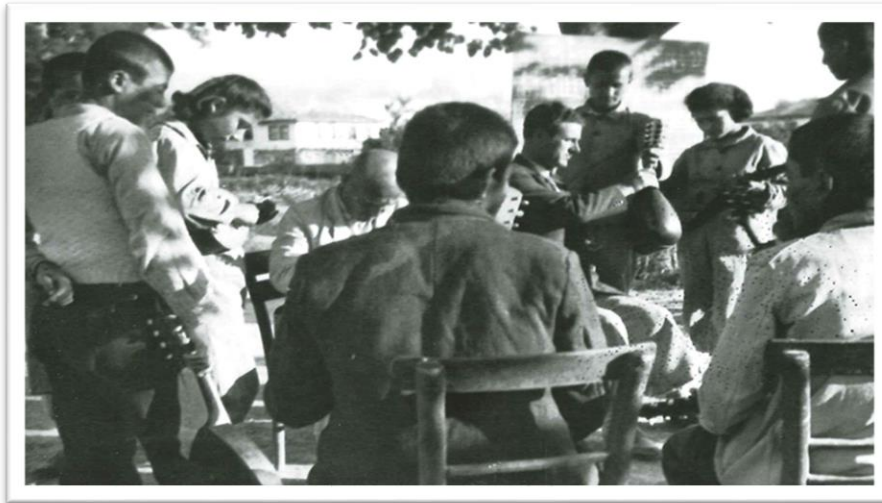
Resim 3 Akpınar Köy Enstitüsü (Mandolin Çalmayı Öğrenen Öğrenciler)

Öğrencilerin kültürel gelişimi ile ilgili önemli bir nokta da Köy Enstitülerinde müzik, tiyatro, edebiyat, halk oyunları gibi etkinliklere yer verilmesidir. Her öğrenci mutlaka bir müzik aleti çalmalıdır. Bu müzik aleti genellikle mandolindir (Aytemur, 2007: 132).