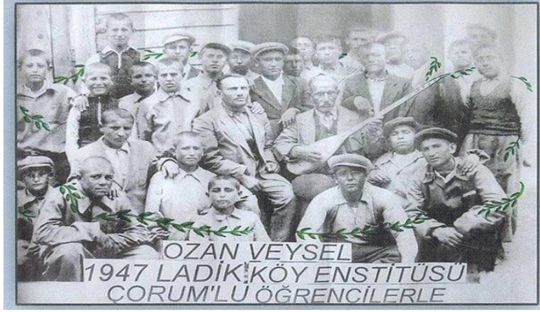
Resim 2 Çorum Ladik Köy Enstitüsü (Âşık Veysel)

Köy Enstitülerinde verilen müzik eğitimi tahta üzerinden notaların öğretilmesi yerine öğretilmesi hedeflenen şarkı ya da türkünün doğrudan dinletilerek seslendirilmesi sağlanmıştır. Müzik derslerinin enstitülerde doğrudan bir sınıf ortamında değil günlük yaşamlarına da adapte edilmiştir. (Ersil, 2007: 39). Müziğin, insan ruhunu ve bedenini olumlu yönde etkilediği düşünülecek olursa, dinlemek, söylemek ya da icra etmek ve müziği bir eğitim aracı olarak haz alınacak bir unsur haline dönüştürmek öğrenci üzerinde kalıcı izler bırakacağı düşünülebilir. Ayrıca farklı kültürler, bölgeler ve yörelerin yaşam biçimleri, geçmişleri, duyguları müzik aracılığı ile aktarıldığında yaşanan etkileşimin bireyi hem olumlu yönde etkileyeceği hem de yeni müzik formları ile tanıştırabileceği söylenebilir.