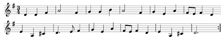
Şekil 13. Litvanya Halk Şarkısı Motule mano