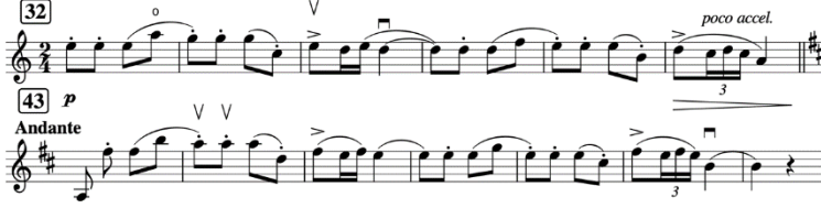
Şekil 14. Gruodis Keman Sonatı II. Bölüm 1. Ezgi Örneği

Eserin ikinci bölümündeki ezgi örneği tonal bakımdan incelendiğinde, la eksenli eolyen modunda olduğu, sonrasında ise si ekseninde tekrar kurgulandığı görülmektedir. Eksen değişimi genel olarak halk müzikleri ezgilerinde görülen bir özellik olarak, Litvanya halk müziğinde de görülen karakteristik özelliklerden biridir. Örnek ezgide Letonya ve Litvanya halk müziklerinde görülen ikili sekizlik ses gruplarından oluşan ritmik yapılar ve motif içinde ardıl olarak aynı seslerin kullanılması durumu karşımıza çıkmaktadır.