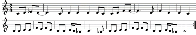
Şekil 10. Voi volunge volungele Ezgi Örneği