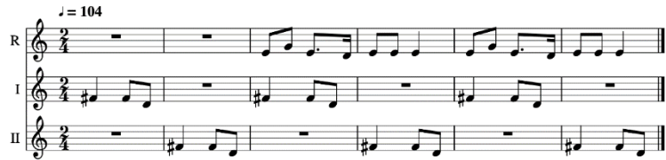
Şekil 3. Kazilio Ezgi Örneği

Sutartinė , ezgi yapısı itibarıyla halk müziğinin minimal bir formu olarak görülebilmekte, aynı ezginin tekrarlanmasından ötürü ise müziğin önem bakımından metnin arkasında olduğu ve metnin önemini vurgulamak için kullanıldığı değerlendirilebilmektedir. Öte yandan kısa müzikal cümlelerin, ana ezgiye eşlik etmede kolaylık sağladığı, standart bir eşlik yürüyüşü geliştirmede kolaylaştırıcı bir etken olduğu gözlemlenebilmektedir. Örnek olarak gösterilen Kazilio isimli ezgi örneğinde, tipik bir Sutartinė eşliği görülebilmektedir.