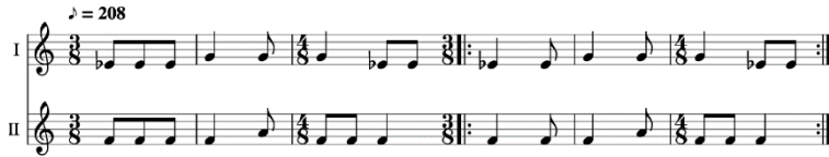
Şekil 2. Mano vainikas, judabra Dvejinė Ezgi Örneği

Sutartinė yapısal özellikleri değerlendirildiğinde, bazılarının çeşitli metrik değerleri de içinde barındırdığı görülmektedir. Majör ikili aralıkların da seslendirilerek disonans etki yarattığı görülen örnek ezginin Biržai bölgesinde yer alan Gavėniškis köyünden derlendiği bilinmektedir.