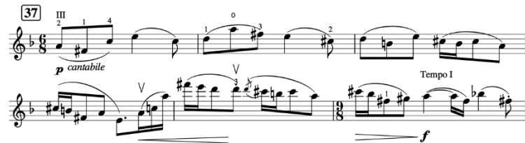
Şekil 12. Gruodis Keman Sonatı I. Bölüm 2. Ezgi Örneği

İkinci ezgi örneğinde, la eksenli bir heksatonik yapı kullanılmakta, altere seslerle birlikte tonal değişimin sağlandığı görülmektedir. Majör karakterdeki bu ezgi cümlesinin bitiminde, farklı bir eksene geçilmiş ve metrik değer değişmiştir. Ezginin Motule mano isimli Litvanya halk şarkısı ezgisi soyutlanarak oluşturulduğu görülmektedir.