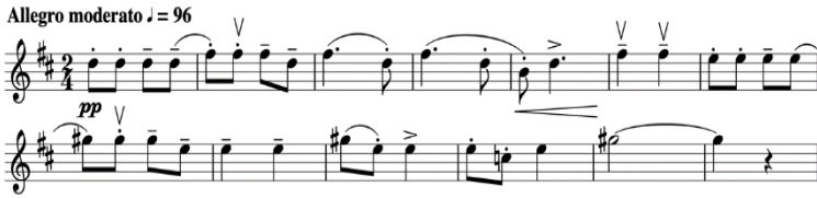
Şekil 15. Gruodis Keman Sonatı IV. Bölüm 1. Ezgi

Final bölümü olarak isimlendirilen dördüncü bölümde yer alan örnek ezgi tonal olarak incelendiğinde, ilk cümlede re olan eksenin, ikinci cümlede mi olarak değiştirildiği görülmektedir. Burada da motif içinde ikili sekizlik ses gruplarından oluşan ritmik yapılar ve motif içinde ardıl olarak aynı seslerin kullanılması durumu, karakteristik özelliğin yansıması olarak değerlendirilebilmektedir. Eserin bu bölümü içinde bu tema farklı sesler üzerinde kurgulanarak tekrarlanmış, eksensel değişiklikler bu bölümlerde de görülmüştür.