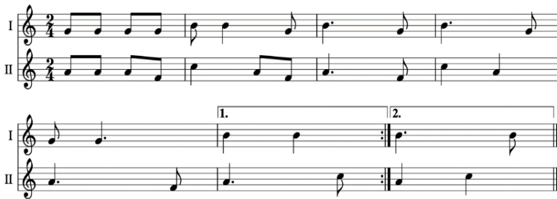
Şekil 17. Man čiučiulis, man miegelis Ezgi Örneği

Gruodis'in bu bölüm içinde kullandığı ve bölümün ana teması olan ezgi, 1925-1926 yılları arasında yapılan derleme çalışmalarında, Panevėžys ilçesine bağlı Biržai bölgesindeki Klausučiai köyünde derlenmiş olan Man čiučiulis, man miegelis isimli Sutartinės ezgisinden alıntılanmıştır. Buttall'a göre (2015) Sutartinės 'in otantik ezgisi, finalin ana temasını, esasen daha lirik bölümlerle serpiştirilmiş uysal bir bölümü oluşturmuştur. Kromatik armoninin daha sağlam bir diyatonik bitişe yol açtığı, özellikle etkileyici bir koda ile sonuçlandığını dile getirmiştir.