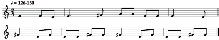
Şekil 1. Sutartinė Örneği İsvedu Ozį Ezgi Örneği

Litvanya halk müziğinin karakteristik özellikleri değerlendirildiğinde, halk müziğinin polifonik stildeki icrası olarak nitelendirilen Sutartinė , öncelikli olarak Litvanya halk müziğinin özgün formu olarak karşımıza çıkmaktadır. İki veya daha fazla sesle söylenen bu şarkıların icrasında, belirli ezgisel yapıların kullanılmasıyla ana ezgiye eşlik edilmektedir. Sutartinė icracıları genel olarak, kısa bir müzik cümlesini farklı sözlerle tekrarladığından, eşlik eden ezgilerin yapısal özellikleri de birbirine benzemektedir. Eşlik eden ezgideki fonksiyonel yürüyüşler bazen disonans sesler meydana getirmektedir. Litvanya Folklor Arşivi'nden örnek olarak gösterilen İsvedu Ozį 9 isimli ezginin, Kaunas'ta kaydedildiği bilinmektedir.