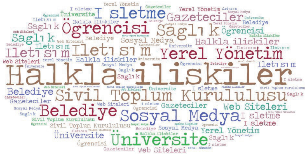
Şekil 2: Lisansüstü Tezlerin Anahtar Kelimelere Göre Dağılımları

Tablo-11’de yer verilen bilgilere göre çalışma kapsamındaki lisansüstü tezlerde belirlenen örneklem grupları incelendiğinde, en yüksek oranda çalışma grubunun, ‘Belediye’ %11,7, olduğu ve çalışmaya sık rastlanmayan grupların ise %0,5 oranında, ‘Dünya Ülkeleri’, ‘Savunma Sanayi’, ‘Kadına Yönelik’ ve ‘Şans Oyunları’ olarak tespit edilmiştir.